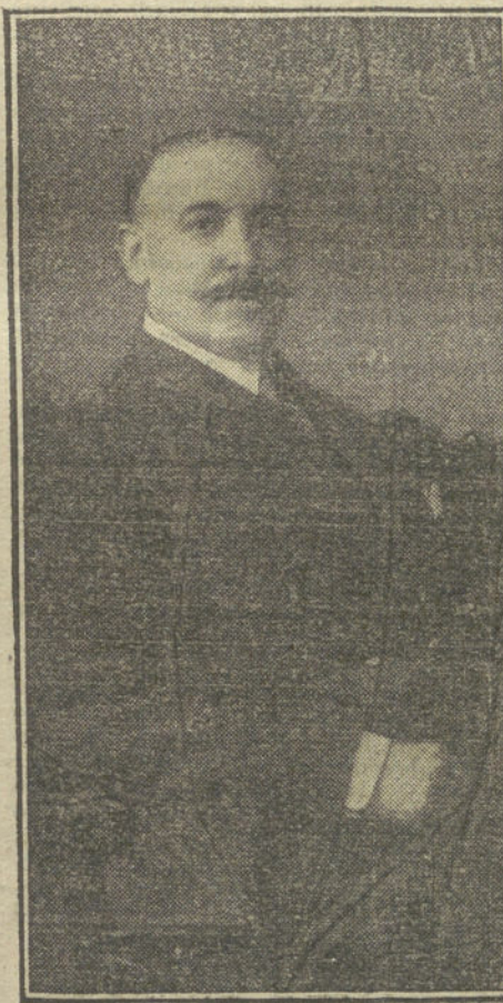
EDUARDO GOMEZ DE BAQUERO, ilustre escritor que ha publicado un libro titulado «Escenas de la vida moderna.»

Las ofertas se habrán de hacer en Tánger antes del 5 de Mayo próximo, y de ello se puede informar a los interesados en el ministerio de Estado.