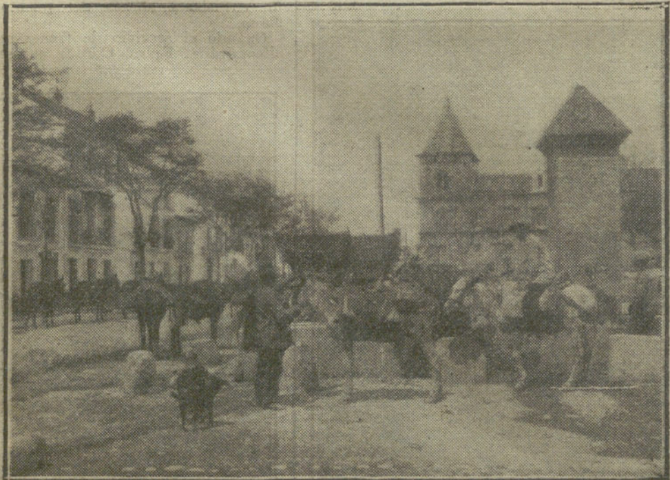
DURANTE LA FERIA DE SEVILLA.—Traticantes de carbón abrevando sus calbalduras en la fuente de la Macarena.

Al acto asistió numerosa concurrencia, siendo los oradores objeto de prolongadas ovaciones.