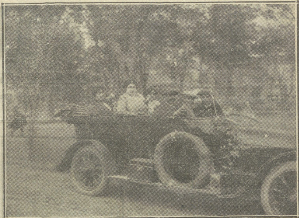
DURANTE LA FERIA DE SEVILLA.—Joselito el Gallo paseando en automóvil con su familia por los alrededores de la ciudad.

Dejando á un lado el apoyo monetario del Gobierno, y aun admitiendo que el Municipio barcelonés pueda disponer como le guste de unos 80 millones de pesetas para permitirse una fantasía fi-