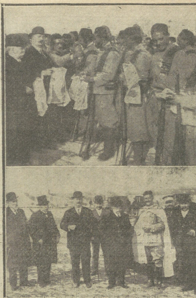
EN EL CAMPAMENTO DE CARABANCHEL.—Los delegados de los Centros Comerciales haciendo donativos a los moros.—El coronel Berenguer y sus oficiales hablando con los delegados.—Entrega al batallón de Madrid de la bandera con que los moros dieron guardia en Palacio.

CON SOLO 15 CUPONES, QUE EMPEZARAN A PUBLICARSE EL PROXIMO DOMINGO, TENDRA USTED OPCION A UNO DE LOS 50 DECIMOS DEL SORTEO DE LA LOTERIA DEL 10 DE MAYO, QUE REGALA LA TRIBUNA.