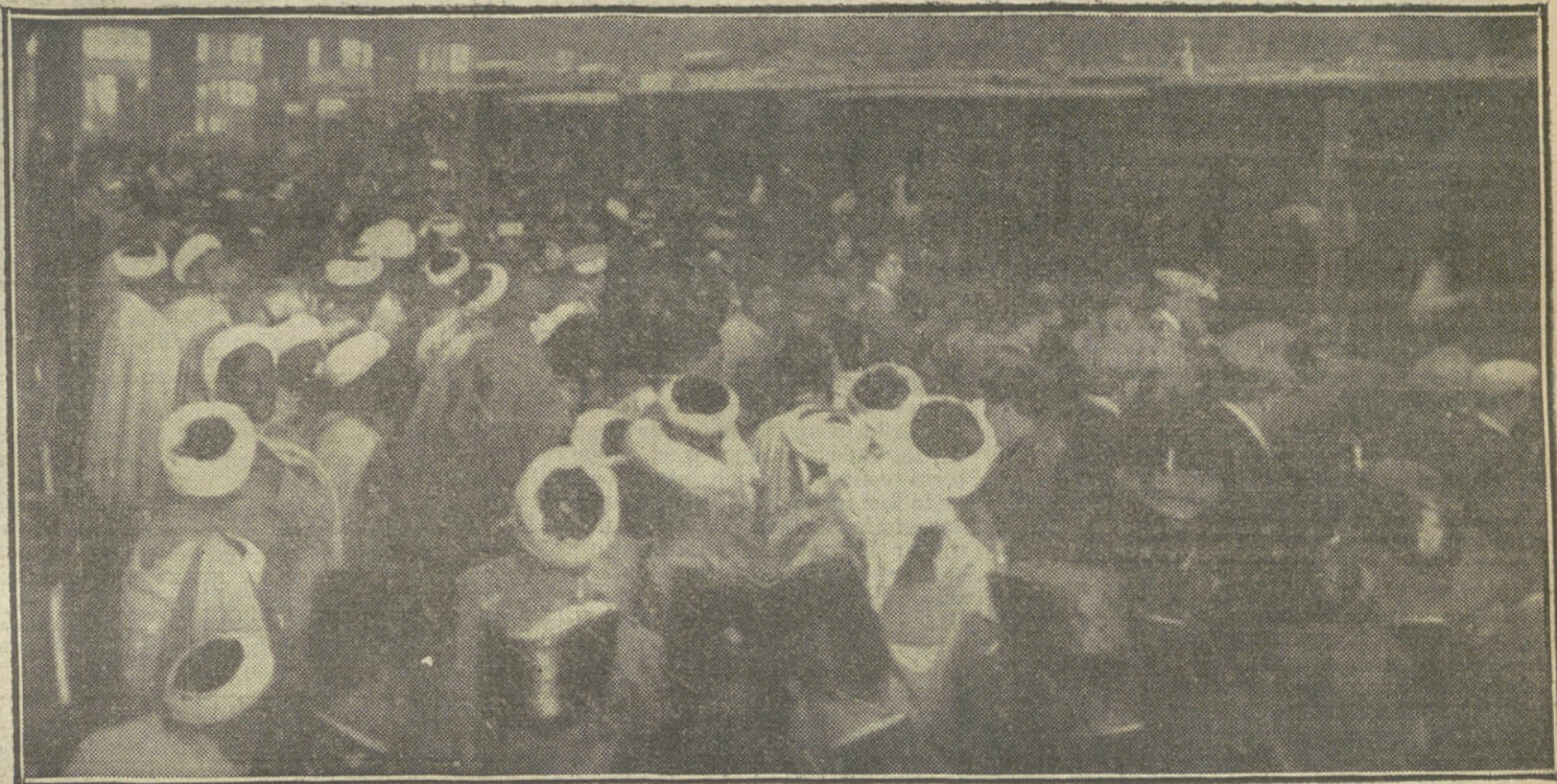
LOS MOROS SE HAN IDO.—Soldados de Caballería de las tropas regulares al montar en el tren que los habrá de conducir á Málaga.

En estos momentos, los amigos de Raspail trabajan activamente y gastan mucho dinero en una investigación de gran trascendencia. Se trata de saber y poner en claro, si la frase del gran químico al Rey «se puede extraer el arsénico hasta de la pata del sillón