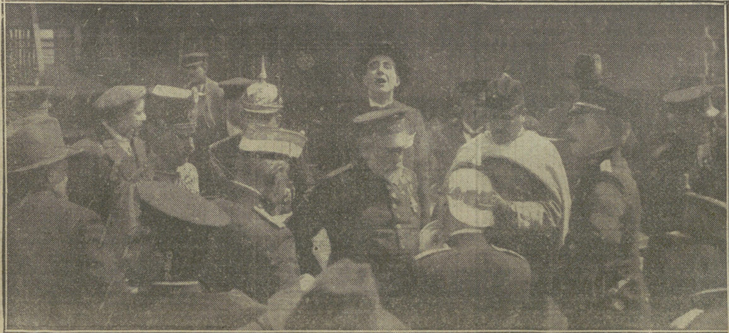
LOS MOROS SE HAN IDO.—El Infante Don Fernando, el capitán general de Madrid, los generales Tovar y Garrido, y otros que acudieron á despedir al coronel Berenguer y á las fuerzas moras que se han marchado hoy á Málaga.

Cuando el servicio de trenes sea público, irá al Ferrol Coruña entera.