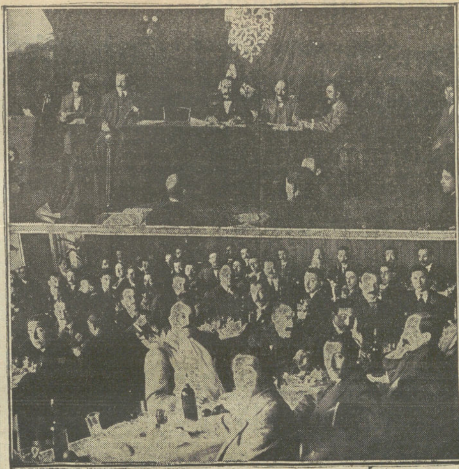
Primera Asamblea de dependientes y empleados del comercio y de la industria de Cataluña, organizada por el Centro Autonomista de Dependientes del Comercio y de la Industria, de Barcelona.—Banquete para celebrar el feliz éxito de la Asamblea.

Nos ha visitado una numerosa Comisión de vecinos de la calle de Monteleón, denunciándonos el siguiente inaudito hecho: Del número 31 de esa calle fueron desahuciados los inquilinos de una guardilla, madre é hijo, ella anciana y él muy joven, pero sin poder trabajar, por padecer una absoluta sordera, a causa de la cual no le admiten en los talleres. La pobre gente sacó su misero ajuar a la calle, y en ella está viviendo DESDE HACE DIEZ DÍAS, durmiendo al raso, comiendo de la caridad de los vecinos y destruyendo poco a poco sus enseres para calentarse de noche. El espectáculo es desconsolador y revela la ineffectividad de la acción oficial para remediar estas desventuras. Ni la tenencia de alcaldía, ni la flamante é inútil Asociación Matritense de Caridad han hecho nada porque esta vergüenza termine. Llamamos su atención para que protejan a esa familia, digna de toda compasión.