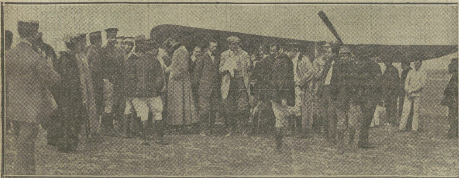
El aviador Tixier, que ha hecho el «raid» Sevilla-Madrid, á su llegada á Cuatro Vientos, rodeado de los alumnos de la Escuela militar de Aviación.

La vista se celebrará en los primeros días del próximo mes de Junio.