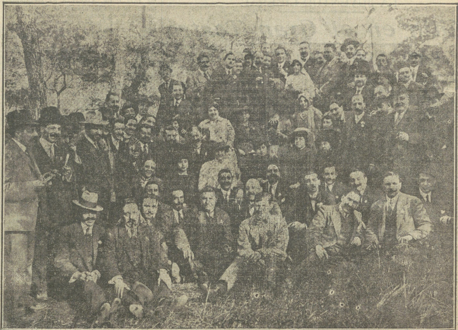
EL CONGRESO DE GINECOLOGIA DE VALENCIA.—Grupo de invitados al banquete celebrado en la Dehesa de la Albufera.

Como se ve, por la anterior Exposición de trabajos el Centro Comercial Hispano-Marroquí está haciendo una labor asidua y eficaz en beneficio de la industria y comercio españoles.