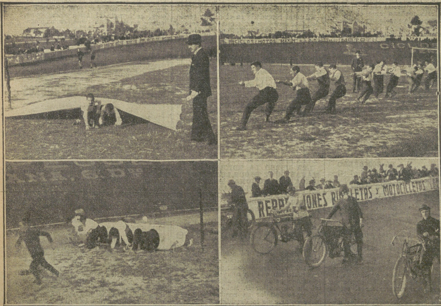
FESTIVAL EN LA CIUDAD LINEAL, A BENEFICIO DE LOS TUBERCULOSOS POBRES.—Los alumnos de Medicina, vencedores en el juego de la cuerda.—Corredores que tomaron parte en la prueba final de motocicletas.—Otro aspecto de las carreras de obstáculos.

De todos modos, y con el propósito de evitar, si es posible, este tropiezo, intentará el conde de Romanones una solución de concordia, que por ahora consiste, al parecer, en la candidatura del Sr. León y Castillo.