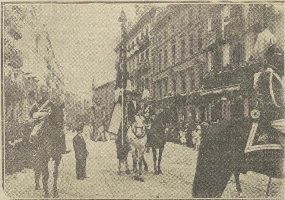
UN DETALLE DE LAS FIESTAS DEL CORPUS EN BARCELONA.—El pendón de la ciudad al frente de la típica procesión.

El revisor.—Eso depende del tiempo que lleve usted en el andén.