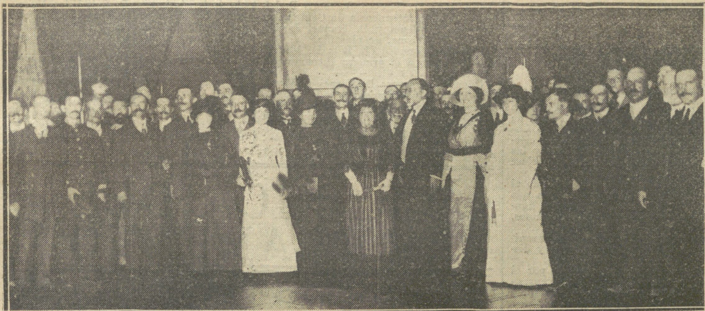
Recepción en el Ayuntamiento de los congresistas que han asistido á las sesiones de las Asambleas de Artes del Libro y Cazadores.

mismo sentimiento fecundo, inmenso, santo del amor, cada día más encendido y acendrado á la madre Patria.