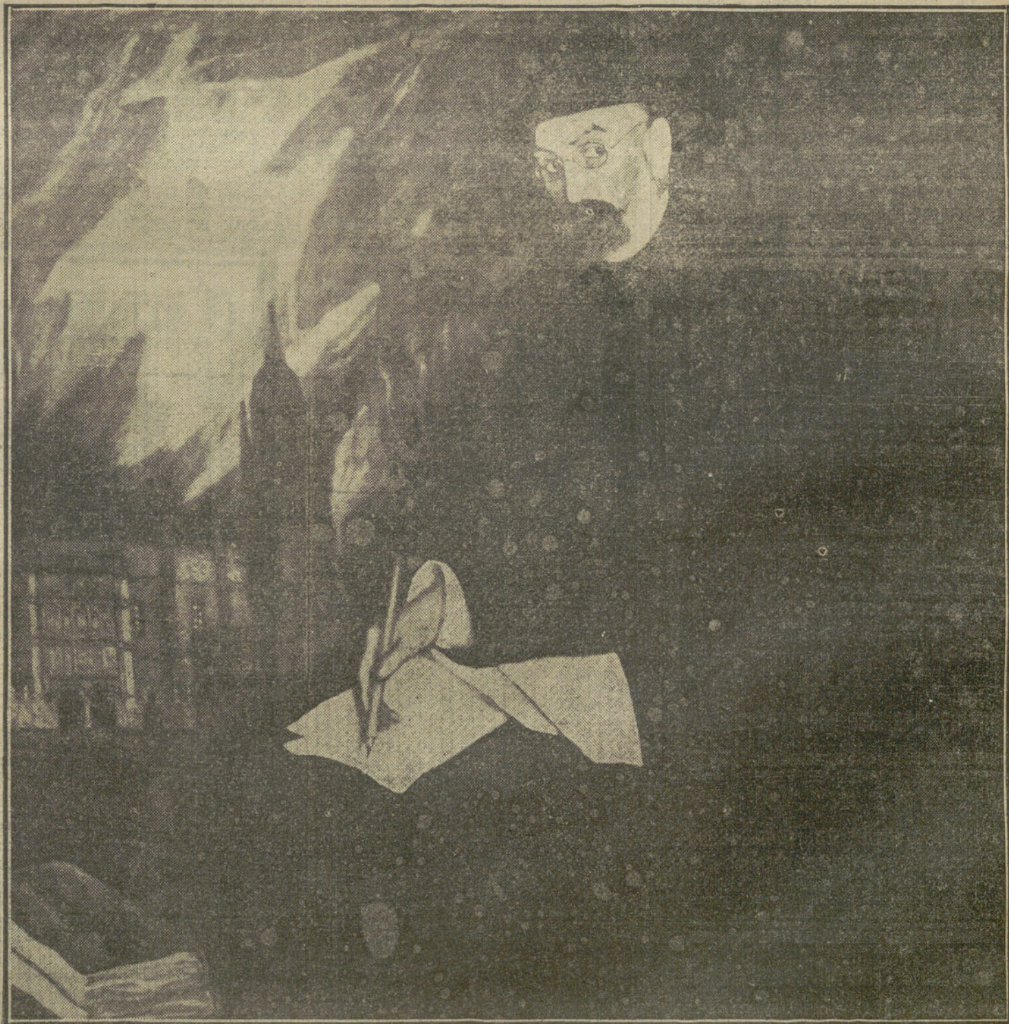
EN LA EXPOSICION ZUBIAURRE.—Retrato de D. Miguel de Unamuno.

En obras carreteras no han trabajado hoy moros, por ser día de zoco.