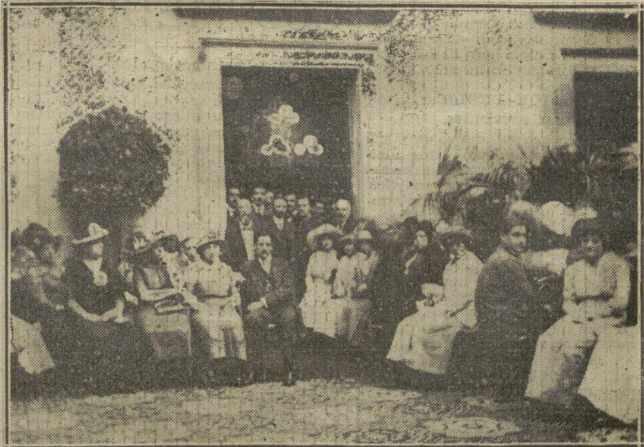
Los asistentes á los Congresos de Artes del Libro y Cazadores, durante el concierto celebrado en su honor ayer tarde en el Ayuntamiento.