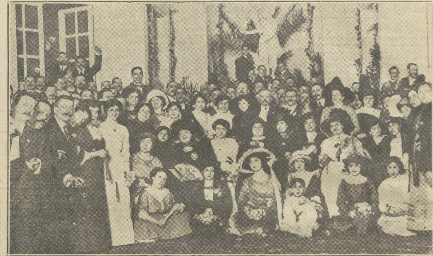
EL II CONGRESO NACIONAL DE LAS ARTES DEL LIBRO.—Grupo de asistentes al banquete celebrado en el hotel Ritz.

La Asociación de maestros de Madrid ha elegido a los señores presidente del Consejo de ministros, ministro de Instrucción pública y director general de Prisiones, en un respetuoso y razonado mensaje, en el que los ma-