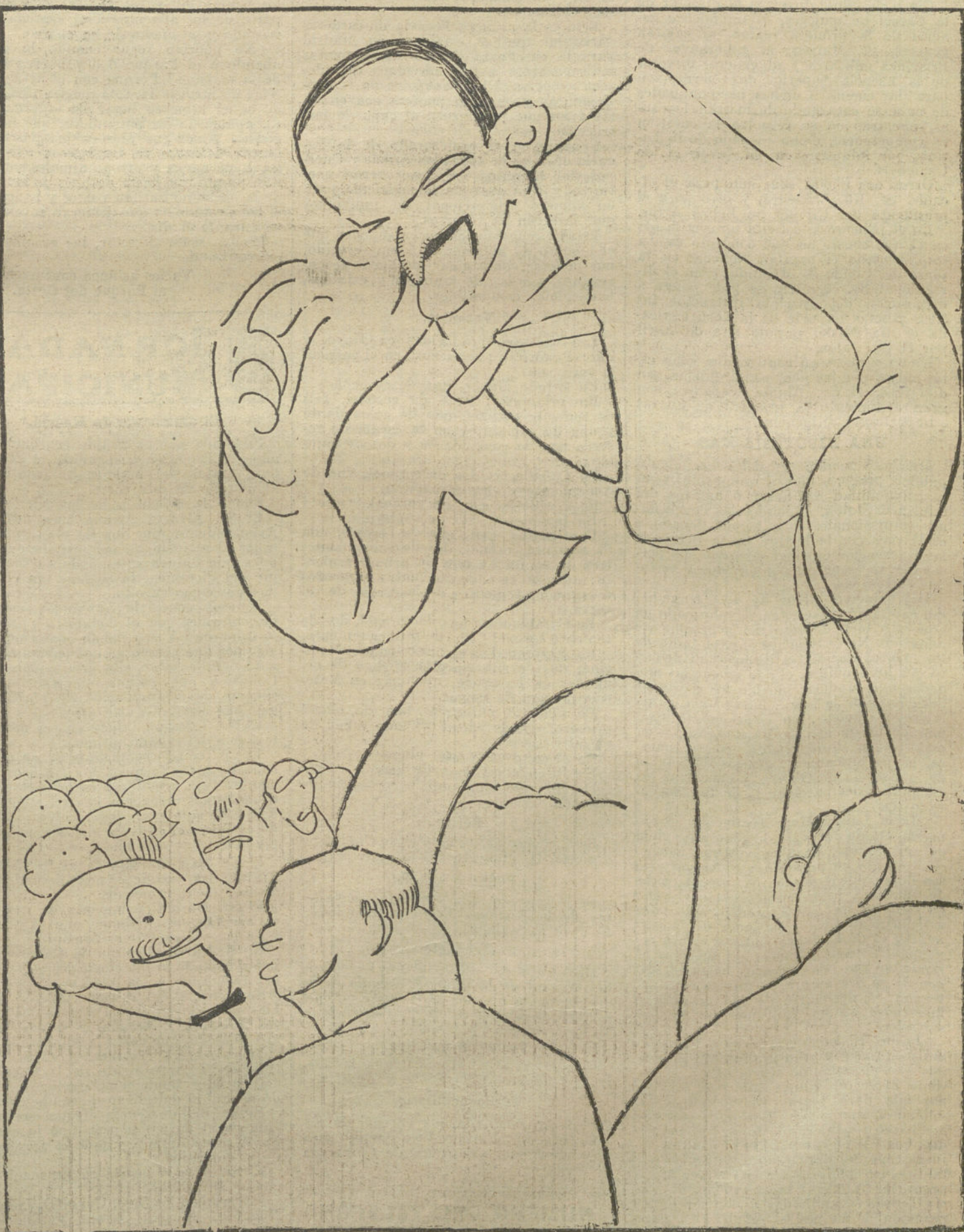
LA SOLUCION DE LA CRISIS.—De la nota oficiosa: «El Gobierno continuará presidido por el conde de Romanones tal y como éste se halla constituido.»

¿Está esto claro? Hay que hablar claro, con luz y taquígrafos, y no como hasta ahora, en que se trama con tanto recato que ni «La Epoca», de ordinario tan habilidosa, se ha enterado todavía.