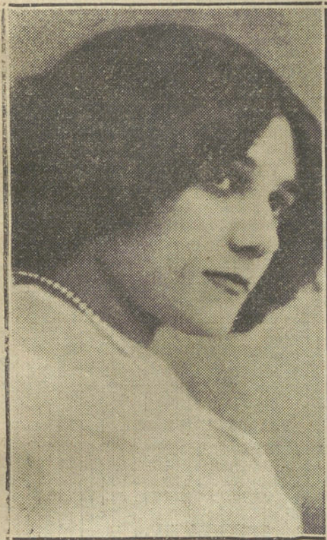
MIMI DRITZ, notabilísima artista, una de las mayores atracciones de la compañía de «varietés» del teatro de la Comedia.

Se le ha tributado una grandiosa despedida. El muelle se hallaba invadido por una enorme multitud y por todas las autoridades.