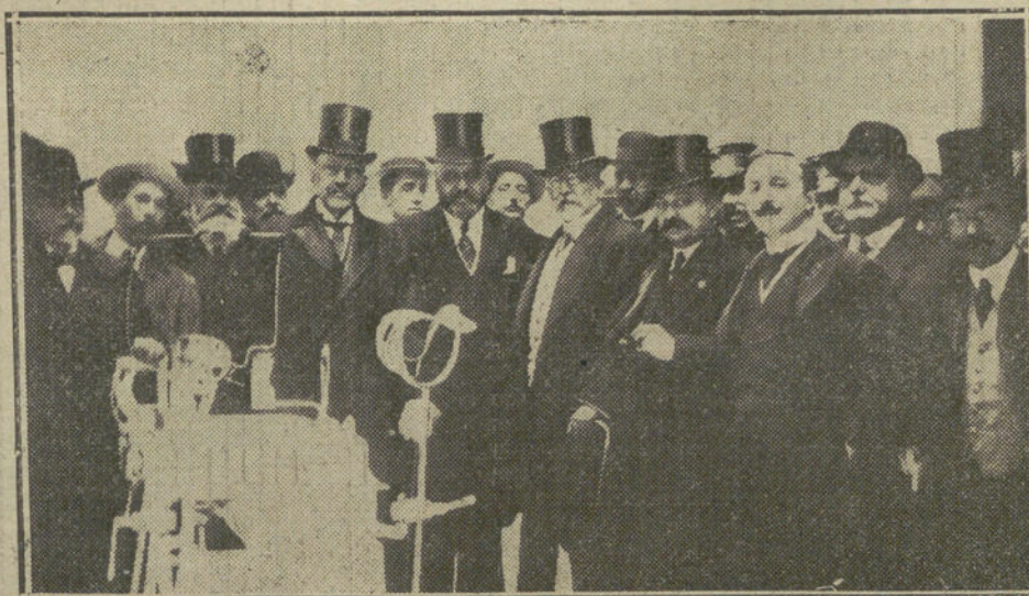
Las autoridades é invitados durante la inauguración de la Casa de Socorro del distrito del Centro.

NUMERO DEL TELEFONO DE «LA TRIBUNA»: 3.600.