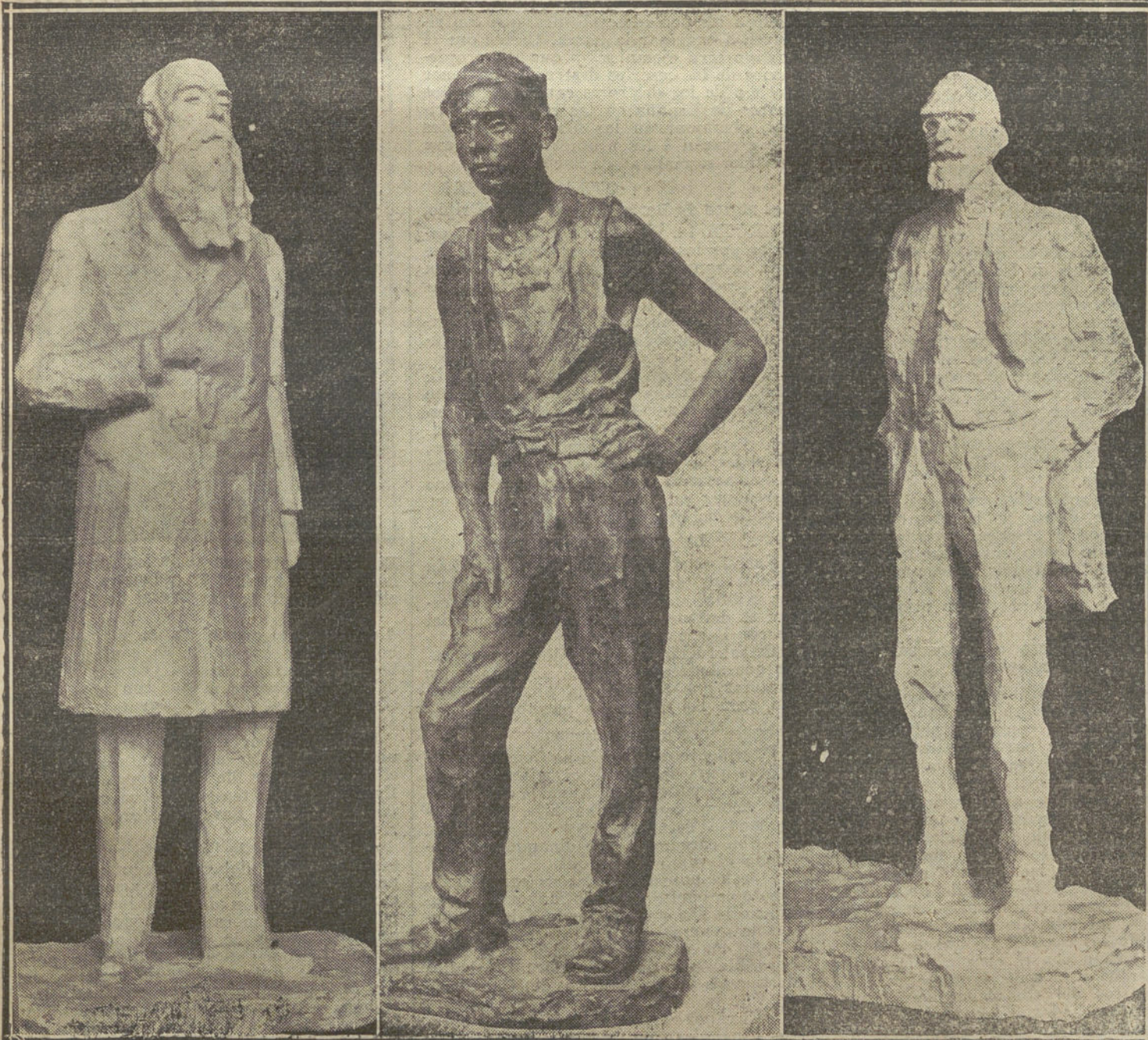
LA EXPOSICION GARDONA EN EL ATENEO.—Caricaturas corpóreas de D. Alejandro Pidal y D. Gumersindo Azcarate. En el centro, una de las esculturas que más llaman la atención.

Los obreros hojalateros en huelga han publicado un anuncio en los periódicos ofreciéndose para trabajos particulares.