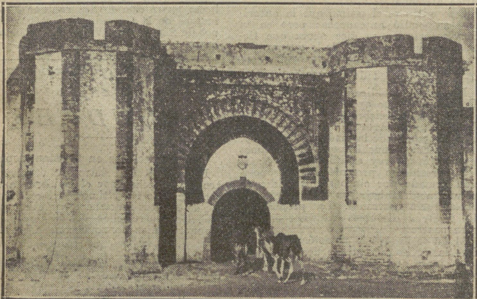
Una de las puertas de entrada a Tetuán, donde están acampadas nuestras tropas.

Romanones dijo que eran cada día más favorables las noticias de Marruecos, y que el bombardeo de Anghia cerca de Tánger no podrá traer de ninguna forma complicaciones internacionales, pues lo ha hecho España en uso de su perfecto derecho.