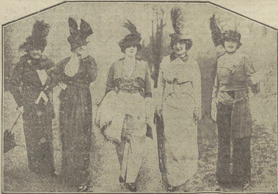
LA MUJER Y LA MODA.—Últimos modelos.