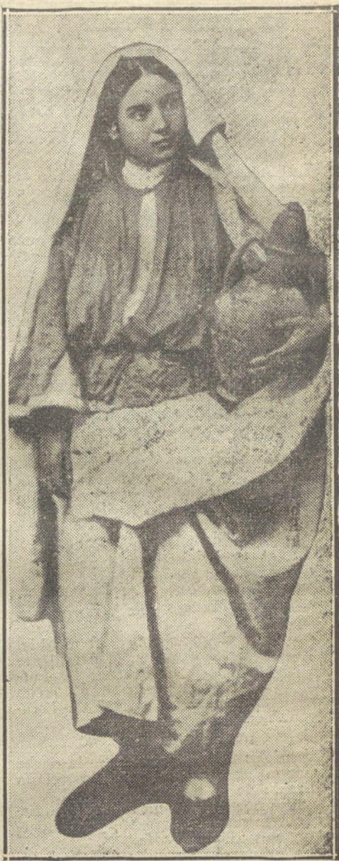
Una belleza tetuaní, típicamente vestida.

SAN ILDEFONSO 18. En automóvil han llegado los Infantes Carlos y Raniero, que se supone regresarán á Madrid esta misma noche.