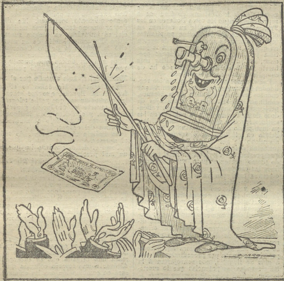
Demonstración gráfica de cómo se saca a flote un mal negocio. (Caricatura de «L'Esquella de la Torratxa», que ha sido muy celebrada en Barcelona.)

Es tan grande la despreocupación del primer ministro del Rey (y con repugnancia estampamos la frase), que a la ninfa a quien debe la vida gu-