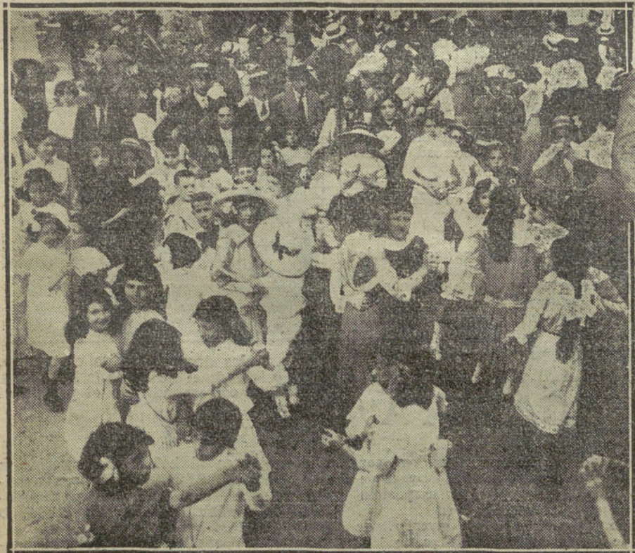
LA KERMESSE INFANTIL DEL DISTRITO DEL CENTRO.—Baile de niños.—Comprando billetes en la tómbola.

Y España, cogida entre la metrópoli francesa y sus grandes colonias—Argelia, Marruecos, el Congo, etc.—se convertiría en una carretera de Francia, en otra colonia suya, y desaparecería su nacionalidad.