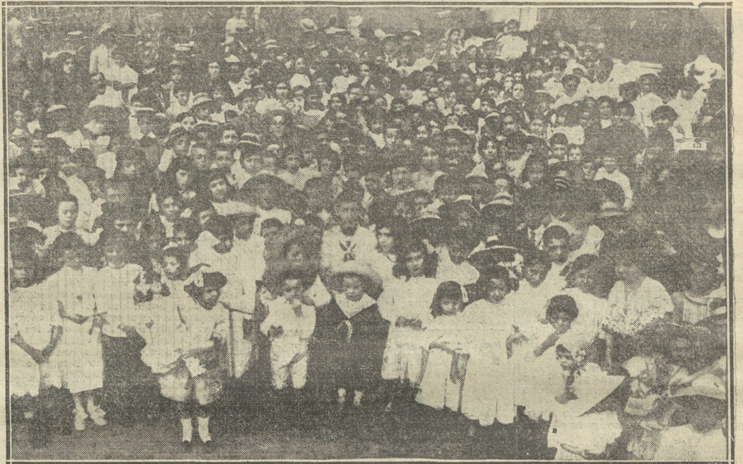
Grupo de niños que asistieron á la «kermesse» infantil del distrito del Centro.

No se ha fijado todavía fecha para las elecciones administrativas y legislativas. —Haves