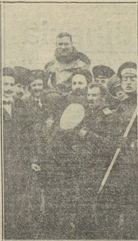
El célebre aviador francés Brindejone des Moulinais, que ha hecho un «raid» de 5.000 kilómetros en aeroplano, recorriendo en triunfo toda Europa.

SEVILLA 4. Los vecinos del pueblo de Castilleja han visitado al acusador privado del crimen de la ermita, manifestándole que al asistir ayer á un sepelio que se verificaba en el cementerio, descubrieron escondido en el osario el cadáver de un hombre, que tenía la cabeza cubierta con una chaqueta negra,