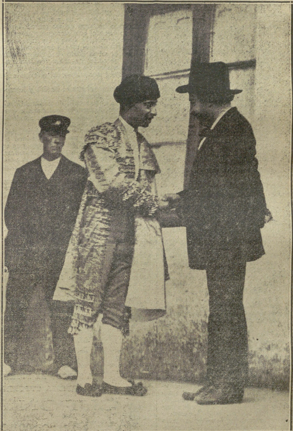
Eugenio Noel, saludando a Rafael Gómez en la Plaza de Toros de San Sebastián, después de una gran faena del Gallo y de una conferencia de Noel en contra de los toreros.

En vista de que el personal de servicio en el hospital era impotente para reprimir el tumulto, se llamó a los guardias de Seguridad.