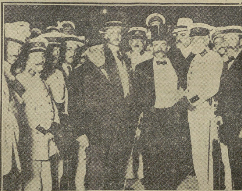
El general Marina, el Gobierno y algunos de los generales, jefes y oficiales que fueron á despedir al alto comisario.