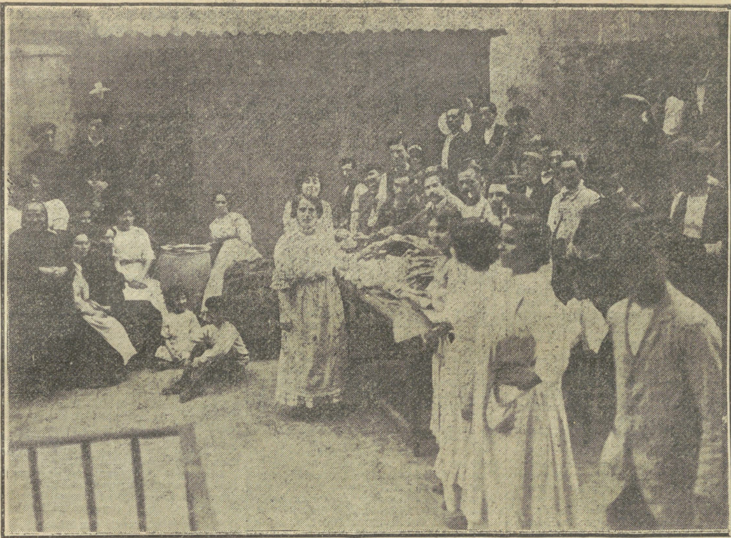
LA HUELGA DE BARCELONA.—Reparto de socorros en víveres y metálico a los huelguistas de géneros de punto por la Junta de su Sociedad de resistencia.

El ex capitán Sánchez, separado del servicio por un Tribunal de honor, se retrata en su prisión vestido de uniforme.