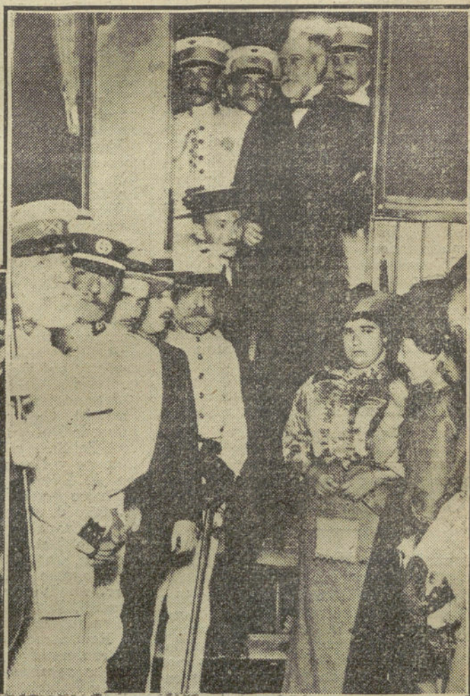
El general Marina y sus ayudantes en el «break» de Obras públicas en el momento de salir el tren.