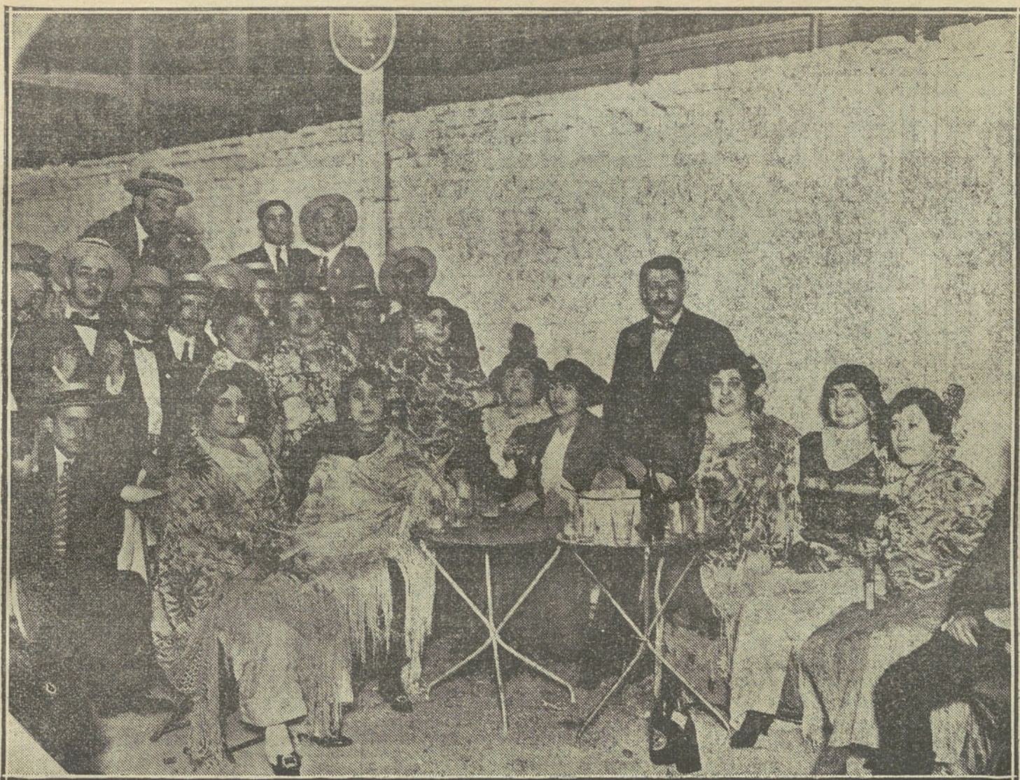
MADRID VERBENERO.—Aspecto de una de las mesas ocupadas por artistas que tomaron parte en la fiesta celebrada anoche en el Cinema Azul.

drá proponer en su dictamen un recargo hasta del 10 por 100 sobre la cuantía de las multas.