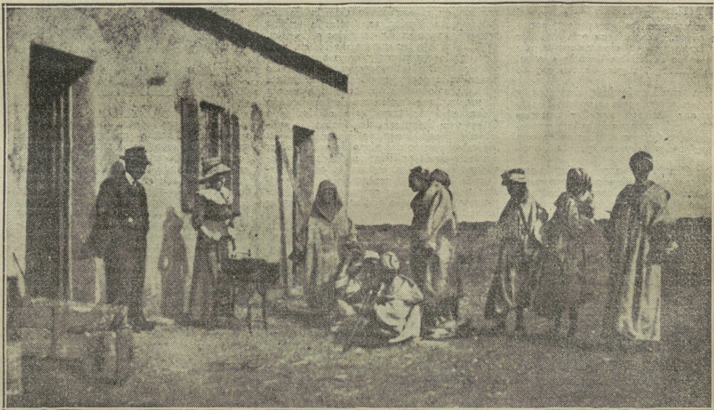
LA PENETRACION PACIFICA.—A la puerta de una casa europea, en Ben-Slimam (Marruecos francés), un gramófono maravilla a los árabes, que piensan en un oculto poder sobrenatural.