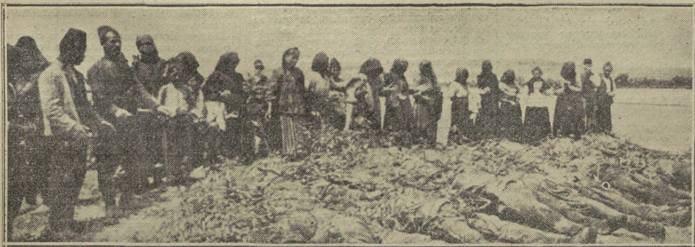
EL FINAL DE LA GUERRA BALKANICA.—Inhumación de 70 turcos muertos por los búlgaros en su retirada de Adrianópolis.

El cadáver de uno de los que la tripulaban ha aparecido flotando sobre las aguas. El del otro ha desaparecido.