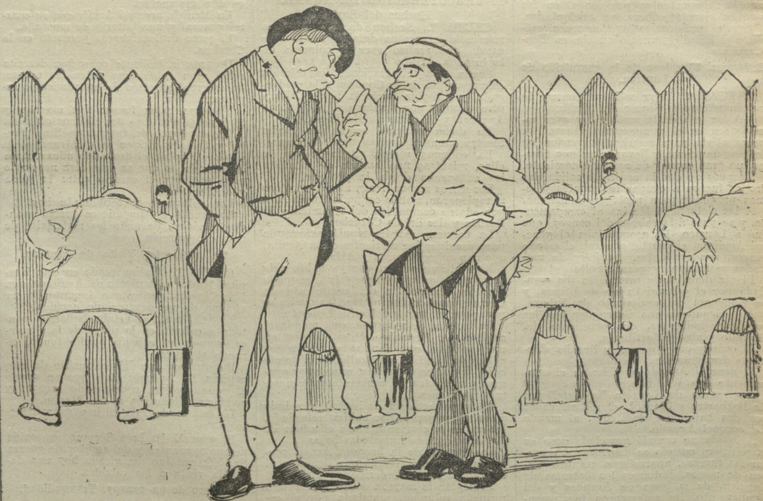
—¿Conque de blanco y azul las vallas?... —¡Anda, y hasta la teresiana remozada del alcalde! (Caricatura de AGUSTÍN.)

Continúa Larita una faena sosa con exceso de trapo, y en tablas del siete señala un pinchazo desprendido.