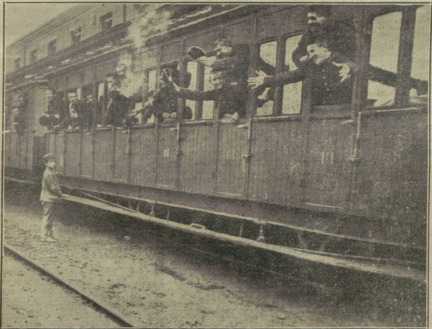
EMBARQUE DE TROPAS PARA AFRICA.—Momento de arrancar el tren de la estación de Bilbao conduciendo a los soldados de aquella localidad que van a Melilla.

Dijo también que deben estar prevenidos para la huelga, pues en la de Barcelona, los patronos, favorecidos durante veinte años con las tarifas arancelarias, no han subido los salarios.