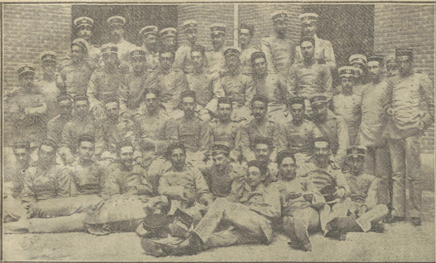
Alumnos de la Academia de Ingenieros, promovidos a oficiales recientemente.

—Otro disponiendo que la asignatura de Caligrafía se curse en dos lecciones semanales durante los dos años del grado elemental de la carrera de maestro, dejando de darse en el primero del grado superior; que asimismo, la asignatura de Dibujo deje de darse en el grado superior, y se curse también en dos lecciones semanales en el grado elemental, y que los profesores de los Institutos que expliquen en las Escuelas Normales las asignaturas de Religión, Dibujo, Francés y Caligrafía, perciban como remuneración las gratificaciones que se mencionan.