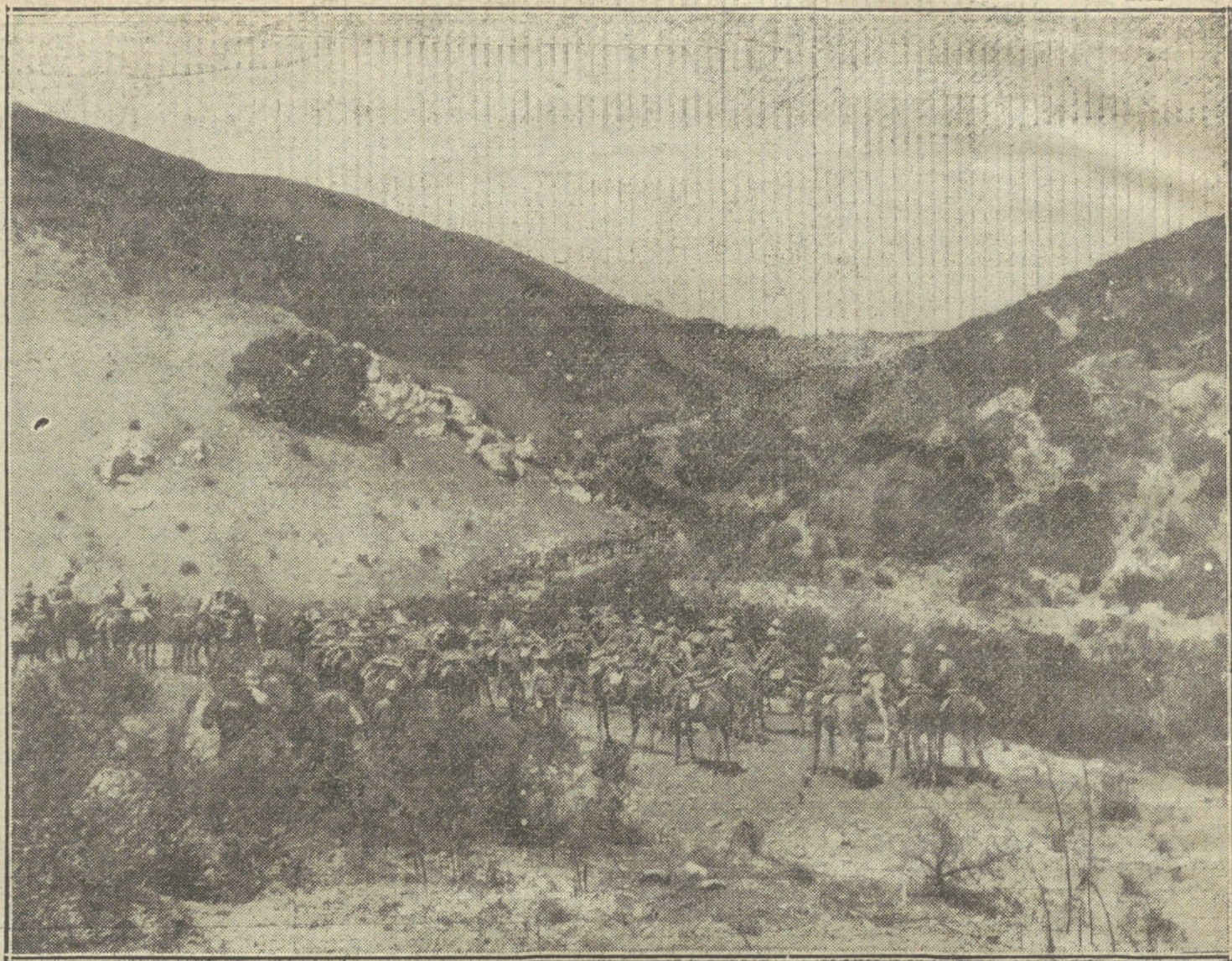
NUESTRA ACCION EN MARRUECOS.—La columna del general Arráiz subiendo a Kudia Federico para emprender una operación.

indaga cuál es el medio más propio a su respetabilidad de hacer su entrada solemne en la santa ciudad, y en estas idas y venidas se nos va el coche, y así quedamos pesarosos por esta mala suerte que nos dejó abandonados en el Rincón. Más todo habían de ser contratiempos, que si el coche valenciano de viajeros allá voló con sus seis caballos trotones y enjazeados como para feria, aún quedaban aquí los carros Lonner, de Sanidad Militar, que trajeron heridos y enfermos, y que ahora han de volver con el convoy. Pedimos autorización, y, concedida, nos acomodamos en este triste vehículo, donde tantas veces el dolor de la guerra se refugiara.