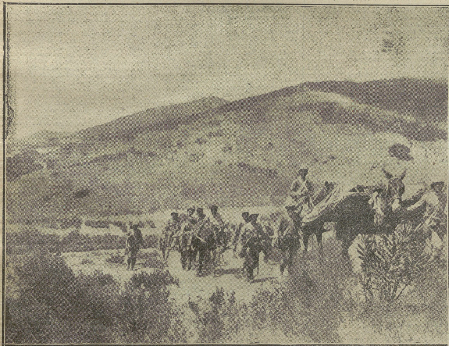
NUESTRA ACCION EN MARRUECOS.—Ambulancia de montaña conduciendo heridos.

EN LA ADMINISTRACION DE «LA TRIBUNA» HAY A LA VENTA CUPOS ATRASADOS PARA LOS LECTORES QUE DESEEN COMPLETAR SUS COLECCIONES.