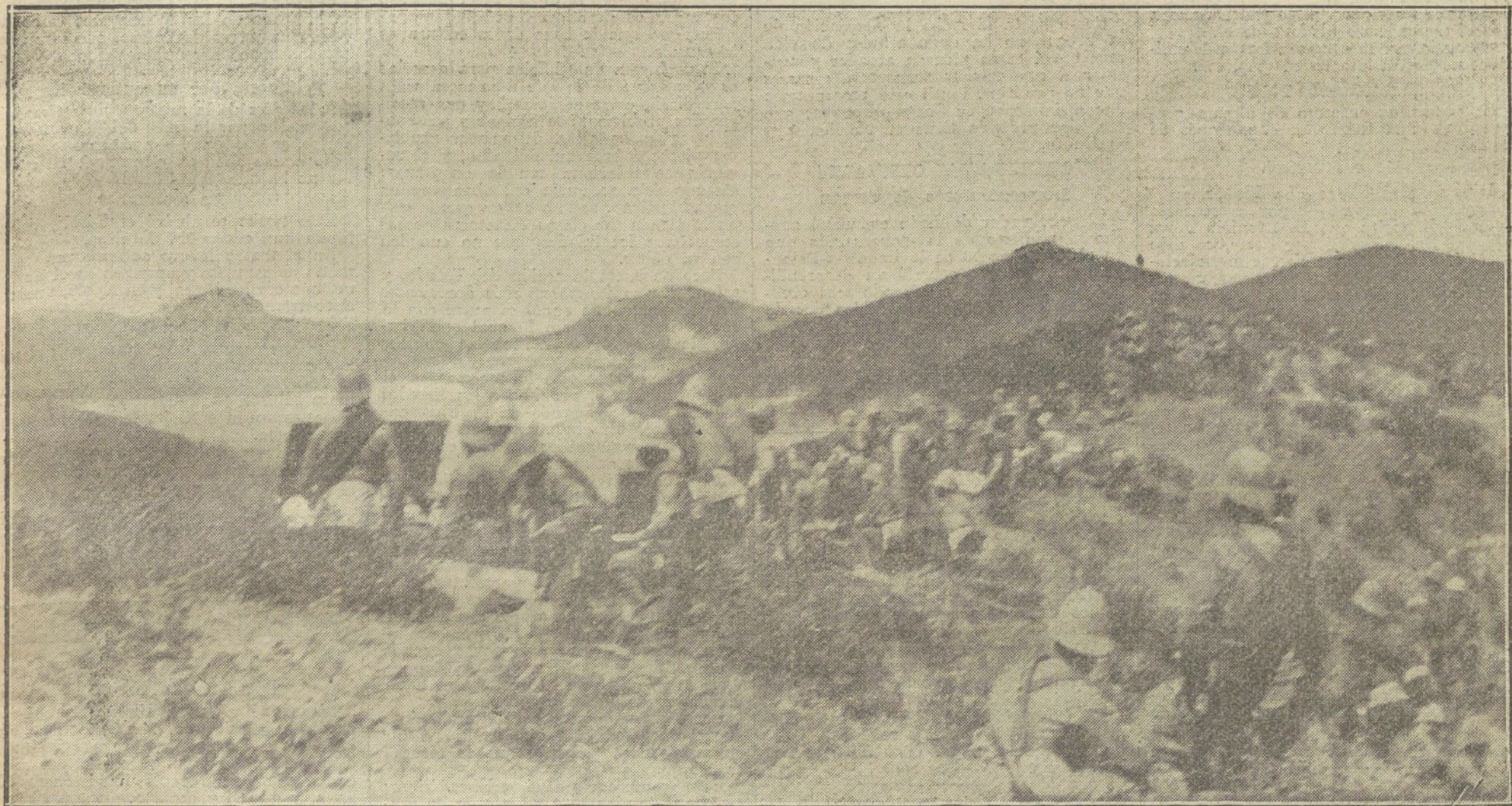
NUESTRA ACCION EN MARRUECOS.—Batería de montaña, mandada por el capitán Aguilera, disparando sobre las trincheras moras de Biutz.