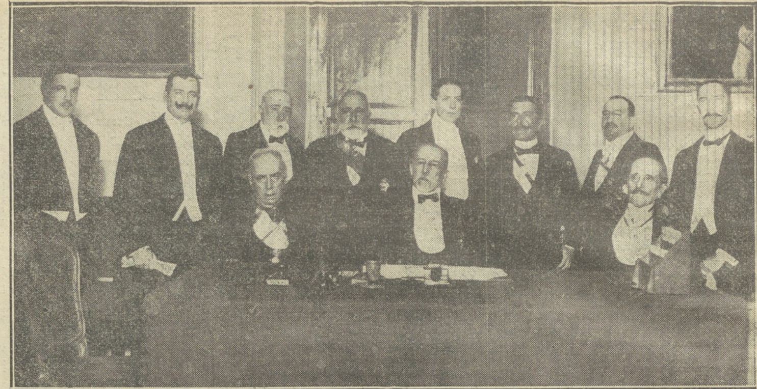
EL DIA DE BALBOA.—El ministro de Instrucción pública y los representantes americanos y oradores que tomaron parte en la sesión en honor de Vasco Núñez de Balboa, verificada ayer en la Sociedad Geográfica.

Leyendo aquella carta del padre Feijóo, involuntariamente se me ocurrió dramatizarla, y así como el pintor en la diminuta plasta de pintura azul que decora su paleta ve compendiado y en germen todo un firmamento ó un océano, yo, en cada uno de aquellos adagios contradictorios entre sí veía la expresión sintética de otros tantos caracteres humanos, los cuales, reunidos en una triple unidad de lugar, tiempo y acción, necesariamente habían de chocar con patética violencia. Esto fué en mí un puro proceso especulativo. En el autor dramático, el proceso es activo y se verifica á la inversa, esto es, partiendo de la creación de los caracteres. Una vez creado un carácter, ha de obrar conforme á la norma indeleble á que su naturaleza le obliga, y sus palabras han de estar de continuo saturadas de la sustancia y certidumbre, aunque sea instintiva y subconsciente, de sus actos futuros. De aquí que las palabras tienden á concentrarse en frases sentenciosas que pueden servir como refranes, porque los caracteres dramá-