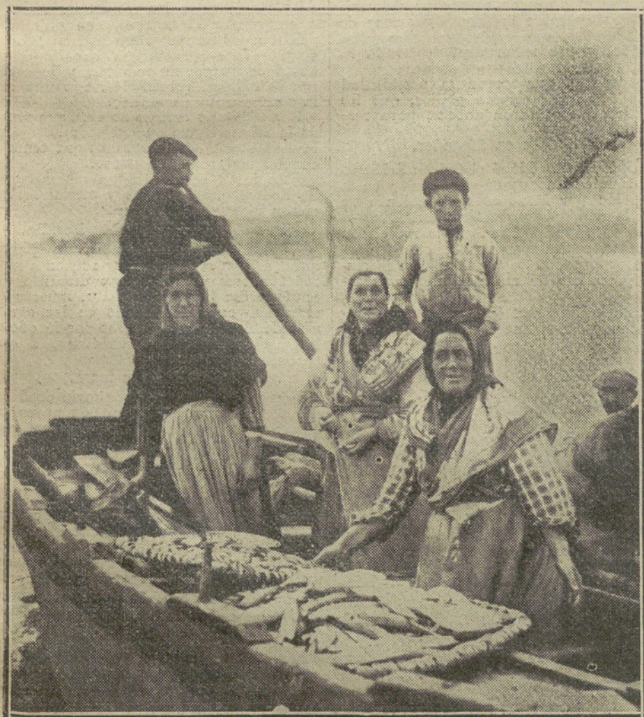
LA FOTOGRAFIA ARTISTICA.—Grupo de pescadores de Sada regresando al puerto.

tes aquí, y recordamos como última ridiculez lanzada por los diarios franceses, que M. Romanones iba á cantar en un café-concierto para ganar dinero, pues el Estado español no le pagaba su sueldo.