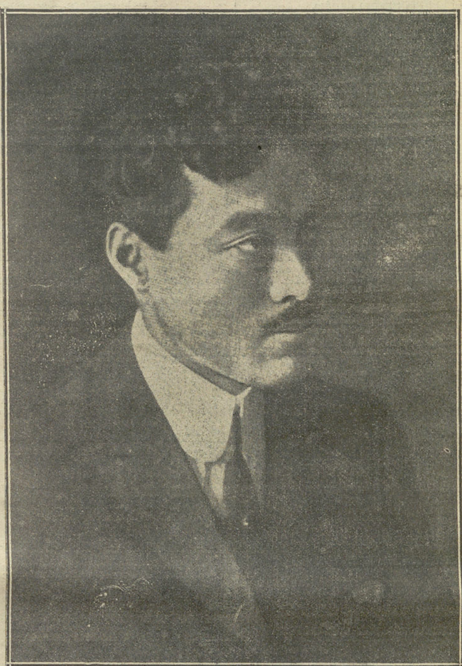
El doctor Hideyo Noguchi, del Rockefeller Institute, que ha conseguido aislar el germen productor de la rabia.