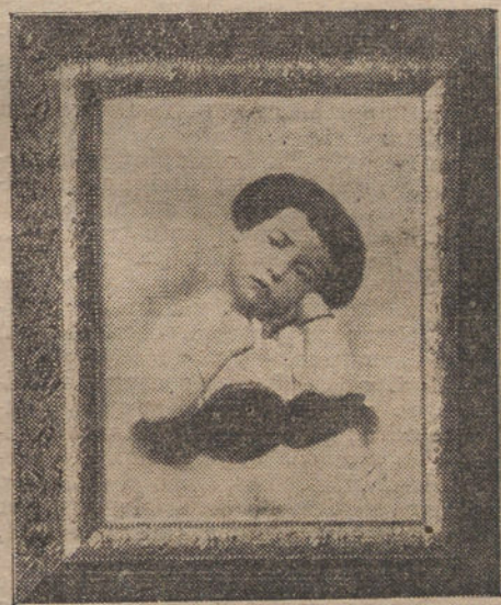
Modelo de las magníficas ampliaciones de gran tamaño que LA TRIBUNA regala a sus suscriptores.