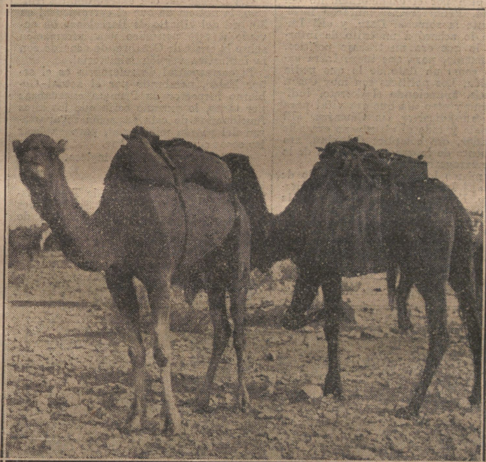
NUESTRA ACCION EN MARRUECOS. —Camellos cargados de mercancías, en el nuevo zoco de Monte Arruit, recientemente creado por el general Jordana.

El día en que los acontecimientos vengán á demostrar la verdad de nuestros gritos de alerta, al hacerse patentes las ansias de redención que aquí estampamos, el pueblo engañado se alzará furioso, y desde lo más alto á lo más bajo, se derrumbará todo, con gritos de espanto y lamen-