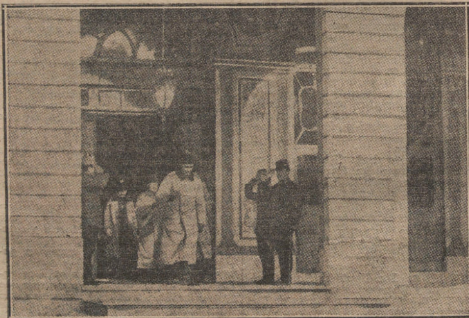
El general Liman y los oficiales alemanes que forman la Misión militar que ha llegado a Constantinopla.

Cirugía general, 72.—Operaciones, 5.—Ginecología, 287.—Operaciones, 14.—Huesos y articulaciones, 48.—Vías urinarias, 46.—Nariz, garganta y oídos, 106.—Operaciones, 15.—Oftalmología, 186.—Corazón y pulmones, 356.—Niños, 21.—Aparato digestivo, 39.—Piel y sífilis, 12.—Neurología, 43.—Odontología, 126.—Medicina interna, 5.