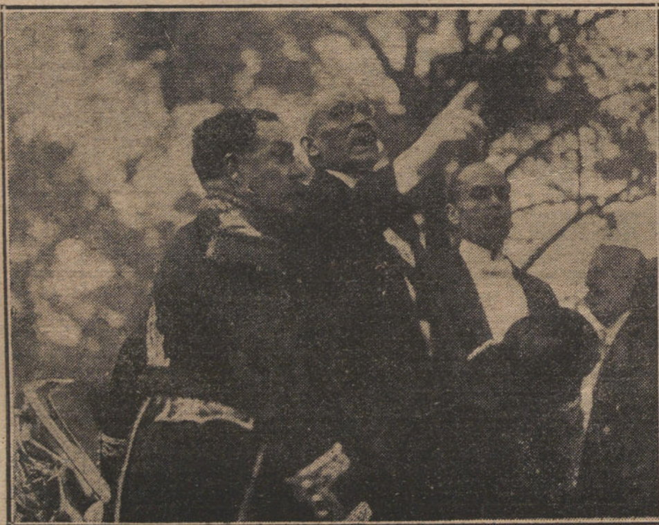
LA REVOLUCION EN MEJICO.—El Presidente de la República, general Huerta, arengando a las tropas que marchan a la campaña del Norte.

Se han subido los consumos en cantidades exorbitantes a la inmensa mayoría de