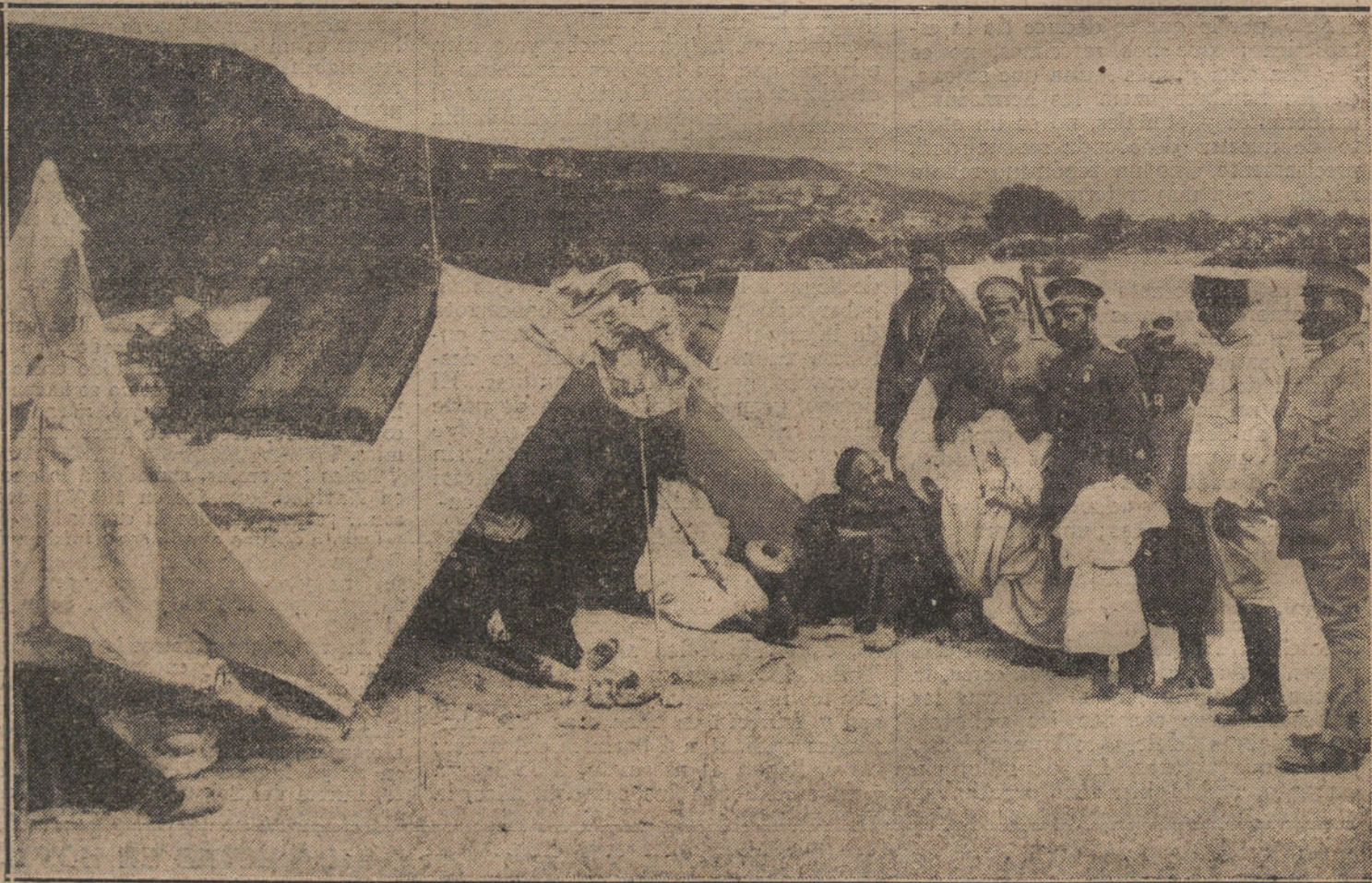
NUESTRA ACCION EN MARRUECOS.—En el nuevo zoco de Monte Amit. Costumbres moras. Curanderos extrayendo sangre del cuello, para curar el dolor de cabeza.

—¿Cuándo se come? ¿Antes, ó después de la función?... ¿Entre el primero y segundo acto, ó a hurtadillas, durante la escena de la consagración de Graal?... Las grandes obras artísticas han tenido siempre el privilegio de plantearnos graves problemas de conciencia: después de ver el cuarto acto del «Hamlet», discutimos en los pasillos si el Príncipe de Di-