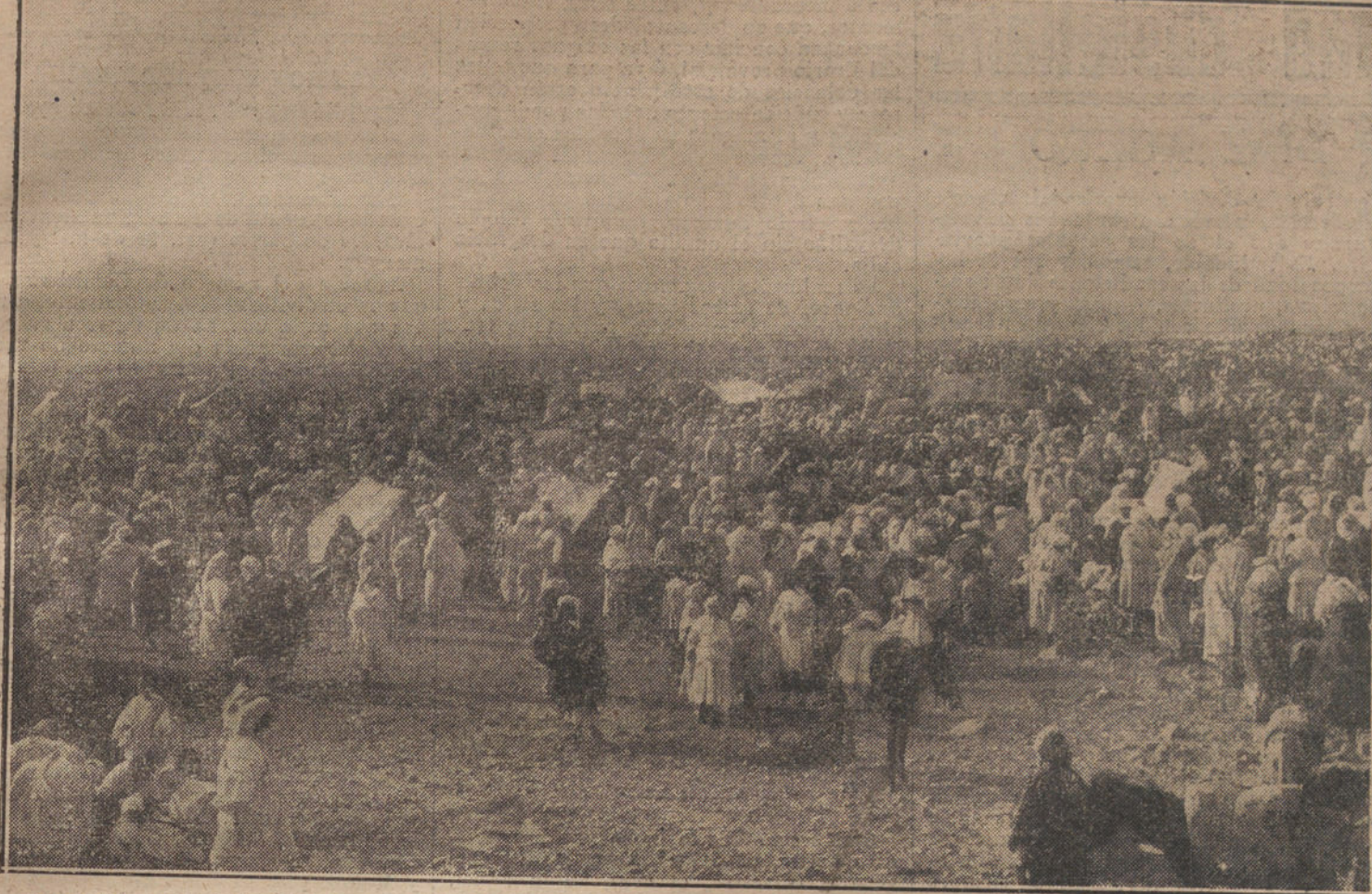
NUESTRA ACCION EN MARRUECOS. Vista general del nuevo zoco de Monte Amut, creado por el general Jordana para atraer el comercio del interior del Rif. A dicho zoco están acudiendo muchos moros rebeldes, que se hacen adictos a España.

PARA TODO LO REFERENTE A PUBLICIDAD FRANCESA EN «LA TRIBUNA» DIRIGIRSE A NUESTRA AGENCIA EN PARIS: RUE VIVIENNE, 22.