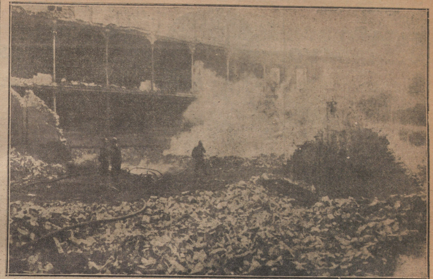
EL INCENDIO DEL TEATRO CIRCO DE SAN SEBASTIAN.—Los bomberos durante la extinción del fuego.

Desde muy joven, la mujer empieza á defenderse de la tentación; por todas partes, el deseo del hombre la cerca, la acecha, la oprime; se multiplican las emboscadas, se suceden los peligros, las palabras dulces, adormecedoras, peores que abrazos. La doncella, sin embargo, resiste bien: su orgullo, su