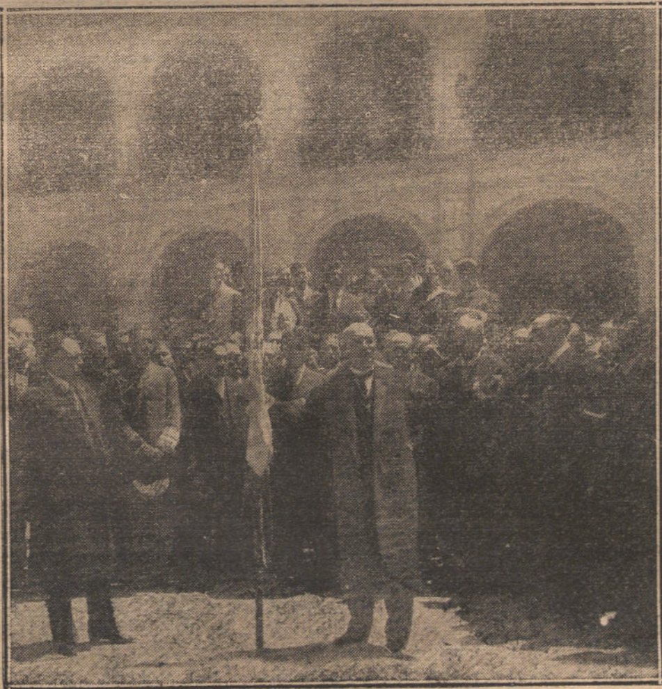
LA REVOLUCION EN MEJICO.—El general Huerta entregando la bandera a los alumnos de la Escuela Preparatoria, que marchan al teatro de operaciones.