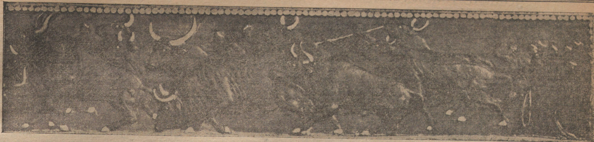
Fragmento del friso que rodea el monumento.

seda en la esclavina. La cara de Julio Antonio es roja, dorada y azul, á franjas. Los labios, reventones; los dientes, como una amenaza; saliente y formidable la nariz; las cejas, un tizón negro; el pelo, se escapa y brilla al borde de la gorra; los ojos pueden mirar, sin que parpadeen, á los de Tórtola Valencia, aquellas pupilas de fulgor mineral. Se extiende por la fortísima arquitectura del rostro un velo invisible de tristeza moruna. Para hablar, Julio Antonio abandona su zarpa granítica en vuestro hombro, y parla con una voz mate y viril, y su acento es andaluz. Porque el catalán se recreó en Córdoba. Acaso esa circunstancia explique por un lado el temperamento de Julio Antonio. Cíclopeo es Julio Antonio, como las murallas de su tierra. Y es de una profunda y simple melancolía refinada, como el sueño del Guadalquivir, en la llanura cordobesa, al crepúsculo. Que Julio Antonio haga tantas obras denitivas á los veinte años, ya no se puede explicar. ¿Sabe algún erudito si Fídias navegó por el Mediterráneo, y pernoctó en la antigua Tarragona y fecundó á la mujer más completa de la raza? Como en 1500 se desenterraban con el arado las esculturas clásicas, con el mismo arado, que aún se emplea en nuestras campiñas, se ha desenterrado hoy el más grande de aquellos escultores.