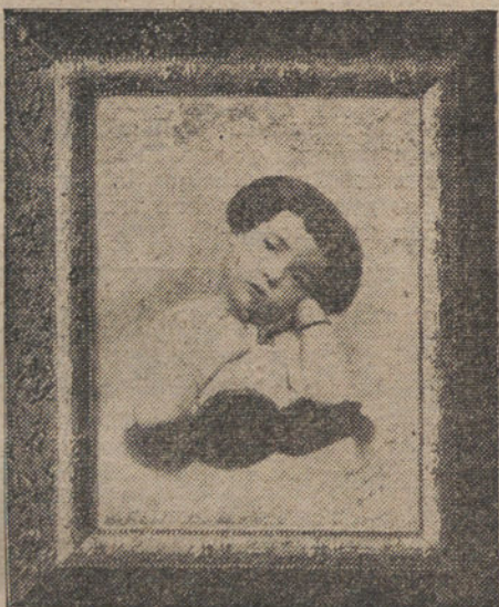
Modelo de las magníficas ampliaciones de gran tamaño que LA TRIBUNA regala a sus suscriptores.

CUANTOS SE SUSCRIBAN POR UN AÑO A «LA TRIBUNA» TENDRAN DERECHO A UNA MAGNIFICA AMPLIACION FOTOGRAFICA, RETOCADA, A GRAN TAMAÑO, CON PRECIOSO MARCO Y CRISTAL