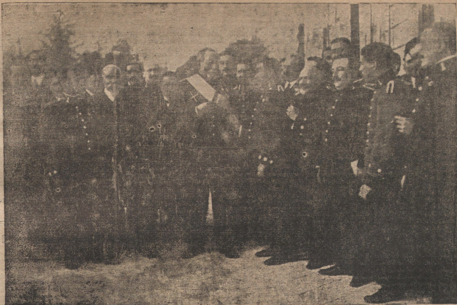
El coronel Rodríguez Mourelo imponiendo al general Marvá la banda de la gran cruz de Alfonso XII, en el homenaje que el Cuerpo de Ingenieros ha tributado al prestigioso y sabio general.