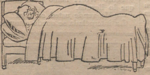
El de Fomento: «Estar tumbado.»