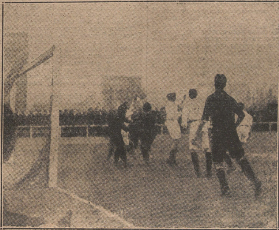
EL PARTIDO DE «FOOT-BALL» DE AYER.—El portero del equipo «Barcelona» parando un «shoot» del equipo «Madrid F. C.» (Fot. BERRIATUA.)

PARA QUE LA OPINION SE ENTERE DE COMO SE HACEN ELECCIONES A LA INGLESA, «LA TRIBUNA» DARÁ CABIDA EN SUS COLUMNAS A CUANTAS RECLAMACIONES JUSTAS SE NOS DIRIJAN POR LOS CANDIDATOS QUE SEAN ATROPELLADOS POR EL ACTUAL GOBIERNO.