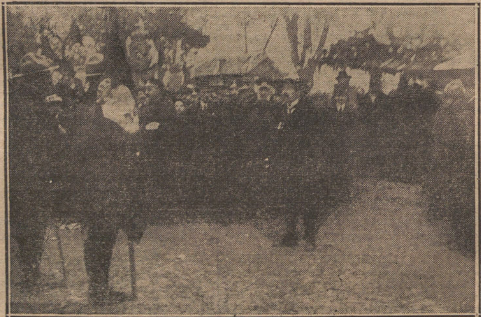
LOS EXPLORADORES ALCARREÑOS.—El capitán Iradier, en Guadalajara, dirigiendo la palabra á los exploradores en el acto de la promesa colectiva, verificado ayer.