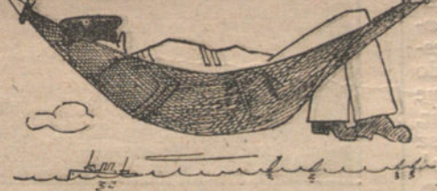
El de Marina: «Estar tumbado.»