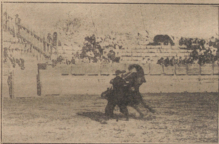
LA FIESTA DEL MILANILLO.—Julián Cañedo en una de sus soberbias faenas de muleta.

El joven escritor Alfredo Gorostiza dió lectura á los dos últimos actos de una comedia, que fué ovacionada por el público.