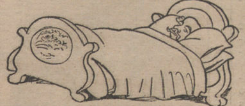
El presidente: «Estar tumbado.»