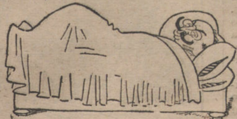
El de Estado: «Estar tumbado.»