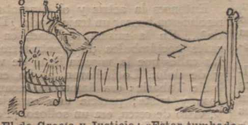
El de Gracia y Justicia: «Estar tumbado.»