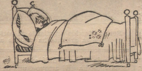
El de Gobernación: «Estar tumbado.»