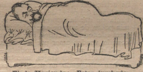
El de Hacienda: «Estar tumbado.»