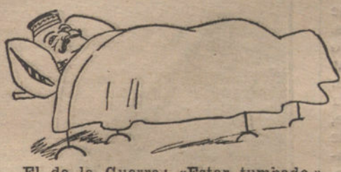
El de la Guerra: «Estar tumbado.»