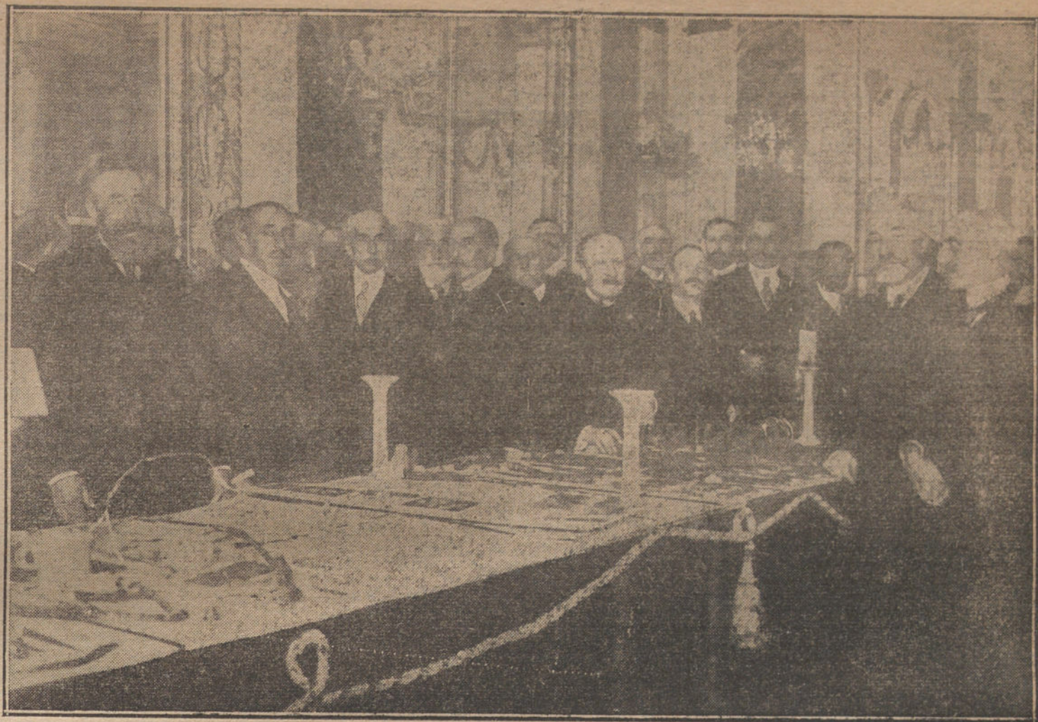
EN EL PALACIO DEL MARQUES DE CERRALBO.—El ilustre prócer mostrando á los invitados las joyas arqueológicas encontradas en las últimas excavaciones.

NUMERO DEL TELEFONO DE LA REDACCION Y TA- LLERES: 4.444.