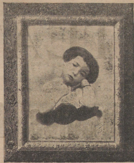
Modelo de las magníficas ampliaciones de gran tamaño que LA TRIBUNA regala a sus suscriptores.

Terminadas ya las obras, todos los servicios de Administración, Redacción y Publicidad han quedado instalados en el edificio de nuestra propiedad. JARDINES, 4, 6 y 8