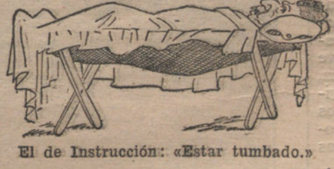
El de Instrucción: «Estar tumbado.»