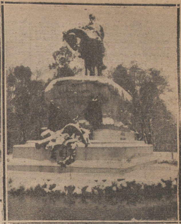
LA NEVADA DE MADRID.—Detalles del efecto de la nevada en los paisajes del Retiro.

—«Pus» es mi hija; bonita como una onza de oro. ¿Conocen «ostés» á Vicenta?