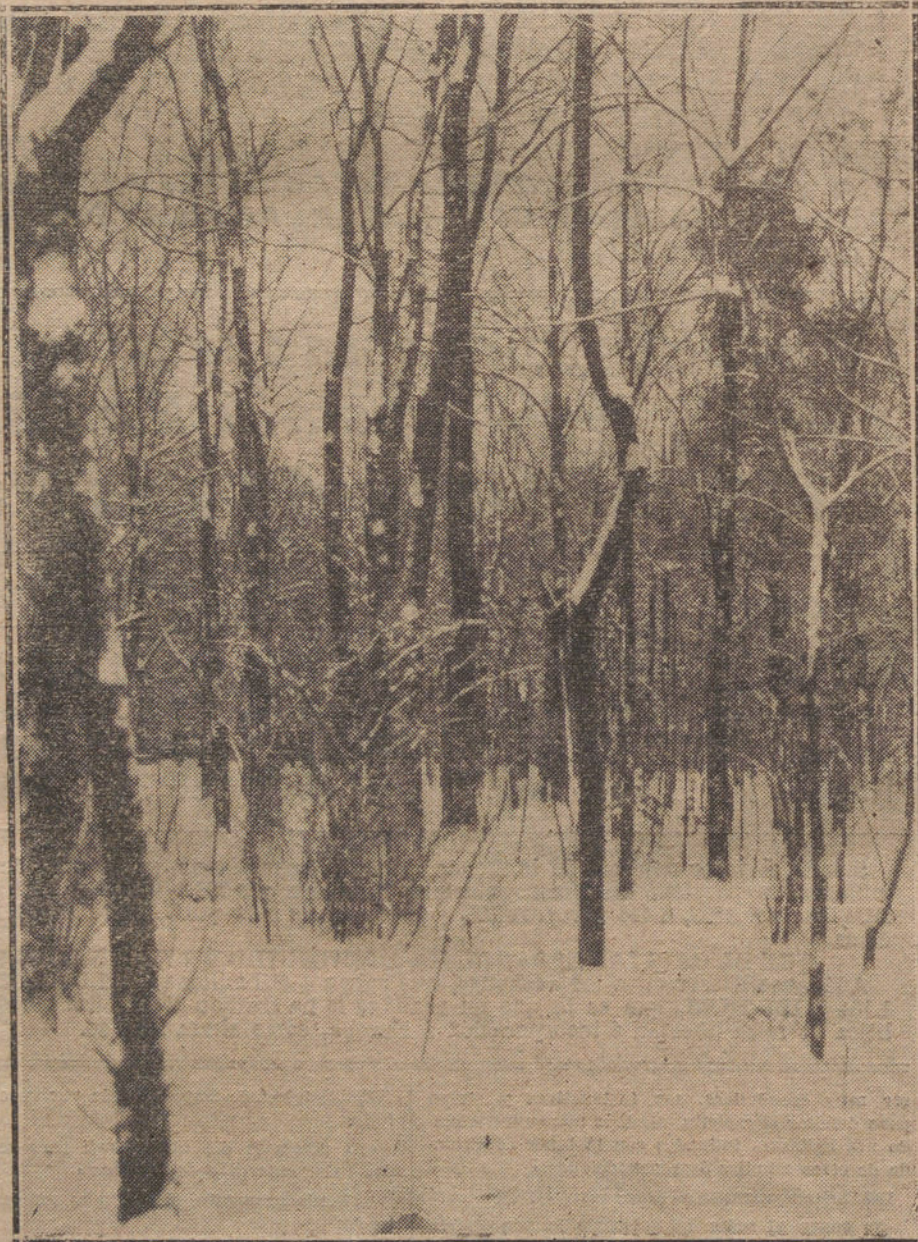
LA NEVADA DE MADRID.—Un bosque del Retiro.

Las noticias de los departamentos son que reina un gran temporal; en Nantes se ha helado el Canal; en Burdeos anoche hizo 11 grados bajo cero. El día 28 del corriente vendrán á París el Rey de Grecia y familia.