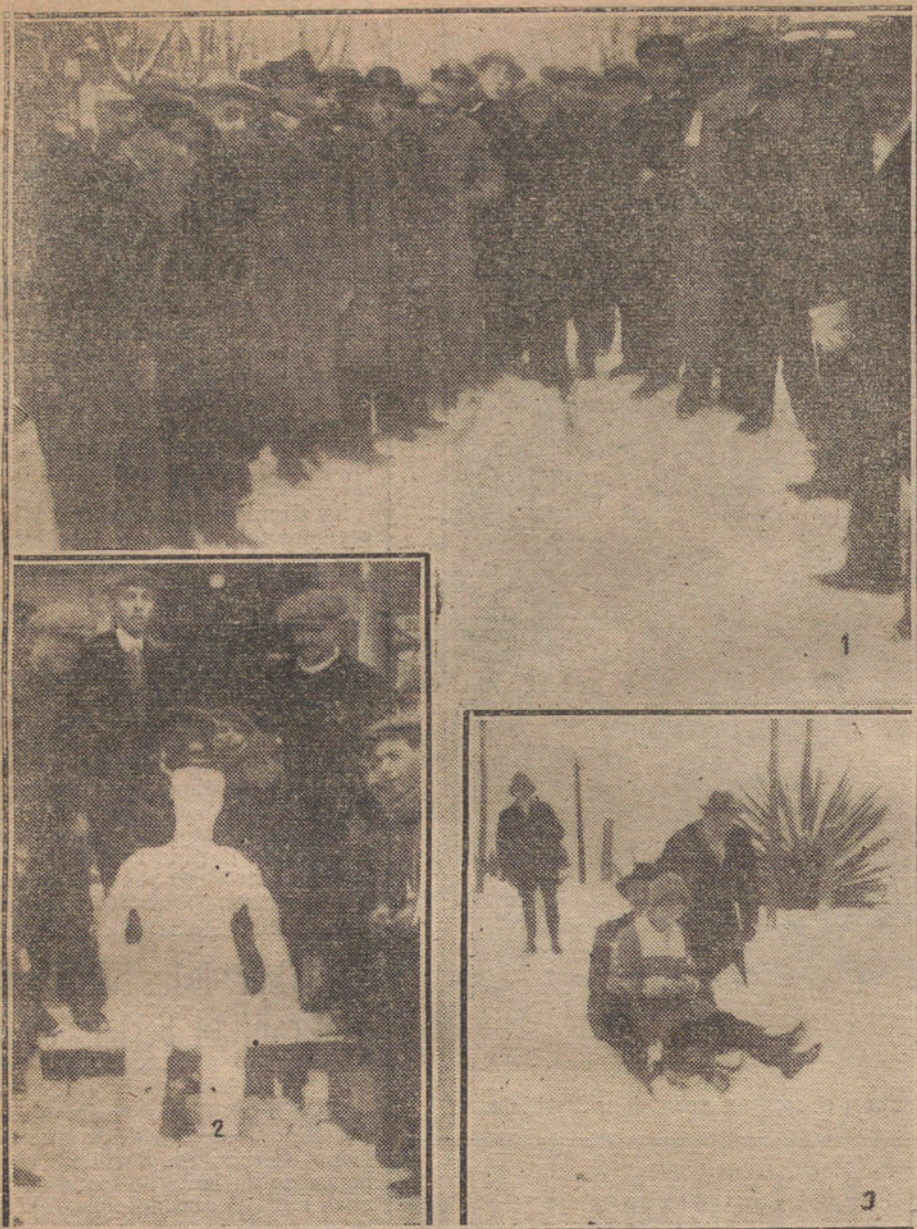
LA NIEVE EN BARCELONA.—Número 1. Grupo de estudiantes en las Ramblas, patinando con «skis».—Número 2. Una figura hecha con nieve.—Número 3. En una de las pendientes del Tibidabo. Carreras de trineos.