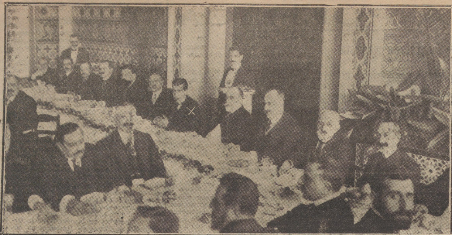
BERGAMIN EN BARCELONA.—Banquete de despedida, celebrado en el Tibidabo, en honor del ministro de Instrucción pública.

A pesar del frío, asistió numeroso público. El Municipio de París recibirá mañana á la Comisión de estudiantes españoles que dirige el doctor Forns.—Hallet.