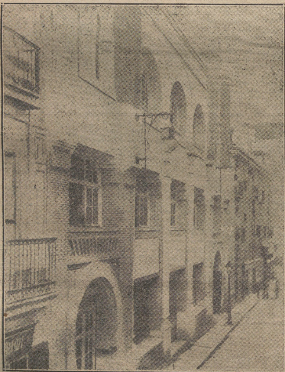
La nueva casa propiedad de LA TRIBUNA. Jardines, 4, 6 y 8.

ADMINISTRACION, REDACCION Y PUBLICIDAD han quedado instalados en el edificio de nuestra propiedad.--Jardines, 4, 6 y 8