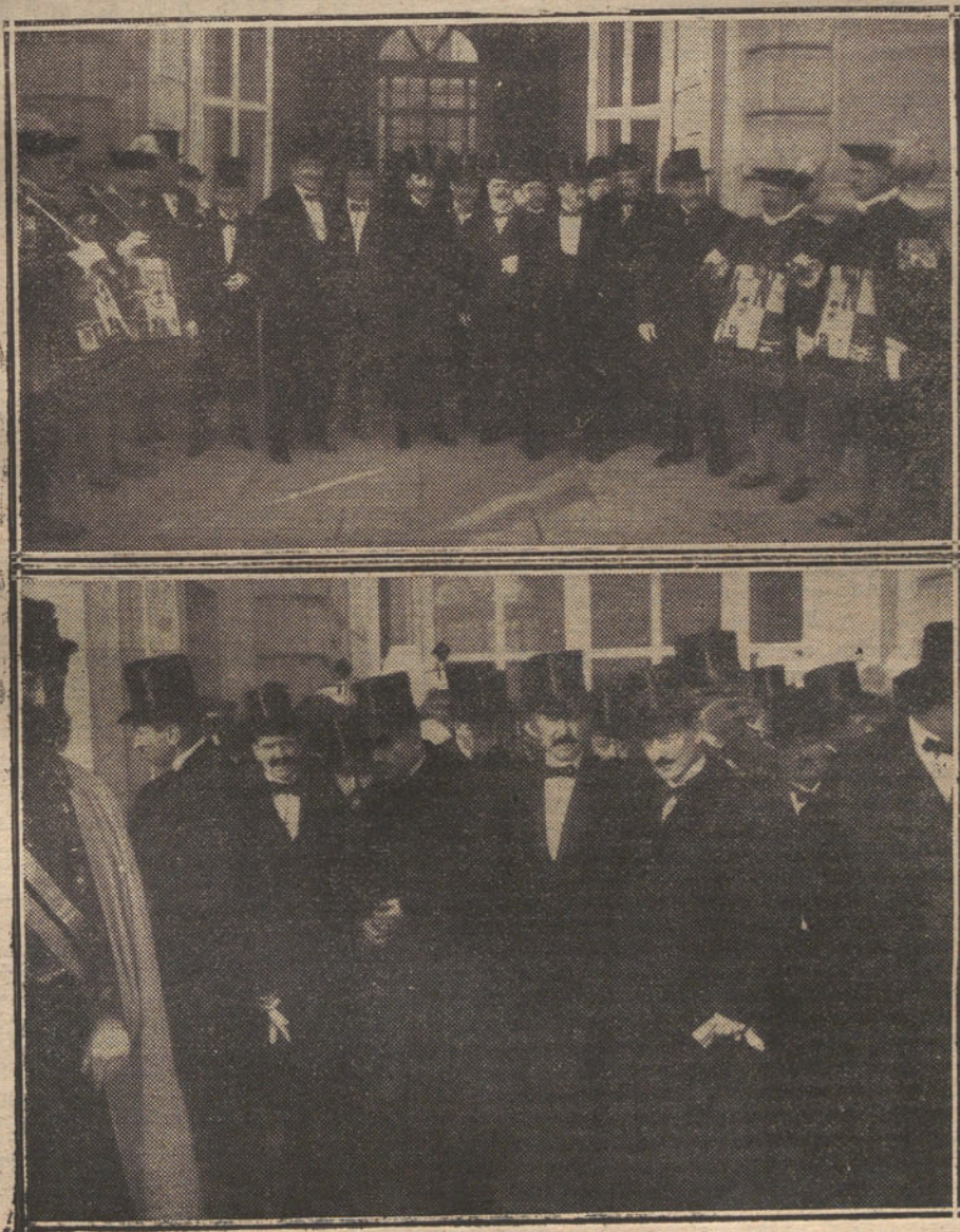
LA RECEPCION DE AYER EN PALACIO.—La Comisiones de la Diputación Provincial y el Ayuntamiento saliendo del regio Alcázar.

El Ayuntamiento de Rota socorrió con pan á los obreros del campo, que están parados por las temporales y lluvias.