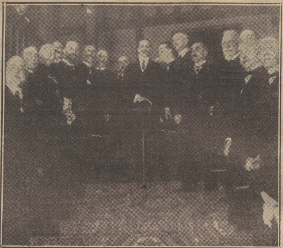
S. M. el Rey en el Monte de Piedad, donde ha presidido la inauguración de la segunda Conferencia nacional de Cajas de Ahorro.

cialmente «La Epoca», han tratado de desvirtuar los hechos y de interpretarlos a la medida de sus conveniencias.