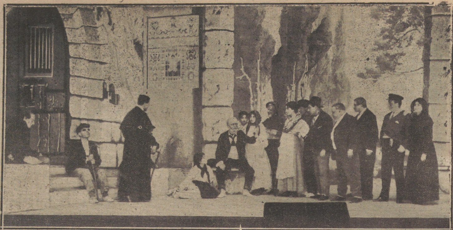
EL ESTRENO DE ANOCHE.—Otra de las escenas más interesantes de «La Virgen del Mar», de Rusiñol, estrenada con feliz éxito en el teatro de la Princesa.

¿Dónde hay vida privada que sea respetada, en cuanto llega á ser quien la disfruta alguien por quien el público disputa? No la hay. Y, además, no debe haberla, pues deber es de todos conocerla cuando se trata de hombres que en su mano tienen trozos del cetro soberano. Quiero y debo saber si confianza merece en quien yo cifro mi esperanza; me hace falta medir su inteligencia, necesito saber sus intenciones, me interesan sus vicios y pasiones, y me importa su estado de conciencia.