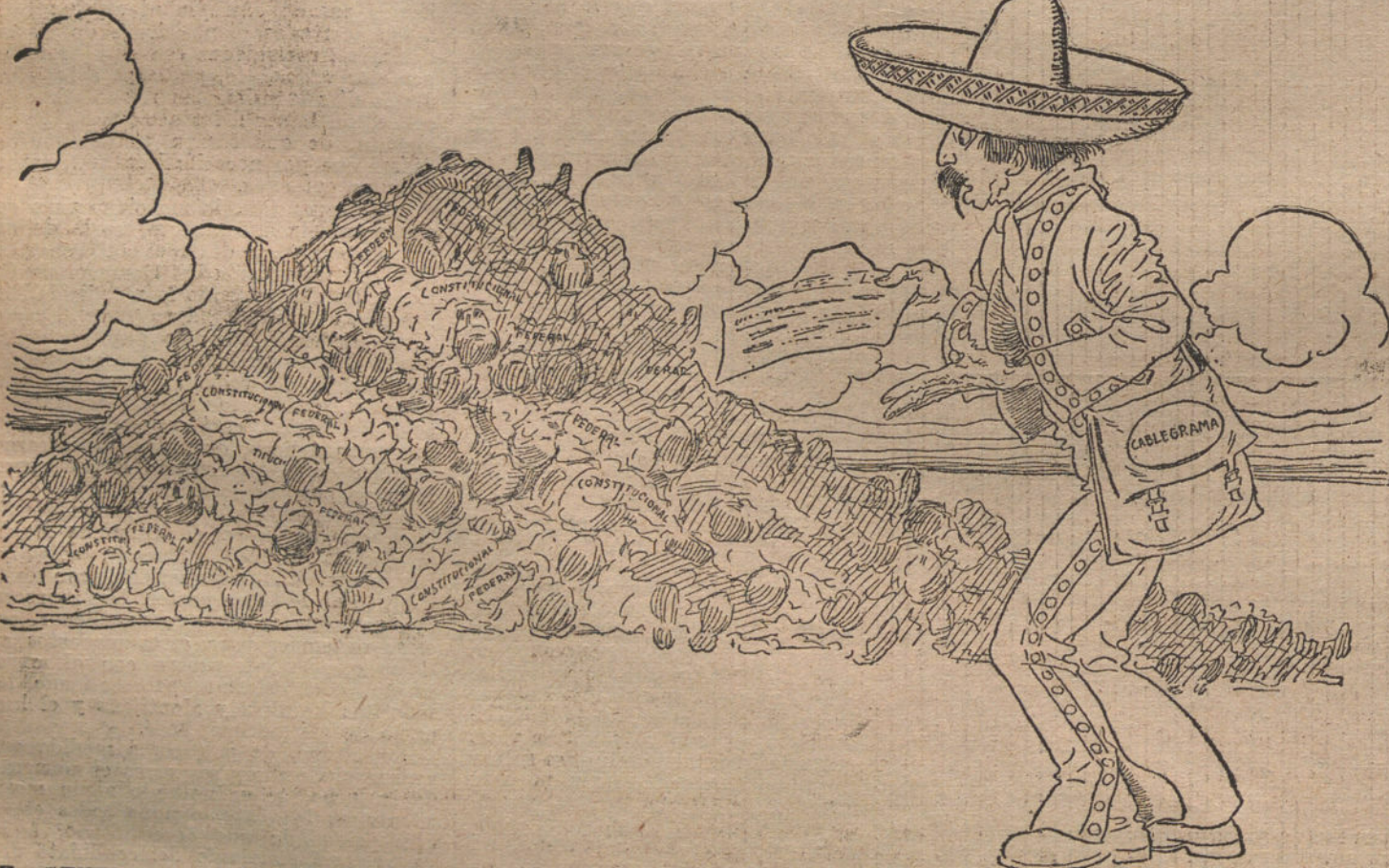
EL GENERAL VILLA.—¿Que haga la paz? ¿Y con quién, si ya me he quedado solo en Méjico? (Caricatura de AGUS-FIN)

¡Pero no ha notado que al marcharse dejó su alma en el velador de un restau-