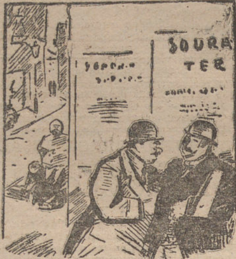
LOGICA. —¿Cómo así? ¡Ha regresado tu mujer!