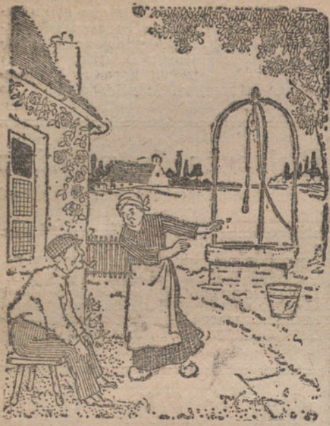
ANTE TODO, LA HIGIENE. —¡Señor, señor! Su hijo se ha caído al aljibe. —No se alarme, mujer. Según dictamen del Laboratorio, estas guas son muy saludables. (La Razón, Montevideo.)