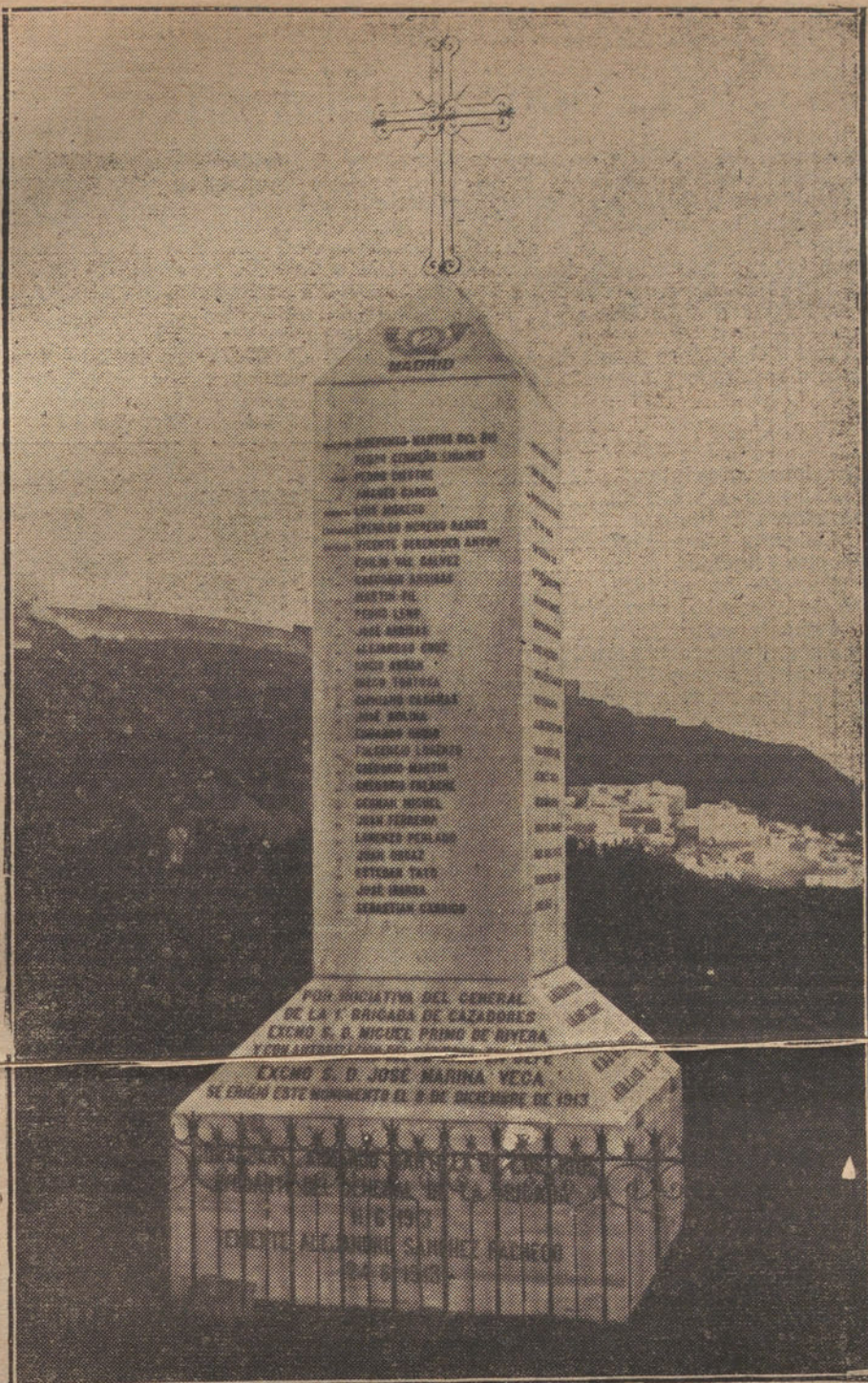
Obelisco erigido recientemente en el cementerio católico de Tetuán, en conmemoración de los jefes y oficiales muertos en la campaña de Marruecos.