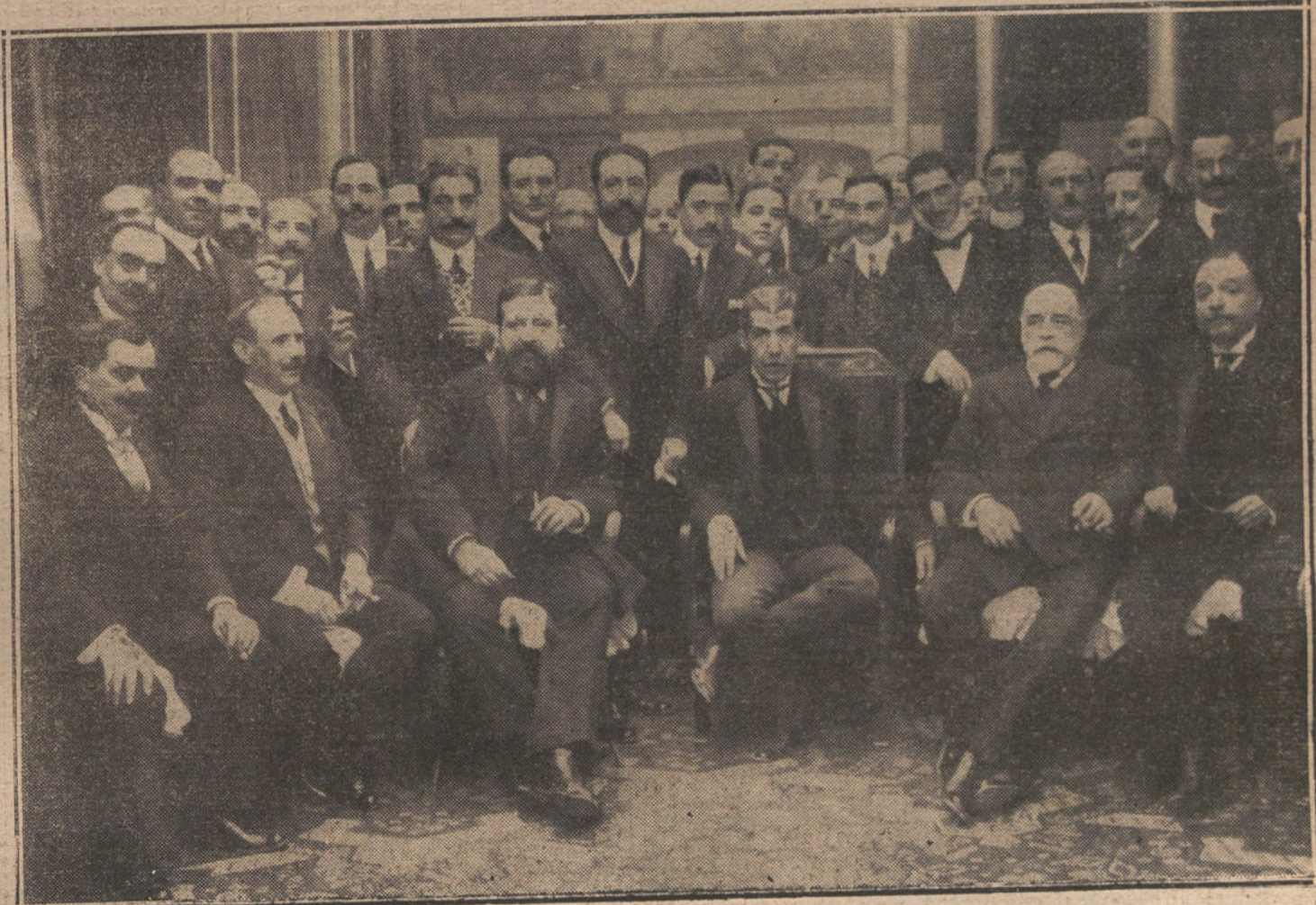
DETALLES DEL VIAJE DE BERGAMIN.—Grupo de asistentes al banquete con que la Escuela Superior de Comercio de Barcelona, obsequió al ministro de Instrucción pública.

Pues, señor; que un día, seguramente porque el humo de los cigarros y la polvareda propia de las aglomeraciones en locales poco aseados, habían viciado la atmósfera algo más que de ordinario, es lo cierto que mi buen tenor dejó escapar un «gallo». El público, poco perito en su mayoría, hizo un movimiento de extrañeza; pero en seguida, uno de aquellos entusiastas de la «gorra», gritó: «¡Bravo, buena fermata!»