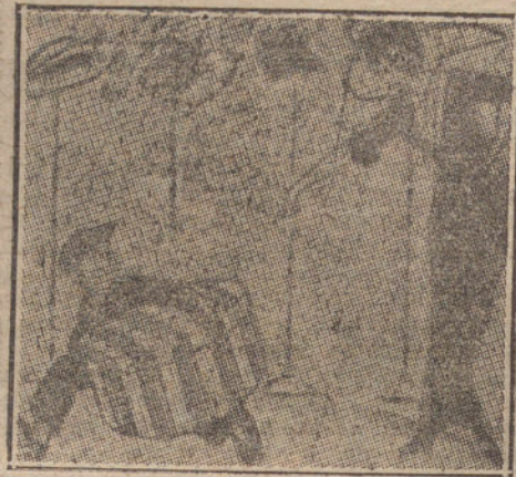
PRECAUCIONES. La modista. —Llévase ese sombrero; pero corriendo, no vaya a cambiar la moda. (Life, Nueva York.)