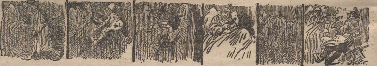
6. Resuelto a pasar la noche tranquilo, me volví a la cama. 7. Nunca lo hubiera hecho. Un pequeño turco montó sobre mis rodillas. (De La Illustration.) 8. Al turco siguió el fantasma de la gripe, que me ofrecía una tirana. 9. Bueno, me dije, al que me moleste ahora le desterrajo con un tiro. 10. Y empujando un magnífico revólver, me agazapé en el lecho. 11. De pronto me llamó otra voz cavernosa. Disparé las seis balas y... mi criado, que me entraba el desayuno, cayó muerto a mis pies.