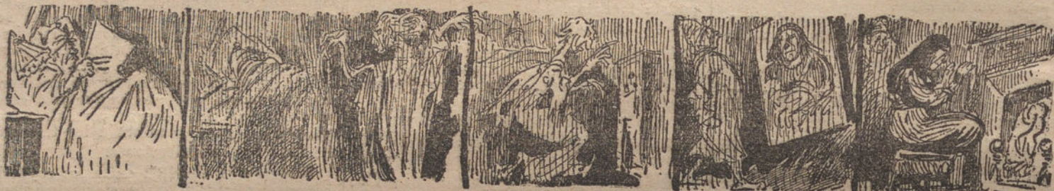
LOS FANTASMAS DE LA ACTUALIDAD 1. Siguiendo la costumbre, al meterme en la cama lei toda la Prensa 2. Después me dormí; pero apenas había cerrado los ojos, comenzaron á saltar alrededor de mi cama los fantasmas. 3. Uno de ellos se fué á la caja de caudales: era el impuestito sobre la fortuna. 4. Cuando intenté detenerle, me topé con el cuadro de «La Gioconda». 5. Y poco después me sorprendió otro fantasma calentándose: ¡era el Frio!