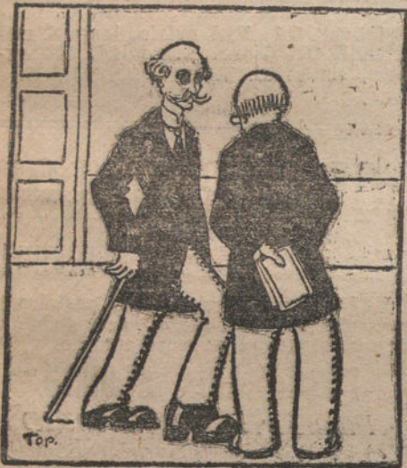
EN LA PRESIDENCIA. —Hombre, D. Eduardo, anda usted muy mal. —Es que me he puesto unas botas que encontré en la Presidencia. (Dibujo de Top.)