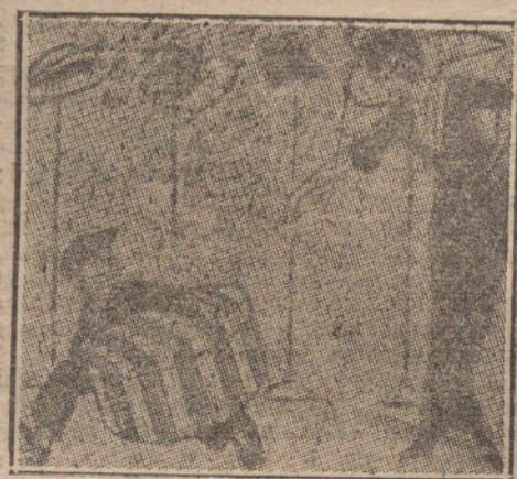
PRECAUCIONES La modista.—Lleva ese sombrero; pero corriendo, no vaya á cambiar la moda. (Life, Nueva York.)