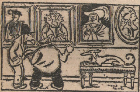
EN EL MUSEO —La verdad es que nuestros antepasados eran unos guasones. ¡Mira tú que tratarse todos en trajes de Carnaval! (Journal, París.)

ración de muchos concurrentes á las famosas corridas valencianas.