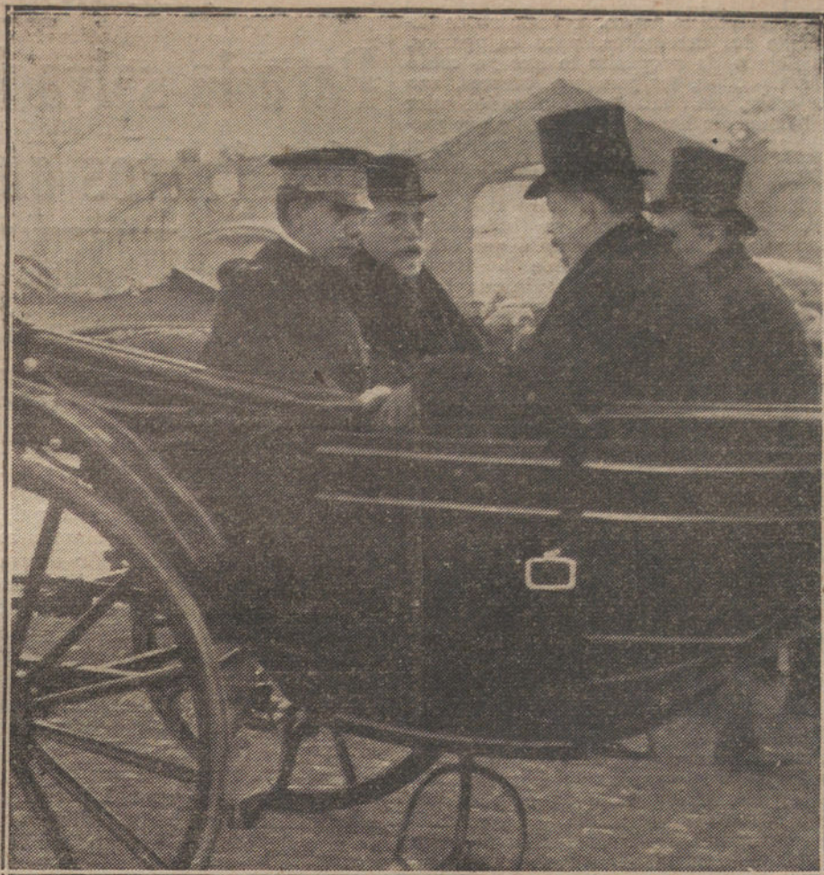
Entrega del ministro de Instrucción pública en Tarrazo, acompañado de las autoridades locales.

¡Habrá que aclarar que en todo lo antepuesto no puede haber la menor alusión á la casi totalidad del pueblo francés y de su elemento oficial! Agradecidos y rendidos debemos estarles por el regalo, que es una prueba cordial de inteligencia; pero bueno será lamentar, como seguramente lamentan ellos mismos, que haya una minoría de quisquillosos á quienes un regalo les parezca igual que un cambalache. Si á cambiar