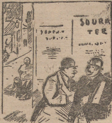
LOGICA —¿Cómo así? ¿Ha regresado tu mujer?