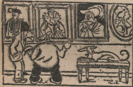
EN EL MUSEO. —La verdad es que nuestros antepasados eran unos guasones. ¡Mira tú que retratarse todos en trajes de Carnaval! (Journal, Paris.)