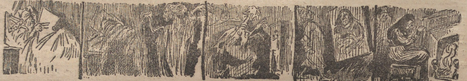
LOS FANTASMAS DE LA ACTUALIDAD. 1. Siguiendo la costumbre, al meterme en la cama lei toda la Prensa. 2. Después me dormí; pero apenas había cerrado los ojos, comenzaron a saltar alrededor de mi cama los fantasmas. 3. Uno de ellos se fué a la caja de caudales: era el impuesto sobre la fortuna. 4. Cuando intenté detenerle, me topé con el cuadro de «La Gioconda». 5. Y poco después me sorprendió otro fantasma calentándose: ¡era el Frio!