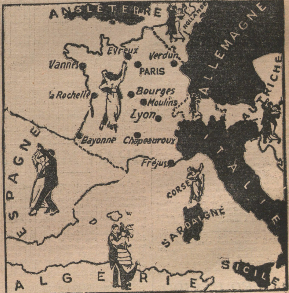
En el adjunto grabado, publicado por un periódico de Paris, las partes blancas son aquellas donde el tango argentino se ha impuesto definitivamente, y las negras, donde todavía no se baila. Por lo que respecta á Francia, los puntos negros son las localidades donde el tango ha sido prohibido.

NUMERO DEL TELEFONO DE LA REDACCION Y TALLERES DE «LA TRIBUNA», 4.444.