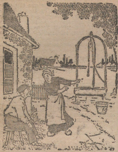
ANTE TODO, LA HIGIENE —¡Señor, señor! Su hijo se ha caído al aljibe. —No se alarme, mujer. Según dictamen del Laboratorio, estas guas son muy saludables. (La Razón, Montevideo.)