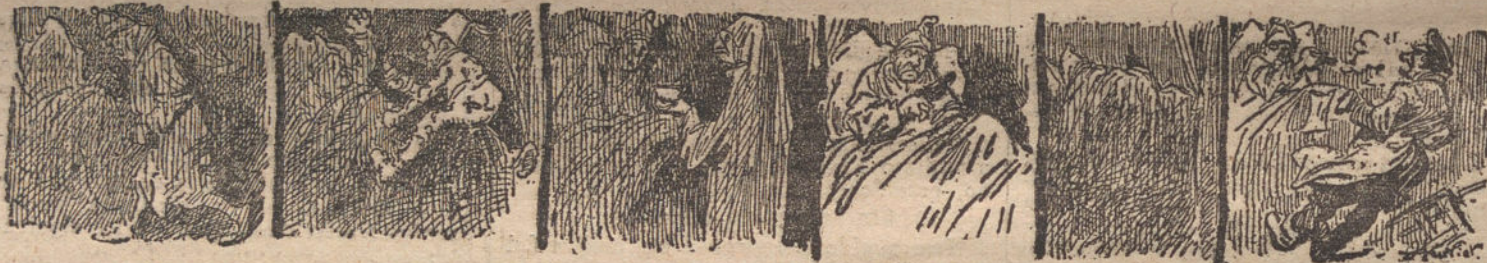
6. Resuelto á pasar la noche tranquilo, me volví á la cama. 7. Nunca lo hubiera hecho. Un pequeño turco montó sobre mis rodillas. 8. Al turco siguió el fantasma de la ahora le deserrajo grippé, que me ofrecía una tirana. 9. Bueno, me dije, al que me moleste al arrojo y valentía. Con el capotillo anda un poco torpón. Pero, en fin, nada importa. 10. Y empuñando un magnífico revólver, me agazapé en el lecho. 11. De pronto me llamó otra voz cavernosa. Disparé las seis balas y... mi criado, que me entraba el desayuno, cayó muerto á mis pies.