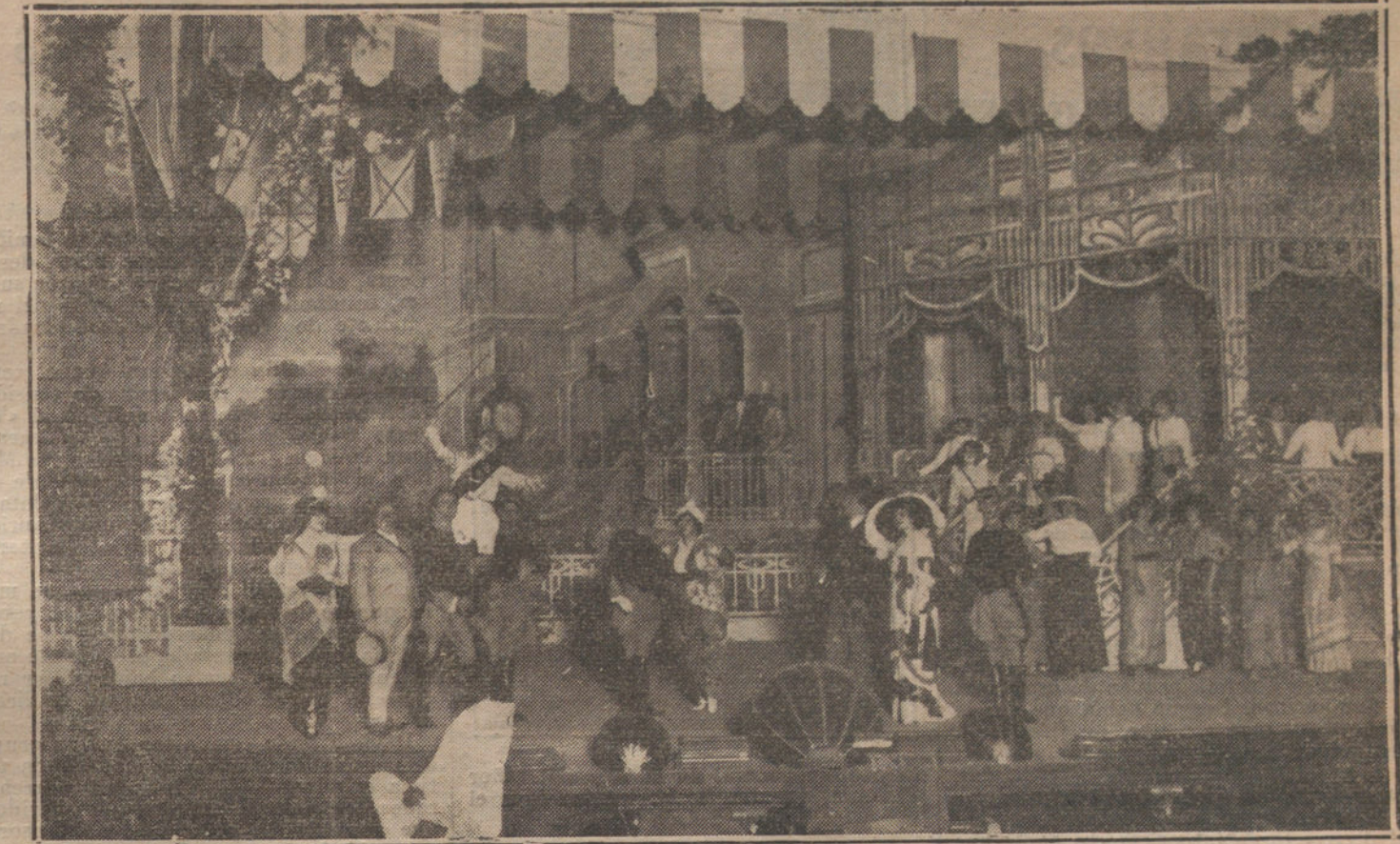
Una escena de la opereta «Galope de amor», de Ferraz Revenga y el maestro Penella, estrenada en el Gran Teatro.

En Madrid existen encrucijadas propicias a la muerte. Ejemplo, la reunión