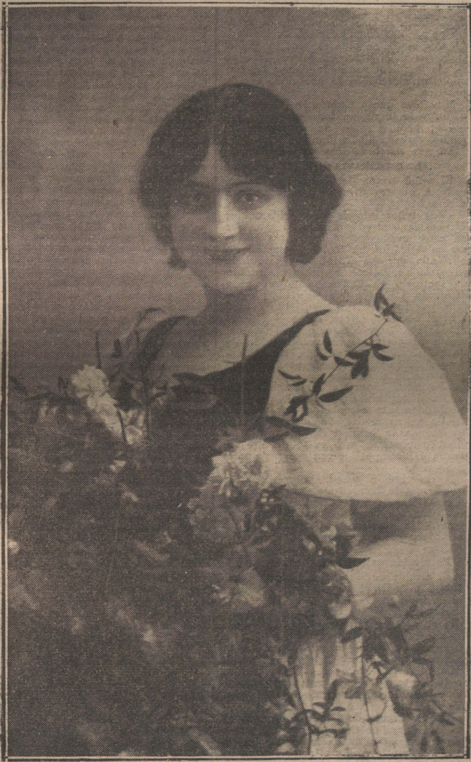
LA NOTABLE TIPLE SEÑORA FITZZI

El aspecto de aquel hombre, señor conde de Peñalver, era aterrador. Avergon-