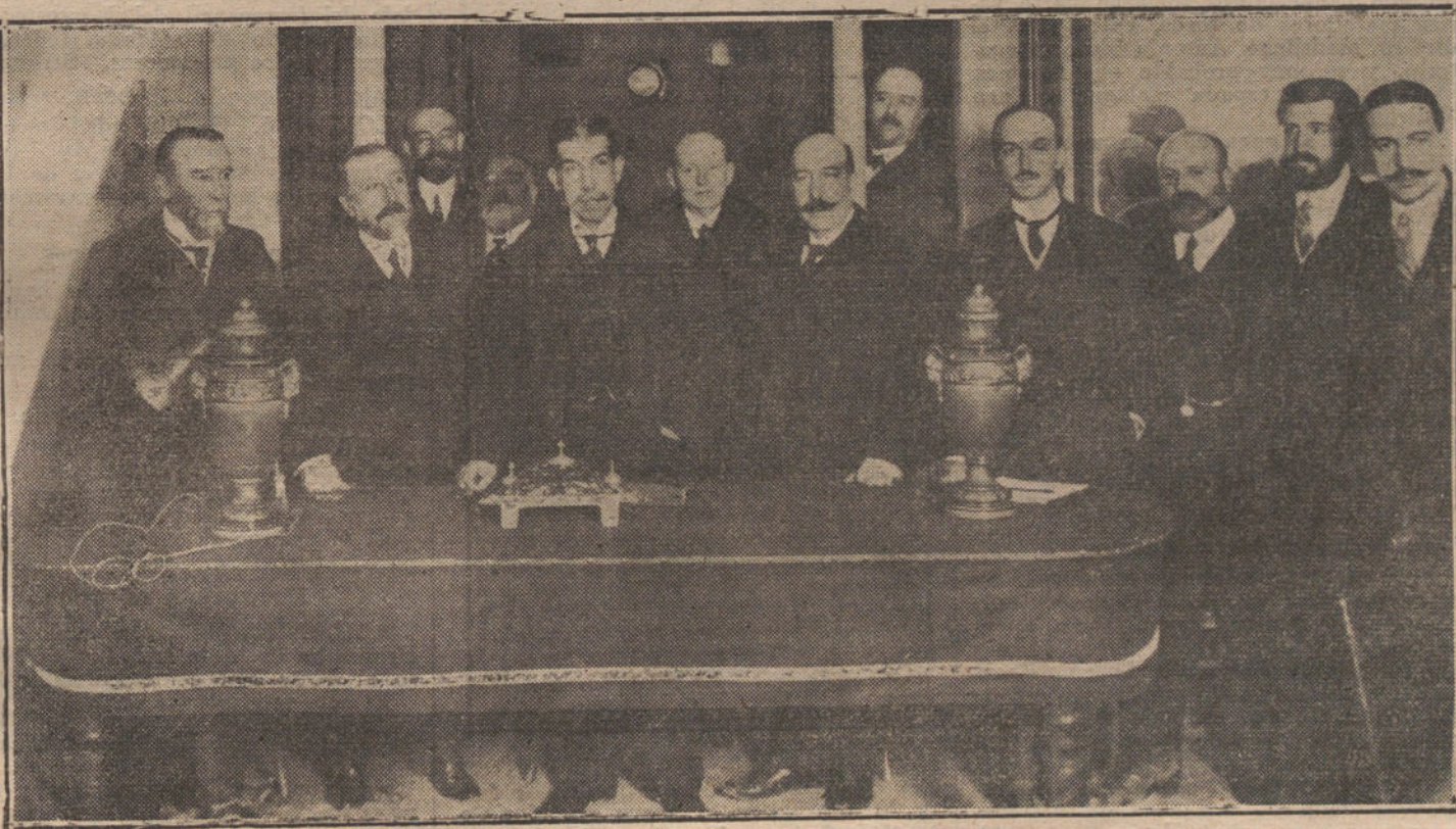
El ministro de Instrucción pública en su visita a la Sociedad Fotográfica, que ayer inauguró una serie de conferencias.

LA TAREA DE DEVOLVER TODOS LOS TRABAJOS QUE NO PUBLICAMOS SERIA ABRUMADORA, Y PARA EVITARLA, COMO PARA PREVENIR RECLAMACIONES, QUE RESULTARIA IMPOSIBLE ATENDER, RECOMENDAMOS QUE NO SE DEVUELVEN LOS ORIGINALES.