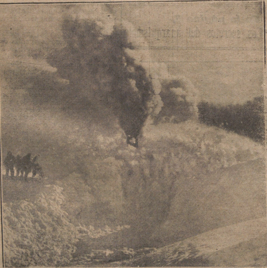
La lucha contra la nieve en los ferrocarriles del Sur de Francia.

Es la única manera de impedir el sacramento de esas ficciones de Parlamento, en las que no están representadas más que las familias de los gobernantes, con perjuicio de España, burlada y arruinada por estos desaprensivos políticos «á la inglesa».