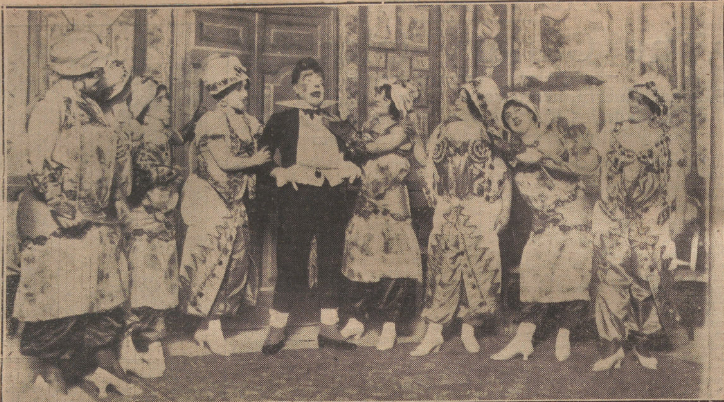
Una escena de la opereta «Las golondrinas», que se estrena esta noche en el teatro Price.

Y como resulta que los alcaldes y secretarios municipales son llamados á la capital por el gobernador para las cuestiones electorales, la Diputación provincial elevará al presidente del Consejo una enérgica protesta contra lo que considera aquel Centro provincial un lamentable retroceso en nuestras costumbres públicas.