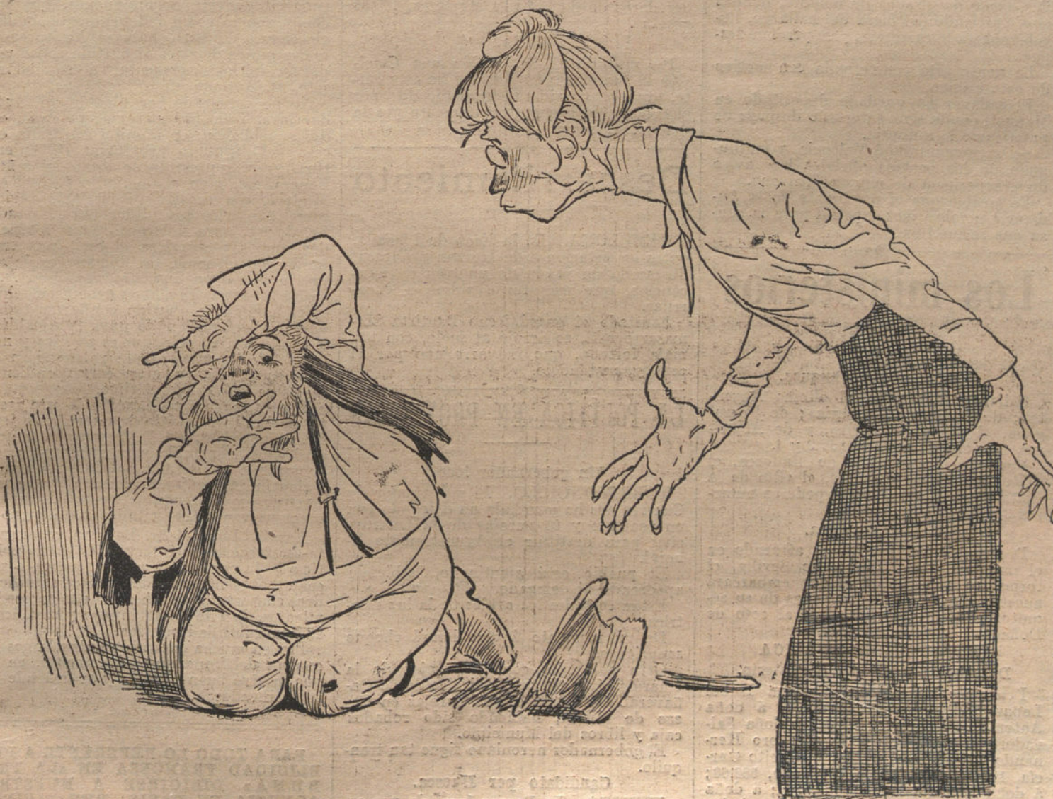
JOHN BULL Y LAS SUFRAGISTAS

LA SUFRAGISTA.—¿Tú no quieres reconocer nuestro derecho? ¡Pues te prometo que te reduciré á polvo!