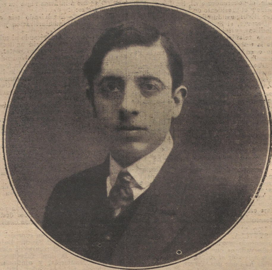
FRANCISCO VILLAESPESA, autor de «Doña María de Padilla».