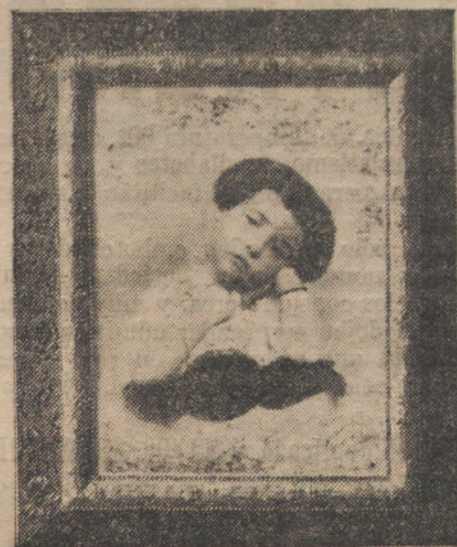
Modelo de las magníficas ampliaciones de gran tamaño que LA TRIBUNA regala a sus suscriptores.