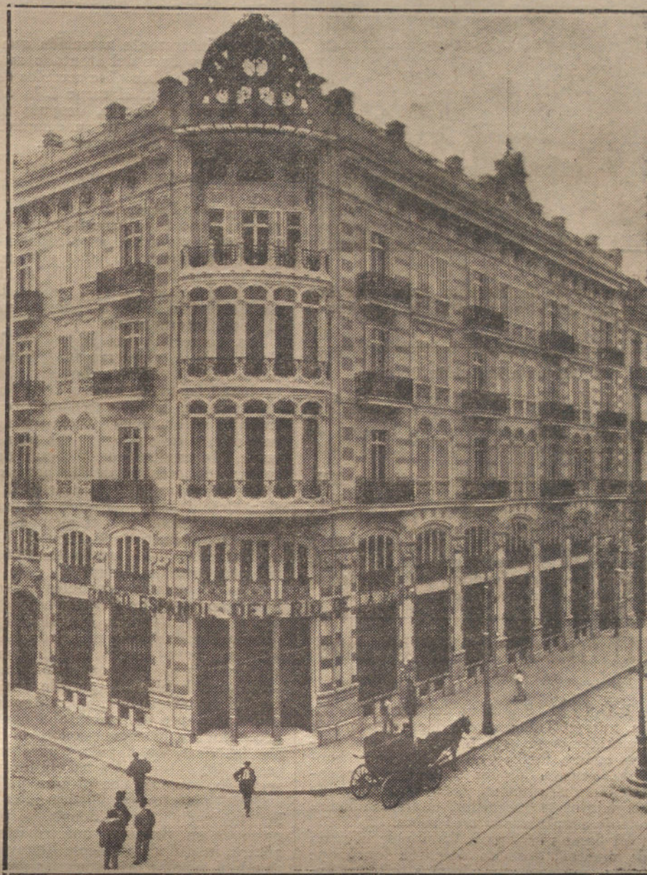
Magnífico palacio propiedad del hotel Reina Victoria, elegantemente instalado en el punto más céntrico de Valencia, calle de las Barcas.

Una de las casas comerciales de verdadera gran importancia en toda España es la casa OTTO MEDEM, que lleva veinticinco años de establecida, dedicándose con especialidad á la venta de abonos minerales.