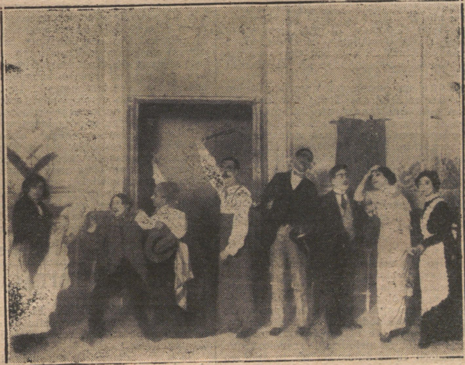
Escena final del sainete de Torres del Alamo y Asenjo «La romántica», estrenado con ruidoso éxito en el teatro Martín.

Asimismo se ha dispuesto lo siguiente: La construcción á que se refiere la primera de las instrucciones anteriores se hará por concurso, al que podrán presentarse los contratistas ofreciendo terrenos y edificios construídos, mediante aprobación de anteproyectos que con el conforme del contratista serán formulados por arquitecto ó ingeniero militar. El mismo sistema se empleará para la construcción del cuartel para la sección de Sanidad. Los edificios comprendidos en la cláusula tercera se construirán con arreglo á lo dispuesto en el vigente reglamento de obra.