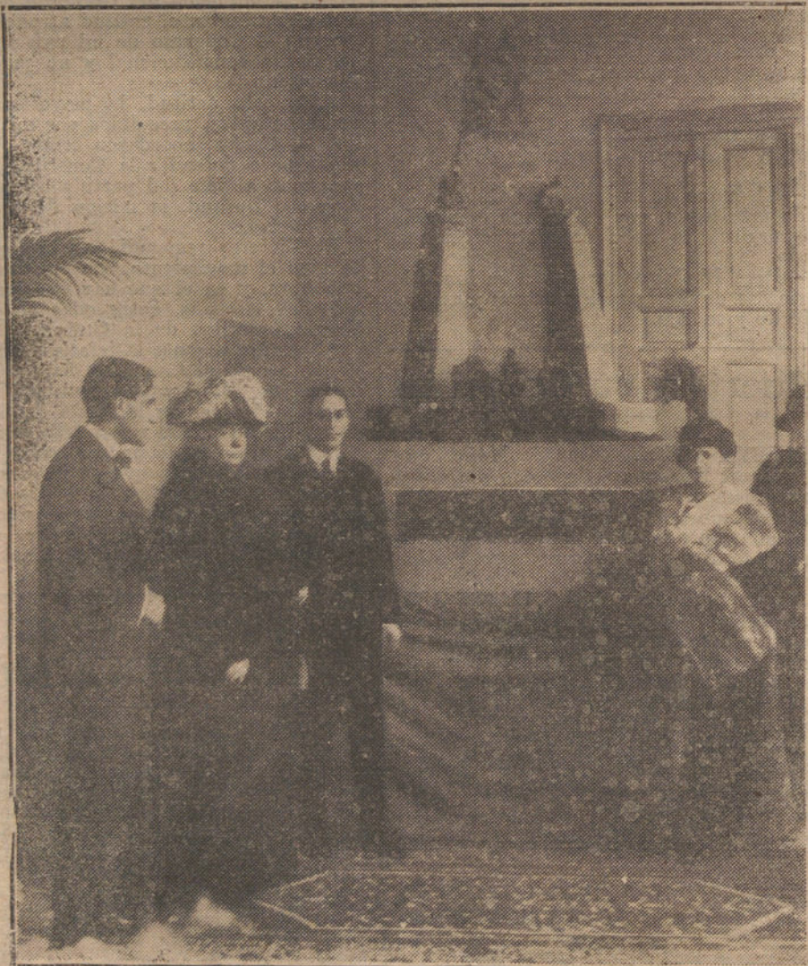
S. A. la Infanta Isabel y la marquesa de Argüelles en el estudio de Julio Antonio y Miranda, examinando el monumento a las Américas.

NUMERO DEL TELEFONO DE «LA TRIBUNA»: 4.444.