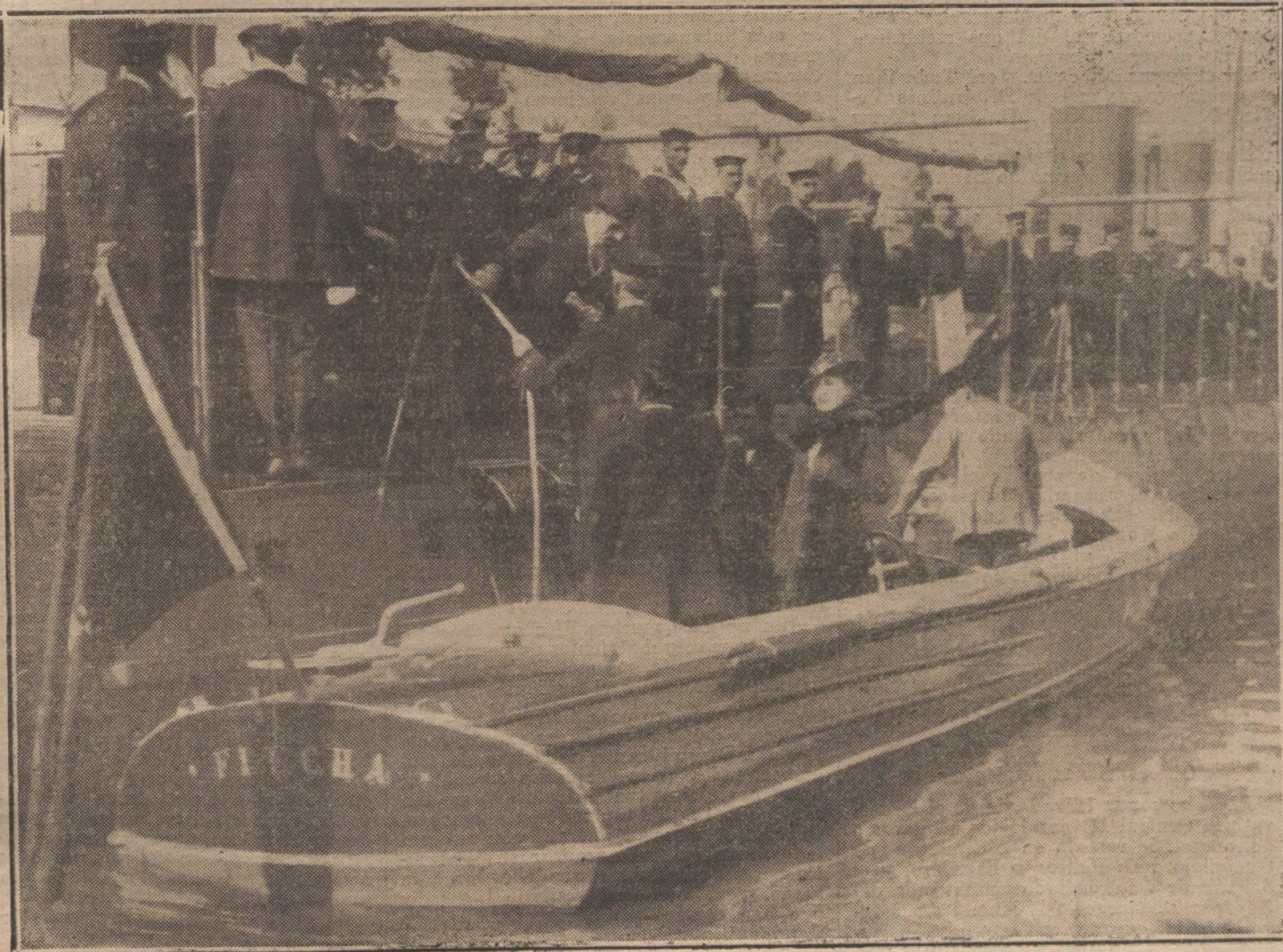
LOS REYES EN SEVILLA.—SS. MM. descendiendo del torpedero «Número 2», después de la visita.

Y, además, que, cogidos los infelices entre el líquido de fuera y el de dentro, la catástrofe sería aterradora.