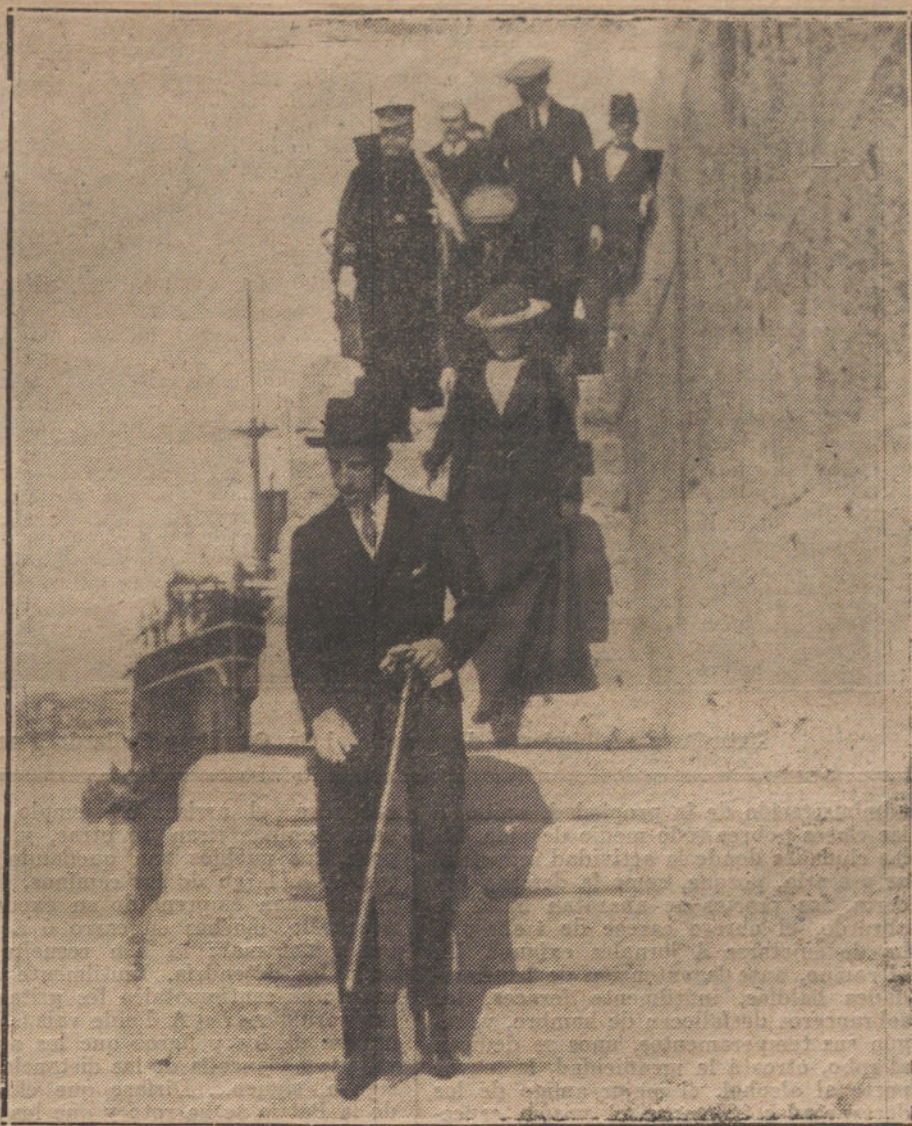
SS. MM. en el embarcadero del puerto de Sevilla, dirigiéndose á visitar el torpedero «Número 2».

Se habla de la guerra con Grecia como cosa desentada, y todo es de temer del ministro de la Guerra, Enver Pachá, que se dice que, si bien carece de ilustración y de capacidad, tiene una gran osadía, coronada recientemente por la recuperación de Adrianópolis y ver-