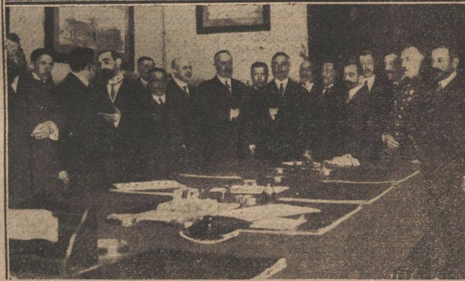
EL REY EN SEVILLA.—S. M. en la Real Maestranza de Sevilla, durante la visita que hizo ayer. Los comisionados catalanes y el Comité ejecutivo de la Exposición de Industrias Eléctricas de Barcelona, que ayer llegaron á Sevilla, y fueron recibidos en audiencia por S. M.