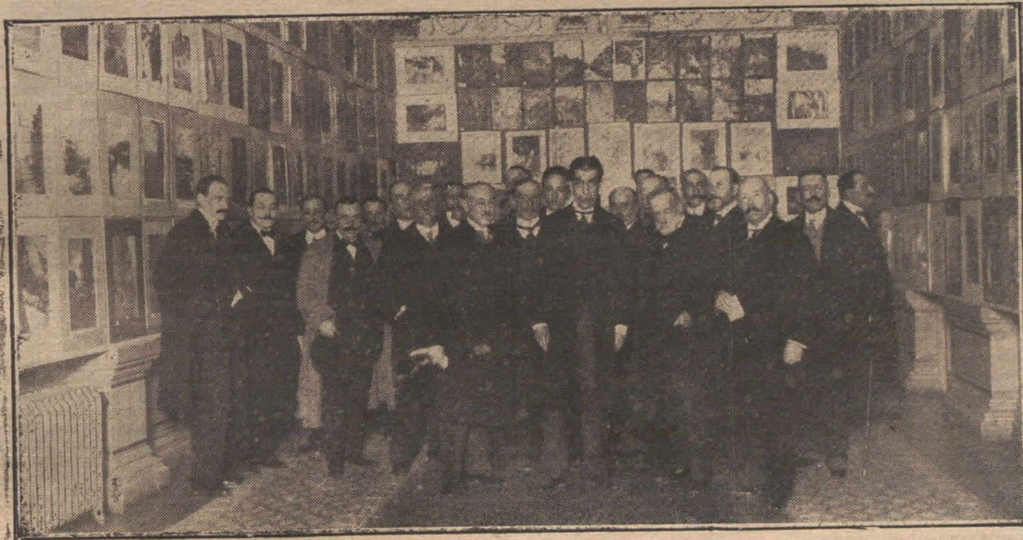
Ministro de Instrucción pública, Sr. Bergamín; los insignes artistas Sres. Ferrant, y D. Torcuato Luca de Tena, en el acto inaugural de la Casa de Tena, en el acto inaugural de la Casa de Tena, en el acto inaugural de la Casa de Tena.