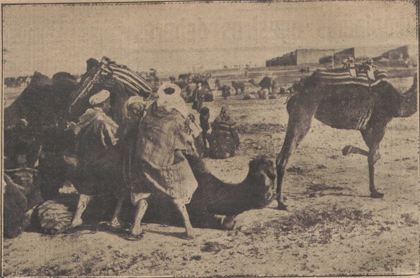
EN LA ALCAZABA DE ZELUAN.—Moros cargando sus mercancías en camellos, para transportarlas al interior de Marruecos. Al fondo se divisa la famosa Alcazaba.

Se ha resuelto la huelga de los joyeros.