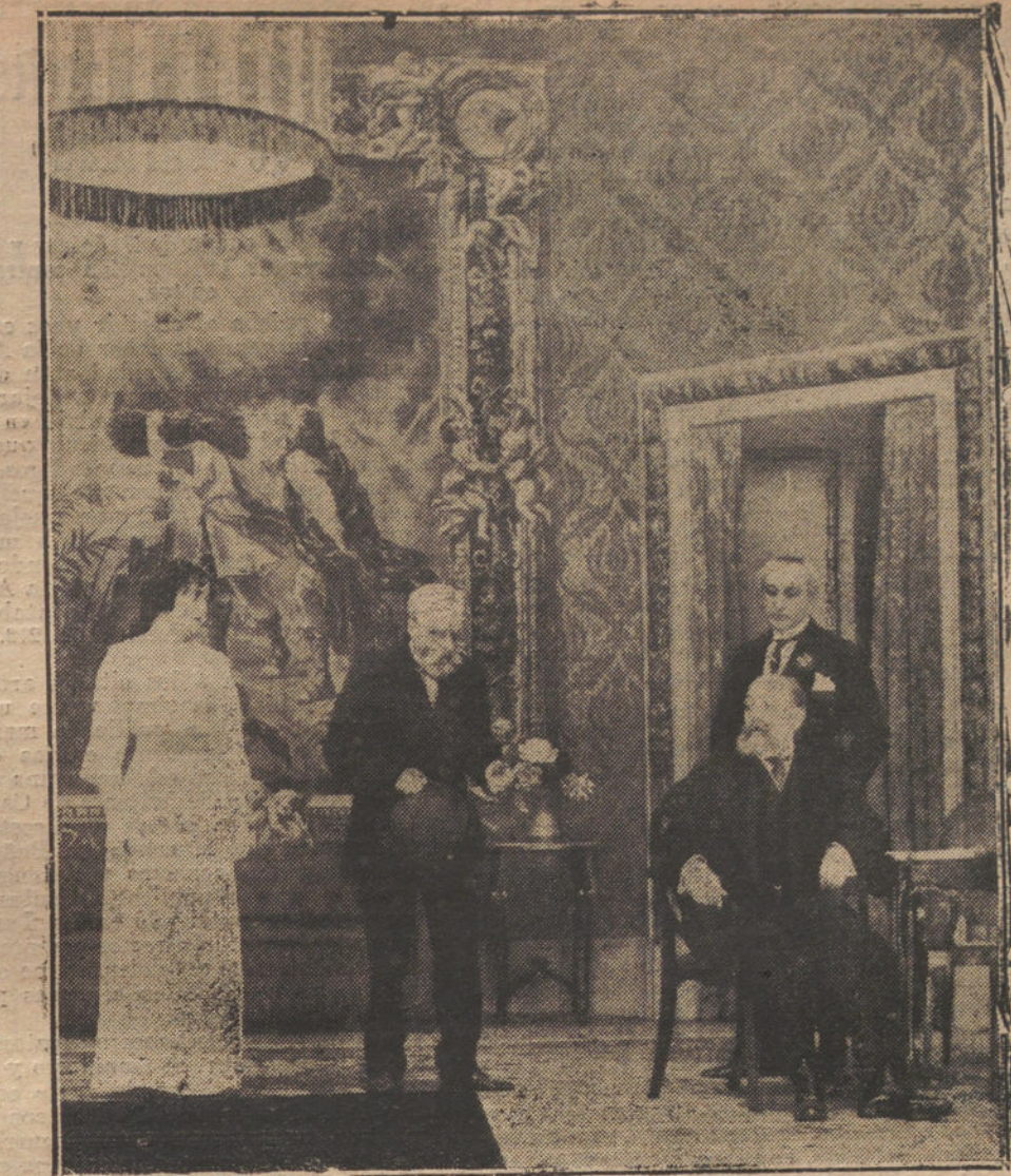
Una escena de «La fuerza del mal», comedia de Linares Rivas, que se estrena mañana en el teatro de la Princesa.

Estos ascensos aumentarían el presupuesto en 49.000 pesetas, por ser la diferencia de comandante a teniente coronel, en sueldo, de mil pesetas; pero quedaría compensado el aumento, pues dejarían de cobrar gratificación de 600 pesetas 49 capitanes que ascendían, y de 480 49 tenientes, de donde resultaría aún un beneficio para el Erario. Esto sin contar con que los ascendidos quedarían excedentes,