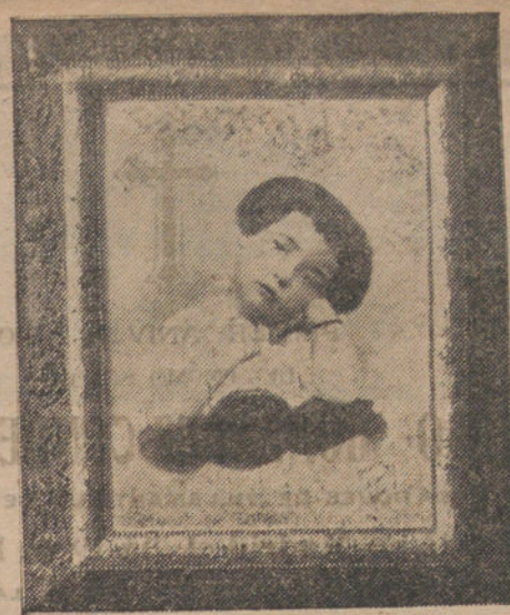
Modelo de las magníficas ampliaciones de gran tamaño que LA TRIBUNA regala a sus suscriptores.