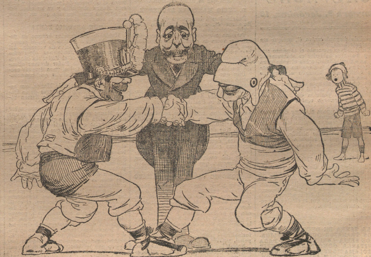
LA LUCHA EN CALATAYUD

En el camino, el cabo indígena referido desobedeció al oficial, y al ser re-