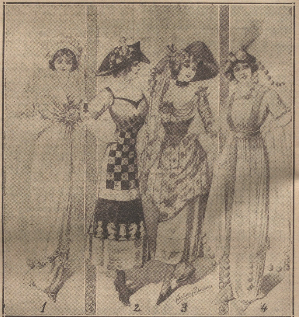
1, Dominó; 2, Ajedrez; 3, Jardinera; 4, Nevada. Los patrones para estos vestidos, Hortaleza, 46. Patrón Parisiense.

Nota: Las señoras residentes en provincias recibirán sus patrones «franco de portes», enviando las medidas siguientes: contorno de pecho, talle espalda, cintura, manga, caderas, contorno; largo falda y figurín que deseen. Pídase tarifa de precios.