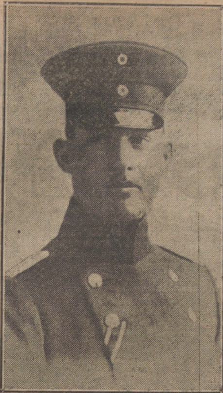
El Príncipe Jorge, heredero del Trono de Grecia, que en breve contraerá matrimonio con la Princesa Isabel de Rumania.

NUMERO DEL TELEFONO DE LA REDACCION, ADMINISTRACION Y TALLERES DE «LA TRIBUNA»: 1.444.