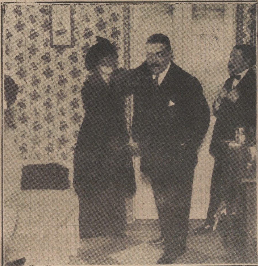
Una «detective» aprendiendo un medio de defensa personal.

Sonreímos con aire de incredulidad, como diciendo: ¡Vamos, las señoritas esas