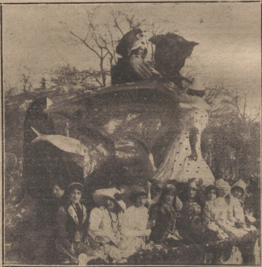
EL CONCURSO DE CARROZAS.—Carroza presentada por la empresa del teatro Real, que ha obtenido el segundo premio.

El Juzgado se presentó y ordenó el levantamiento del cadáver, practicando las diligencias correspondientes.