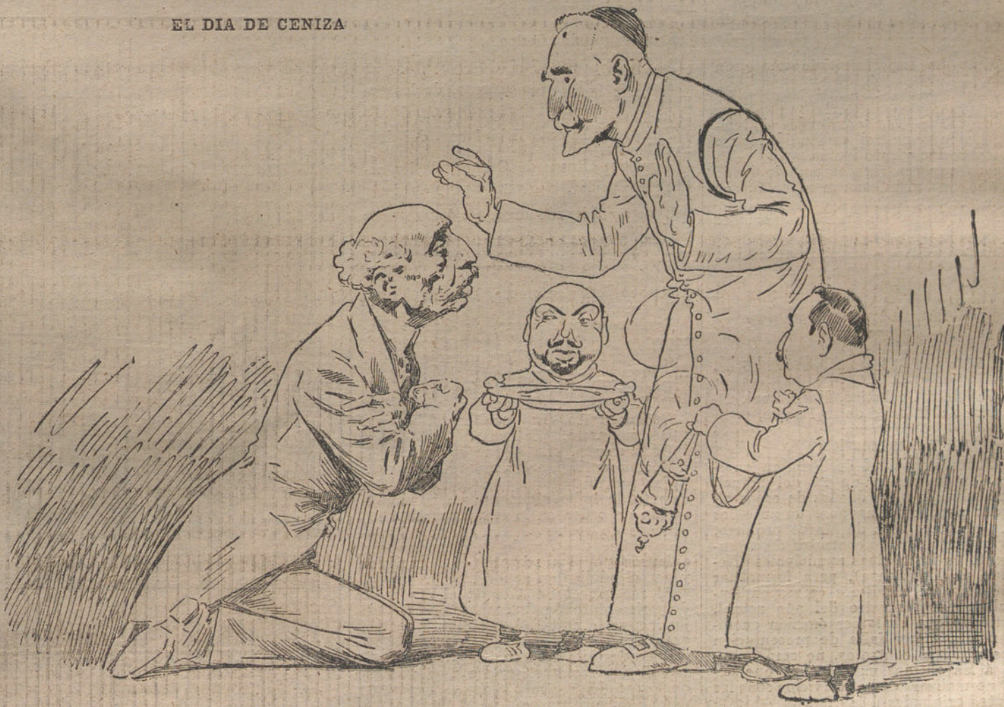
«Polyo eres... y en polvo te convertiremos en las Cortes.» (Caricatura de AGUSTIN)