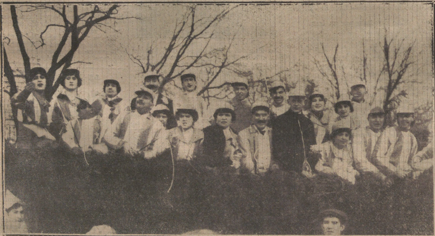
EL CONCURSO DE CARROZAS.—Carroza titulada «Jockey Club», que se ha presentado esta tarde en el paseo de la Castellana.