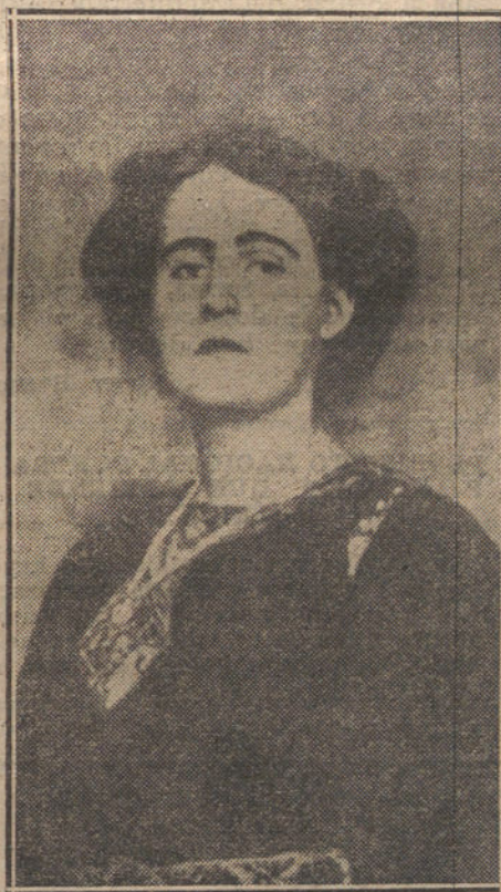
La Princesa Isabel de Rumania, hija de la célebre Reina y escritora «Carmen Sylva», que se casará en breve con el Príncipe Jorge de Grecia.