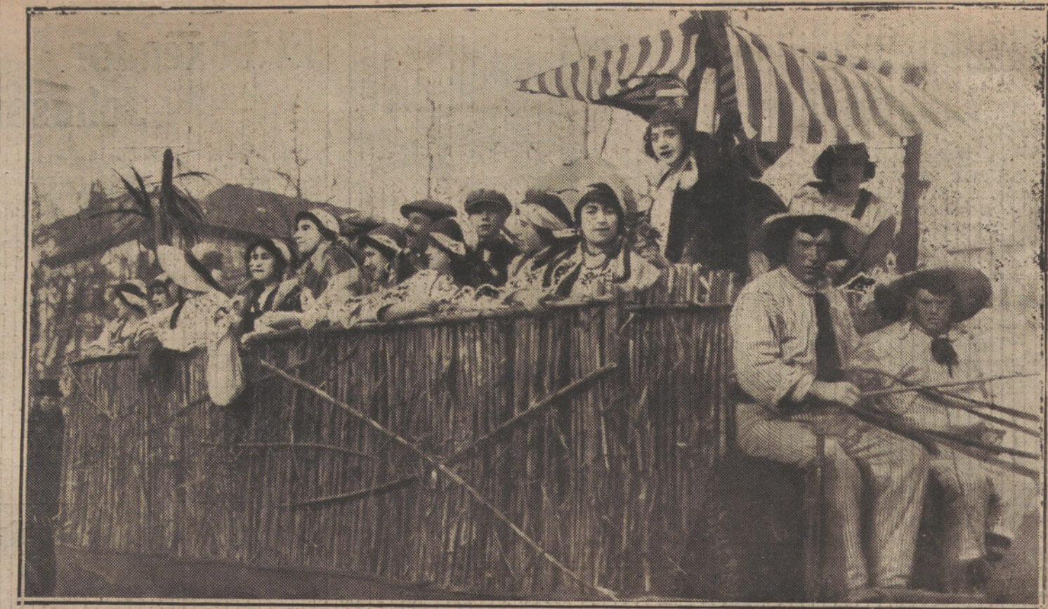
EL CONCURSO DE CARROZAS.—Carroza titulada «La rumba y el rumbo», que ha tomado parte en el Concurso celebrado esta tarde en el paseo de la Castellana.

Me dirán que lo sucedido a la Princesa no puede ocurrir a una buena madre de familia o a un honrado industrial, y que si se hizo tanto ruido acerca de su desaparición, fué por ser Princesa, y, sobre todo, porque la Princesa tocaba una flauta de plata. Puede que sea así; en este siglo de tanto progreso, puede alcanzarse notoriedad por tocar una flauta de plata, y, a quien tal haga, le considerarán las gentes como un ser de excepción. A la curiosidad le