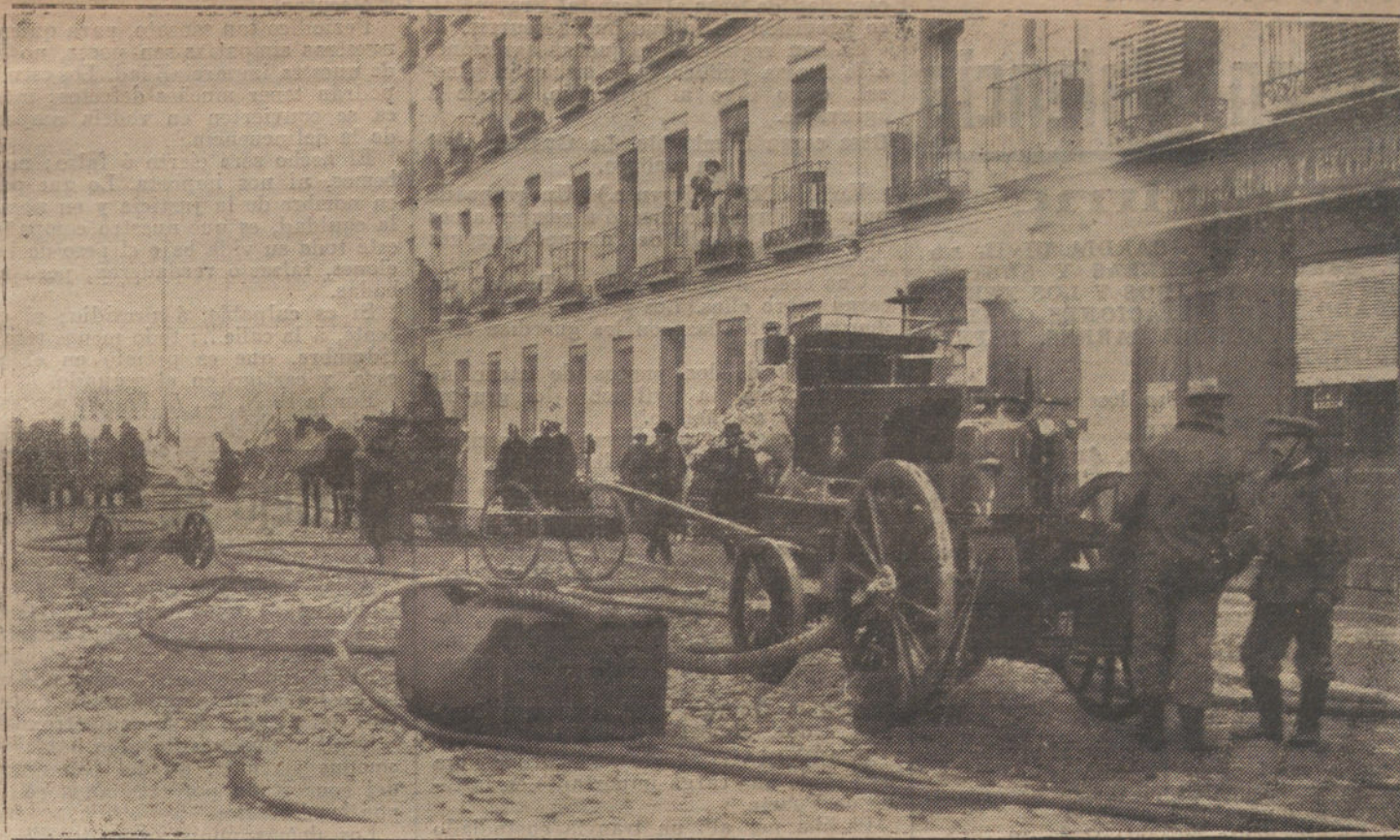
EL INCENDIO DE AYER.—Los bomberos trabajando en la extinción del fuego.

EN EL CENTRO CONSERVADOR, CARRERA DE SAN JERONIMO, 29, SE RECIBEN NOMBRES Y CUOTAS PARA LA VOTACION CONTRA LA POLITICA DEL «TRUST», Y A FAVOR DE LOS SOLDADOS DE AFRICA.