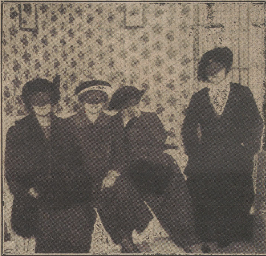
Cuatro señoritas «detectives», capaces de descubrir al autor del crimen de la calle de Tudescos.

Desde hace poco tiempo está funcionando en Madrid una agencia de «detectives», servida por señoritas, que demuestran especiales aptitudes para la profesión policiaca á que se han dedicado.