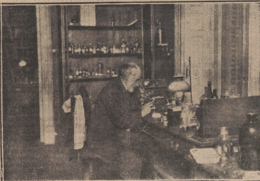
Cajal en el laboratorio del Museo Velasco.