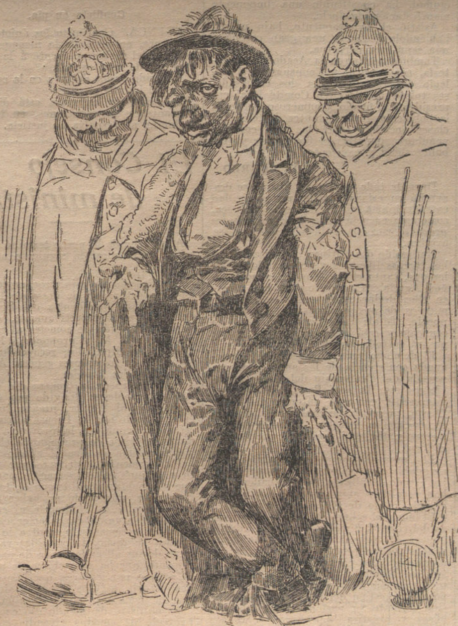
—¡Puñetazos, coscorróns, y al final á la Delegación!... ¡Yo que pensaba divertirme tanto. (Caricatura de AGUSTIN)

Tres de ellos son dependientes de comercio, y se les ha detenido por ejercer coacción.