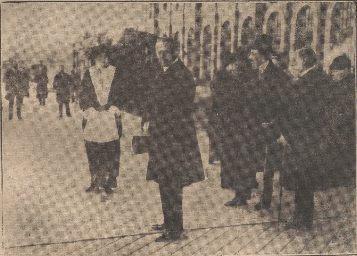
25. MM. en la estación del Norte, esperando la llegada de la Archiduquesa de Austria.

Por medio del Giro postal puede enviarse desde una peseta en adelante.