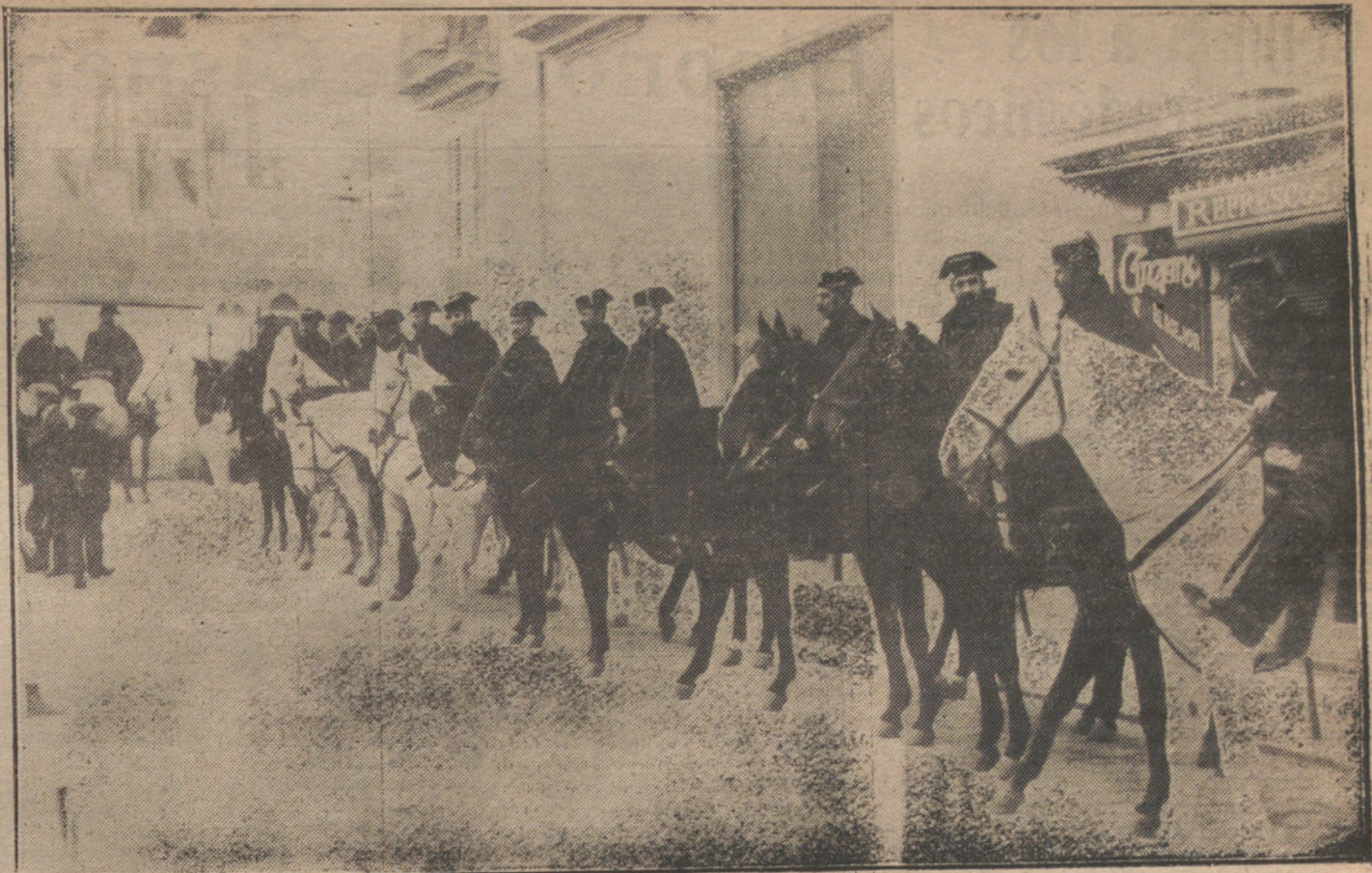
LOS SUCESOS DE VALENCIA.—La Guardia civil estacionada en la plaza de Castelar, junto a la calle de la Sangre, donde está el Ayuntamiento, para proteger la salida del alcalde.

En estado agónico fué trasladado al hospital.