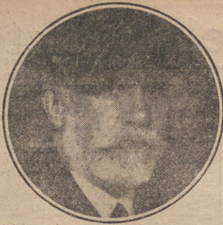
DON PABLO IGLESIAS Socialista.

venil, su espontaneidad, su calor, atraen, encantan. Es un verdadero joven con toda la fuerza de la juventud.