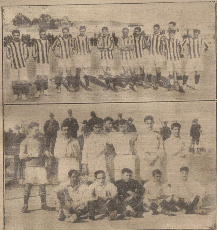
Los equipos Athletic, de Madrid, y Arenas F. B. C., de Bilbao, que ayer jugaron un interesante partido de «foot-ball» en el campo del primero.

Así es que, como los lejanos disparos seguían escuchándose, y nadie sabía la causa, que no podía ser buena, cada cual fuése prudentemente separándose del «soko» y de los enemigos, quedando al rato escaso número de los cientos que había, y algunos de nuestra amistad, que aprovecharon aquellos momentos de incertidumbre