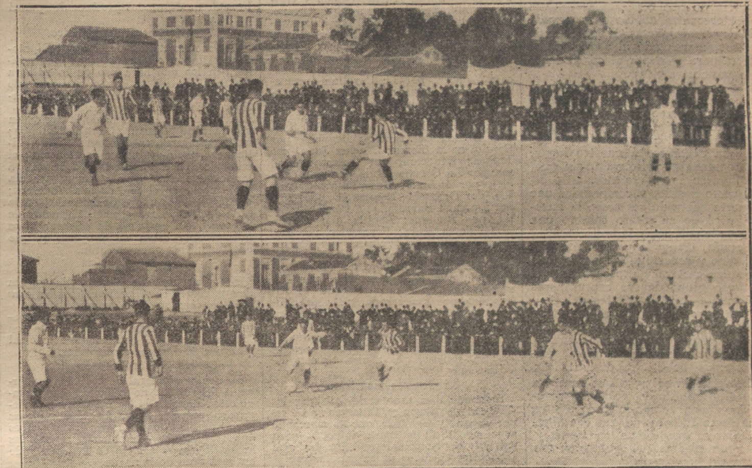
Dos momentos interesantes del partido de «foot-ball» jugado ayer entre los equipos Arenas F. B. C., de Bilbao, y Athletic, de Madrid.

«Sivera» es rubio, pequeño, recio, de ojillos verdes, de expresión simpática y ruda, de charla burlona y divertida. No parece moro y si tiene mucho de andaluz. Creyéramosle campesino de Vélez, si no vistiera chilaba. Yo le tengo un afecto leal y profundo, porque le