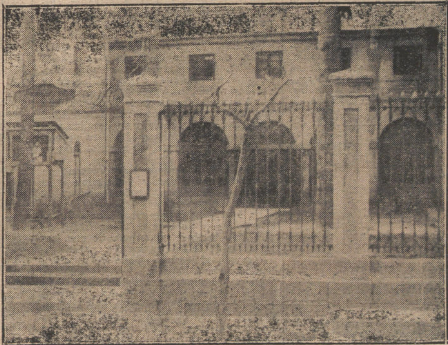
La Escuela de Ingenieros del Escorial, clausurada por orden del ministro, después de los sucesos.

Monárquicos fervorosos, sirven sus ideales engrosando las filas dinásticas con unos millares de votos.