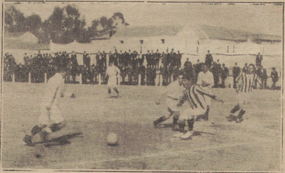
FOOT-BALL.—Arenas, de Bilbao, contra Athletic, de Madrid.

Lo ocurrido este último partido es escandaloso. Se verifica un sorteo para designar fechas, horas y campo en que deban jugarse los partidos, y se anuncia el resultado, todo esto en el mes de Diciembre. Pero al Athletic se le ocurre traer al Club Arenas para jugar con su primer equipo, y por este sólo hecho tratan de suspender el partido, alegando que no tienen jugadores. ¿Es que el Athletic no tiene nada más que un equipo, y que si éste juega no puede jugar el segundo? Y en caso de que así sea, ¿por qué, sabiendo que el domingo tenían que jugar, eligen dicho día para traer al Arenas?