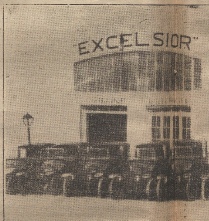
Automóviles Lorraine-Dietrich, adquiridos por la Sociedad «G...» servicio. (Sobre NEUMATICOS C... Representación: SOCIEDAD EXCELSIOR, CALLE A...

El domingo 8, a las tres de la tarde, jugarán un partido los primeros equipos de la Sociedad Gimnástica y el Madrid Foot-Ball Club, en el campo de los primeros.