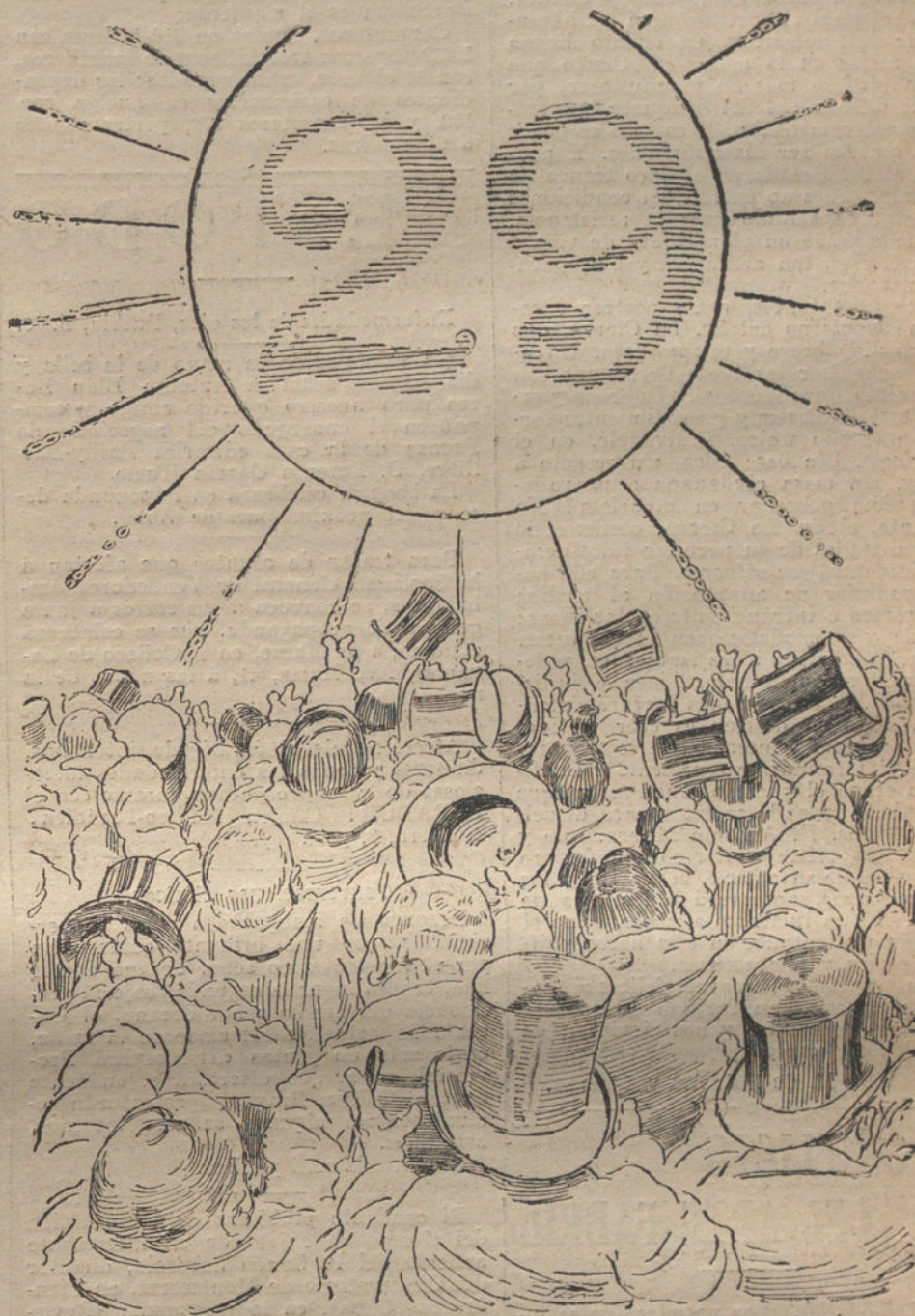
Los adoradores del sol de Marzo. (Caricatura de AGUSTIN)

¿Base de sustentación para un centro de gravedad ideal ilusoria? Ninguna, a no ser que la palabra sustentación se interprete en su recto y gástrico sentido. Sólo se apoya ese Gobierno, como la hiedra en el olmo, en la Monarquía, robándole jugos y virtualidad política. Vive, pues, como un caso de parasitismo. Y esto, naturalmente, es absurdo. Una vida así no puede prolongarse mucho tiempo. Los Gobiernos necesitan