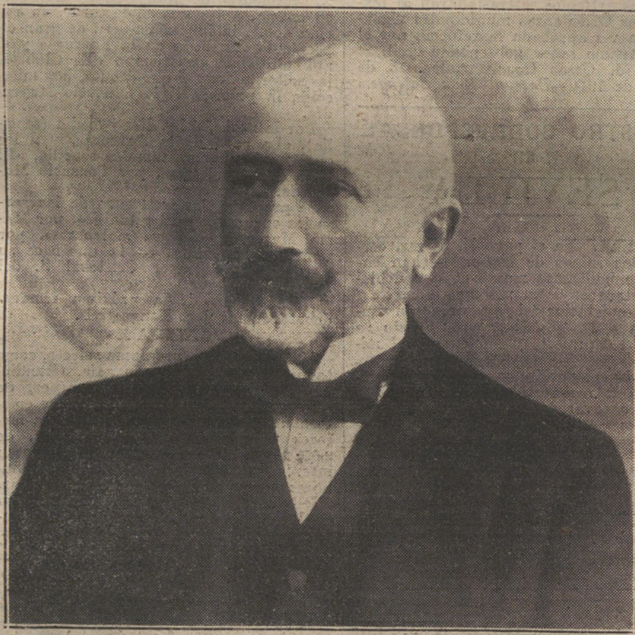
DON FRANCISCO BELDA Y PEREZ DE NUEROS, subgobernador del Banco de España.

La Sociedad Arnús-Garí, de Barcelona, nos ha remitido un bien editado folleto, que tiene por objeto, según advertencia preliminar inserta en el mismo, «divulgar entre el público capitalista el conocimiento de los valores de renta más interesantes cotizados en la Bolsa de Barcelona».