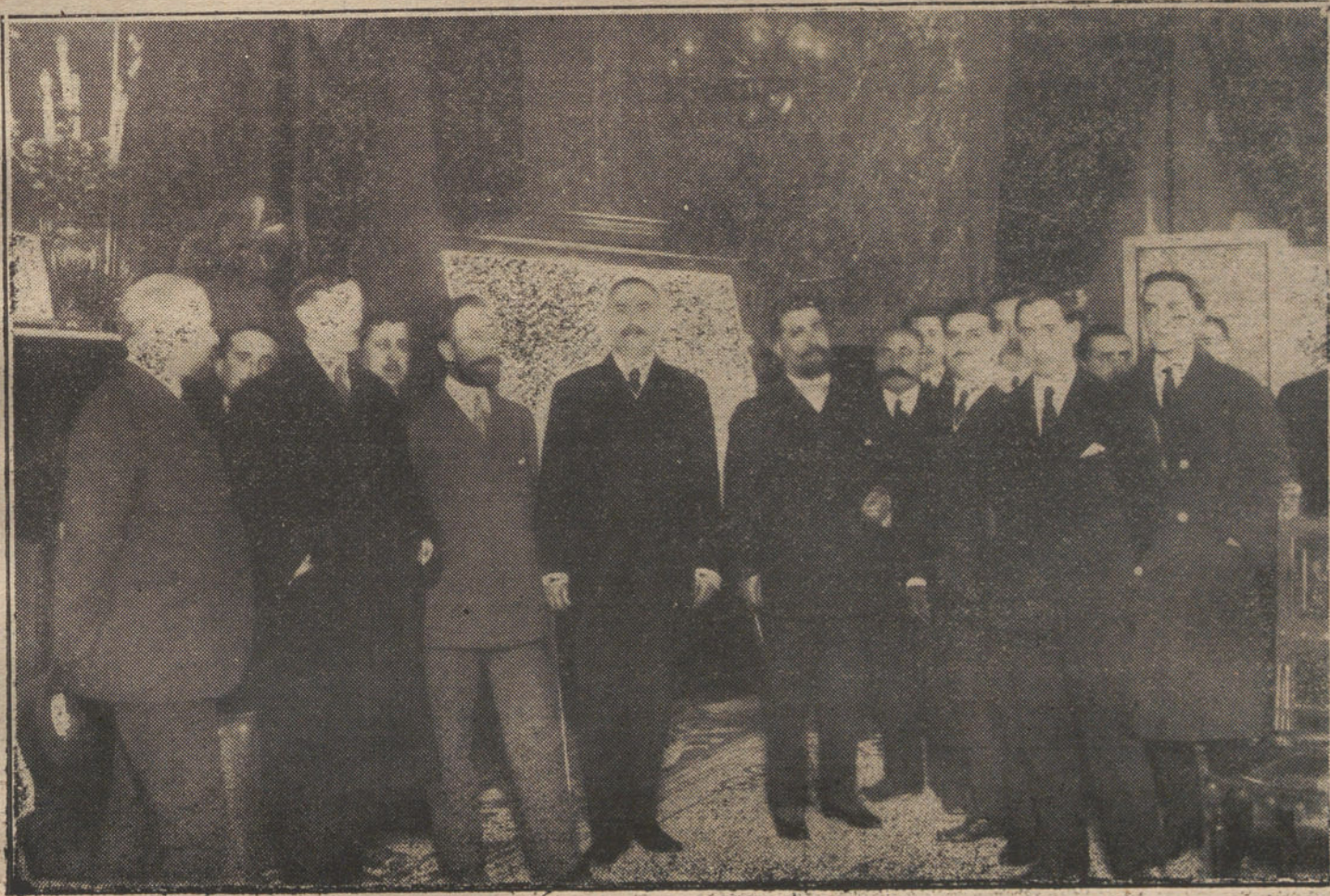
LOS SUCESOS DE EL ESCORIAL.—La Comisión de profesores y alumnos de la Escuela de montes durante su visita al ministro de Fomento.

PARA TODO LO REFERENTE A PUBLICIDAD FRANCESA EN «LA TRIBUNA» DIRIGIRSE A NUESTRA AGENCIA EN PARIS: RUE VIVIER, N.º 22.