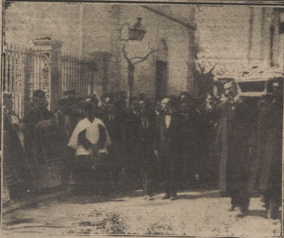
El cortejo fúnebre dirigiéndose á la estación del Escorial desde el depósito de aquel cementerio. Debajo, el párroco del Escorial rezando un responso frente á la Escuela de Montes.