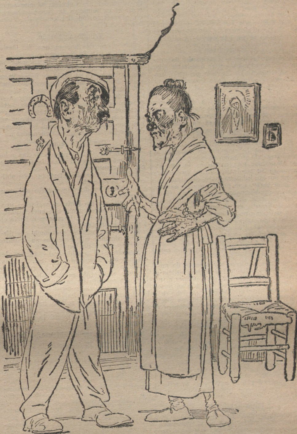
EL PROBLEMA DEL VOTO

El untuoso presidente del Consejo, ex consejero y abogado de todas las grandes Empresas y banqueros, se ha olvidado del respeto que merecen las