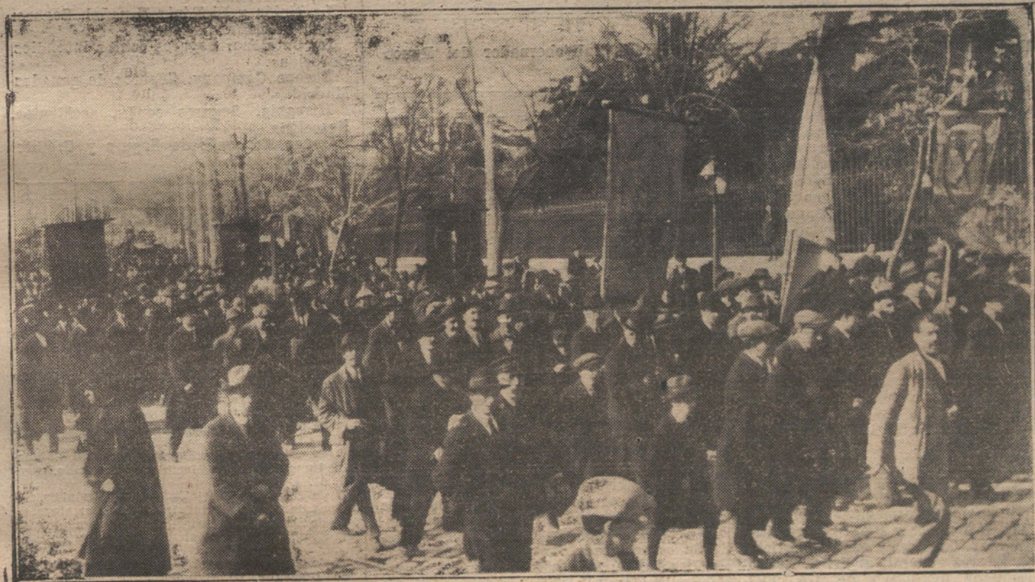
Los estudiantes de Madrid en el cortejo fúnebre. (Fot. VIDAL)

La superioridad de la PIANOLA PIANO sobre todos los demás instrumentos, es reconocida hasta por nuestros competidores, como lo demuestra el hecho de que indebidamente pretenden algunos hacer pasar por PIANOLA y PIANOLA-PIANO a aparatos similares y apócrifos.