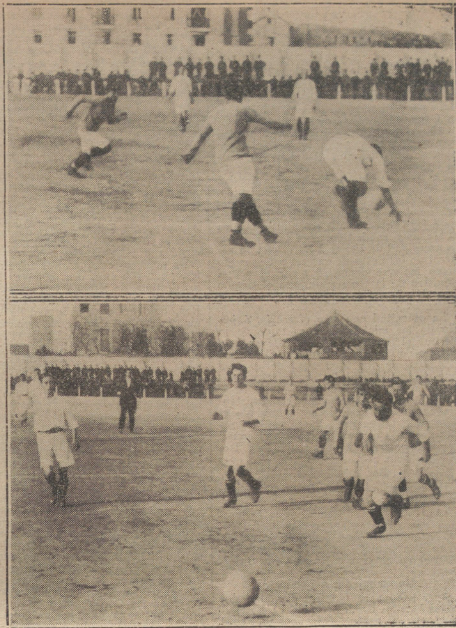
EL PARTIDO DE «FOOT-BALL» DE AYER.—Dos momentos interesantes del partido jugado entre los equipos Arenas F. B. C., de Bilbao, y Madrid F. C.