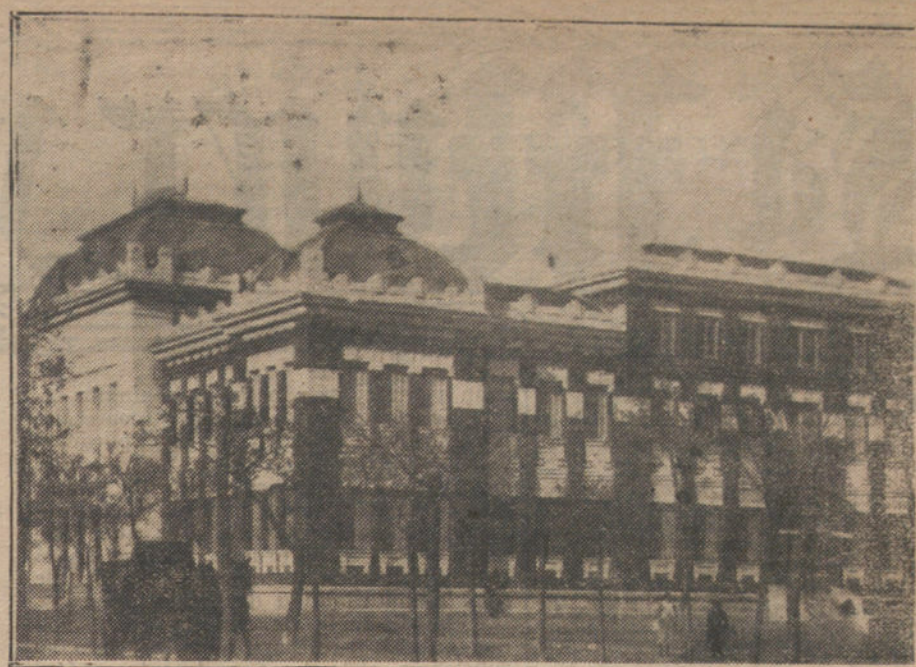
Magnífico edificio que la ciudad de Palencia ofrece para Escuela de Ingenieros de Montes, además de toda cooperación material.

«Ya veis como sabemos confesar nuestro pecado, y esto, que no fué nunca de los mauristas, sino de parte de la plana mayor del partido, más atenta a sus propias conveniencias que a la necesidad de dialogar con las izquierdas. Somos sinceros ¡Ojalá lo fueran cuantos intervienen en la vida pública! ¡Ah! Si lo fuera esa Prensa que nos llama disolventes, olvidada de su historia, perdido el recuerdo de que fué ella la que nos lanzó a la lejana aventura guerrera con los Estados Unidos...» (Una ovación enorme ahoga las palabras del vehemente orador.)