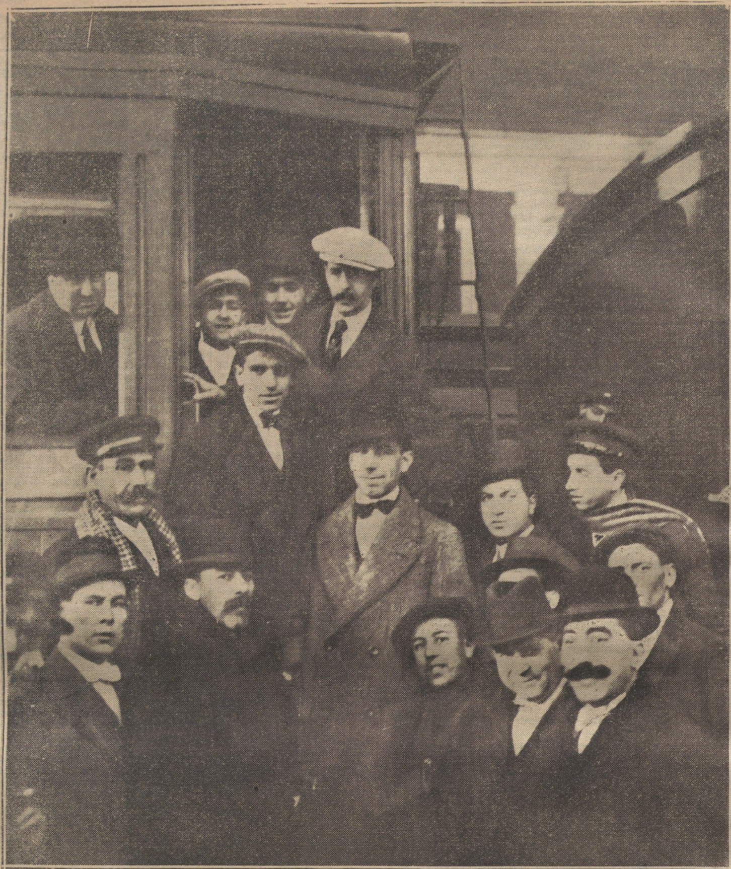
EL REGRESO DE BELMONTE Y VICENTE PASTOR.—Los diestros al descender al andén.

EN EL CENTRO CONSERVADOR, CARRERA DE SAN JERONIMO, 29, SE RECIBEN NOMBRES Y CUOTAS PARA LA VOTACION CONTRA LA POLITICA DEL «TRUST», Y A FAVOR DE LOS SOLDADOS DE AFRICA.