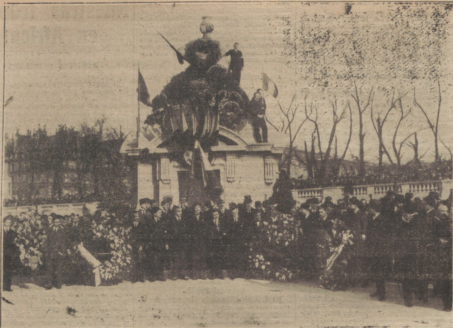
Manifestación de estudiantes alemanes ante la estatua conmemorativa de la batalla de Strasburgo.—Grupo de delegados de diferentes escuelas en la plaza de la Concordia, de París.

—Señores, yo creo que para escuchar una queja, nadie mejor que el Sr. Quejana.