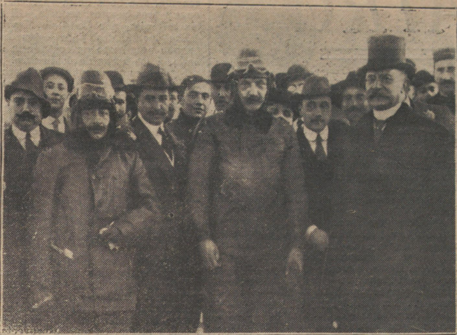
LA AVIACION CIVIL.—Los pilotos de la Escuela Nacional de Aviación Adaro y de la Vega, que hicieron ayer el recorrido Guadalajara-Getafe en cuarenta minutos.

para estudiar el último movimiento y oír á los obreros despedidos.—Chavez.