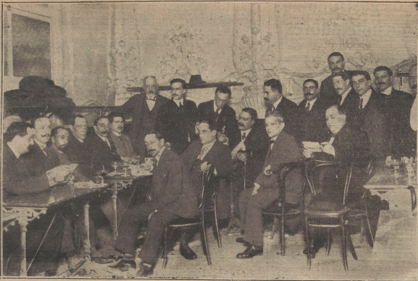
Grupo de catalanes que se reunieron anoche en la Maison Dorée, para festejar el triunfo de la regional y la derrota de Lerroux.

Es incierto, pues—lo diremos como los parlamentarios,—que se preocupara en pedir las obras de Gavinet; si hubiera usted tenido esta instructiva idea, se le hubieran servido todas, una tras otra, pues todas están; pero usted no pensaba, es natural, más que en la ausencia de las suyas. El incidente que usted cuenta, el glorioso incidente de que se hiciera hincapié en lo de «El C. Audaz», para que usted, cruel y gentil, respondiera «También puede ser El Conde Audaz, si usted no tiene inconveniente», dejando á un tiempo atónito al público de las inmediateces y asolado con su glacial deferencia al buen bibliotecario, no sucedió; en cambio, lo que sí pudo suceder es que, para justificar la ausencia de dos de las tres novelas suyas (libreme Dios de sospechar que con esa «muestraria» intención dejaran allí la que queda), le hubiéramos tenido que dar explicaciones y repetir al propio autor, paternal y confidencialmente, lo que al lector, cuando se nos pide consejo sobre la elección de letra: «No, no lea usted eso; lea usted otra cosa.»