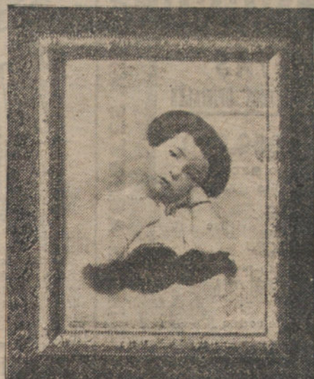
Modelo de las magníficas ampliaciones de gran tamaño que LA TRIBUNA regala a sus suscriptores.