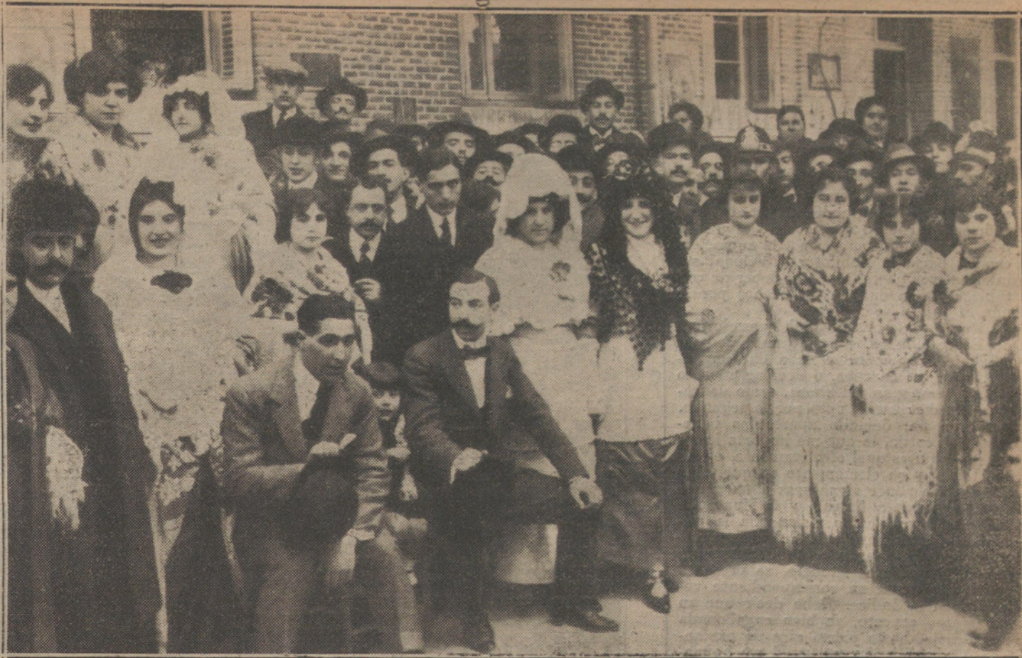
Grupo de madrileños que asistieron á la fiesta de las majas celebrada ayer tarde en la Bombilla.

NUMERO DEL TELEFONO DE LA REDACCION, ADMINISTRACION Y TALLERES DE «LA TRIBUNA»: 4.444.