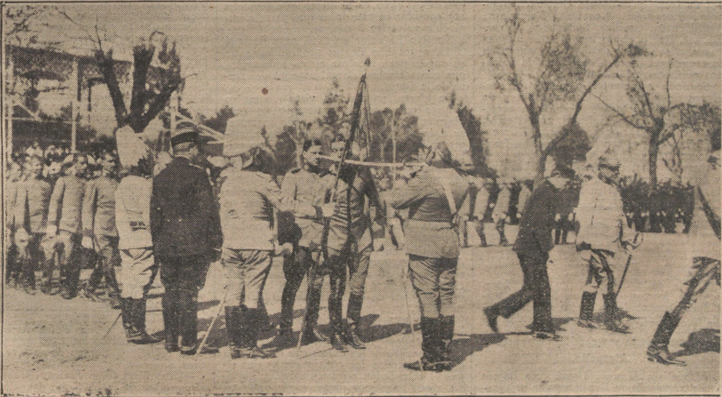
LA JURA DE LA BANDERA EN CORDOBA. Los reclutas de cuota jurando la enseña de la Patria.

A las seis de la tarde, Escuela Nueva; a las nueve de la noche, Junta directiva de la Sociedad de carpinteros de taller, y a la misma hora, Consejo de administración.