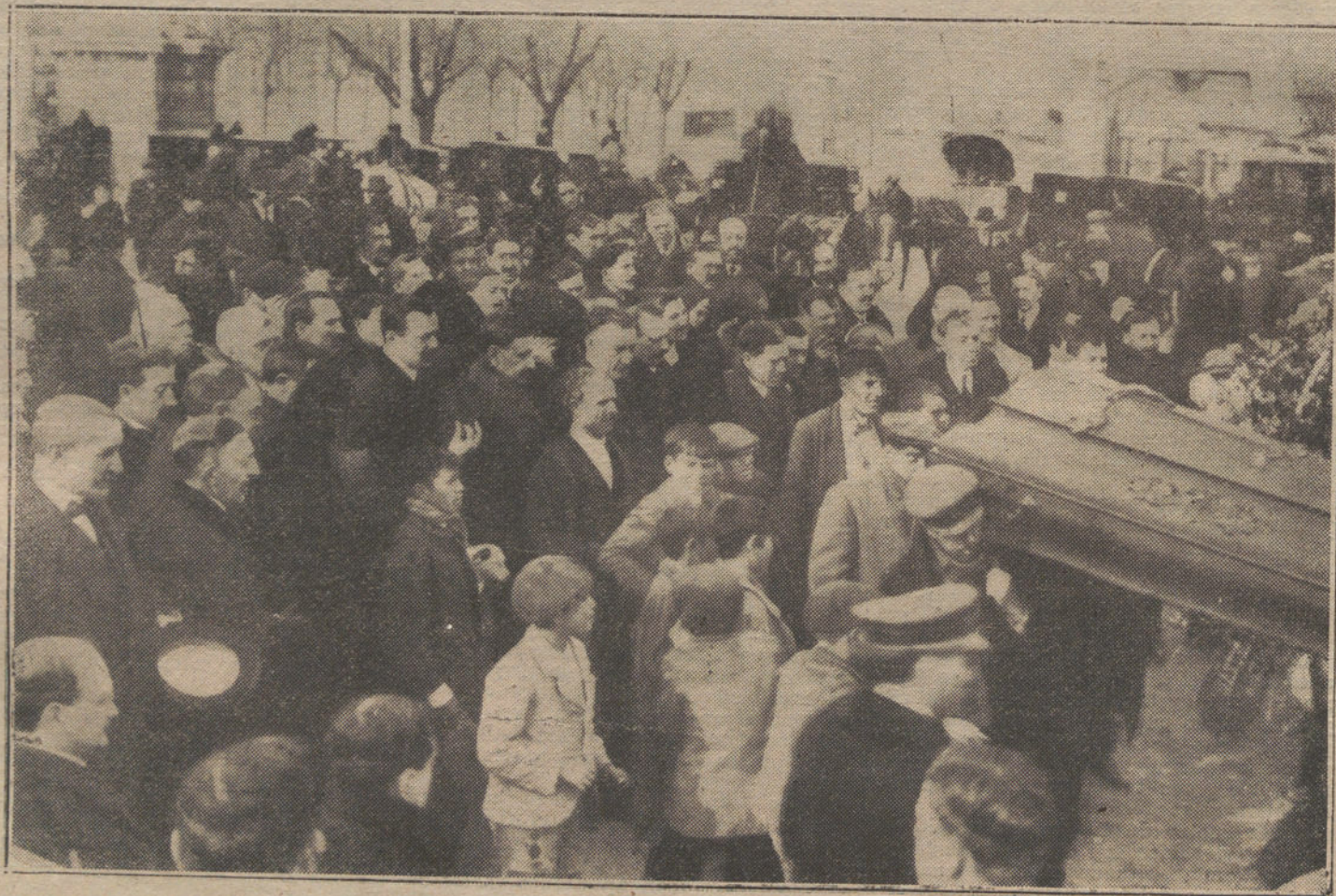
EL ENTIERRO DE «DULZURAS».—El féretro y la presidencia del duelo.

El ejercicio práctico no excederá de tres horas por asignatura, y el oral, de media.