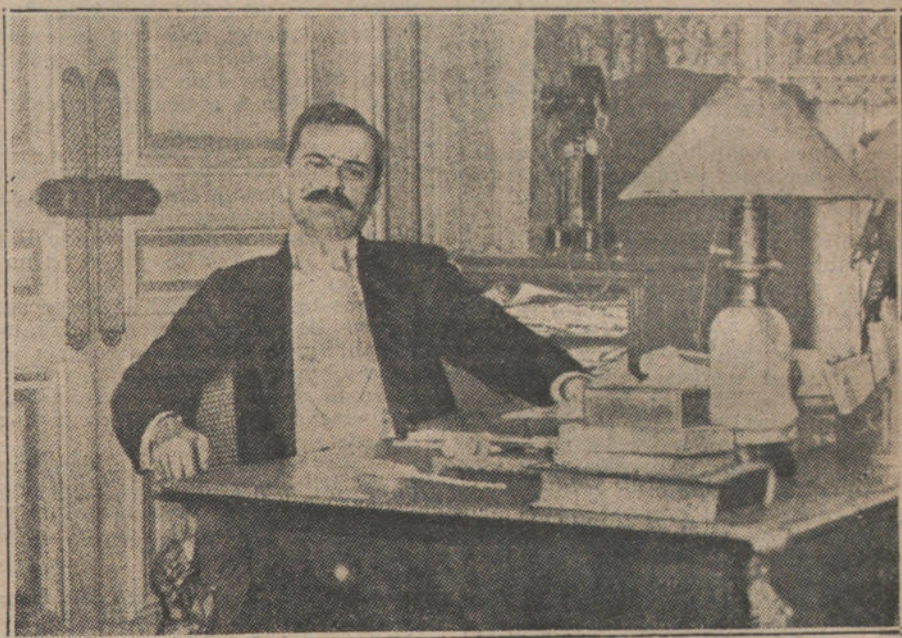
Ultimo retrato de GASTON CALMETTE, en su despacho de «Le Figaro».

Imprudently se apoyó en una cuerda, y al romperse ésta cayó la desgraciada Juana á la calle, produciéndose tan graves heridas, que falleció á los pocos momentos.