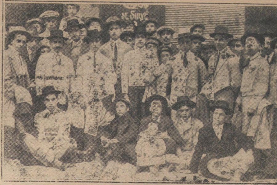
FIESTA BENEFICA EN GUADALAJARA.—Grupo de jóvenes que tomaron parte en la becerrada á beneficio de las cantinas escolares de aquella capital.

Por eso detestamos el caciquismo, espantosa plaga social, que en Lugo, como en todas partes, hace sentir su funesto influjo, y cuya raigambre favorecen y