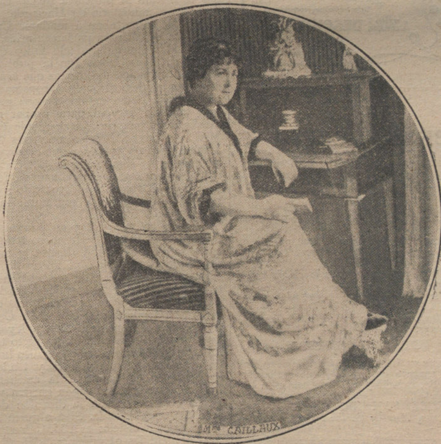
Mme. CAILLAUX, esposa del ex ministro de Hacienda francés, autora del asesinato del director de «Le Figaro». (De «Excelsior».)

según «Le Temps», es un gran gobernante, de quien España puede esperar las mayores venturas. ¡Qué le importa á «Le Temps» España, ni qué saben ellos de estas cosas!