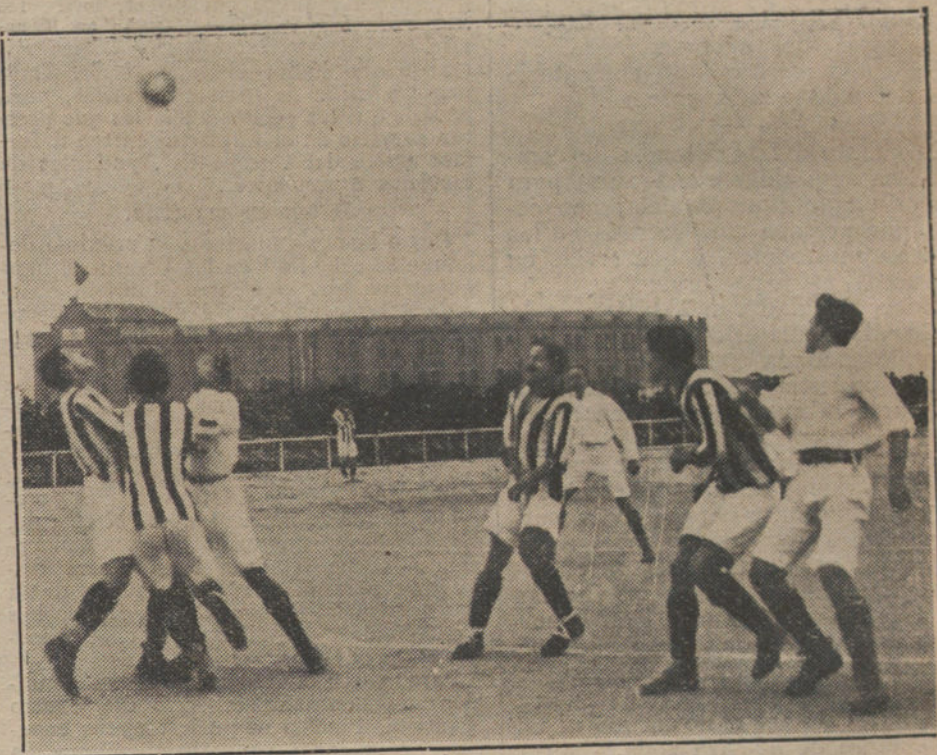
Un momento del partido de «foot-ball» jugado ayer tarde entre los equipos Gimnástica y Athletic.

ánimos contra nuestros buenos amigos los franceses, pues nunca creí que la misión del que escribe sea encender odios, sino quitar vendas, y poner de manifiesto que una buena amistad no se demuestra con banquetes, palabras melosas y recíprocas galanterías, sino con hechos palpables, que no pongan de manifiesto la mala fe, sino la verdadera amistad. Esa es misión de periodista.