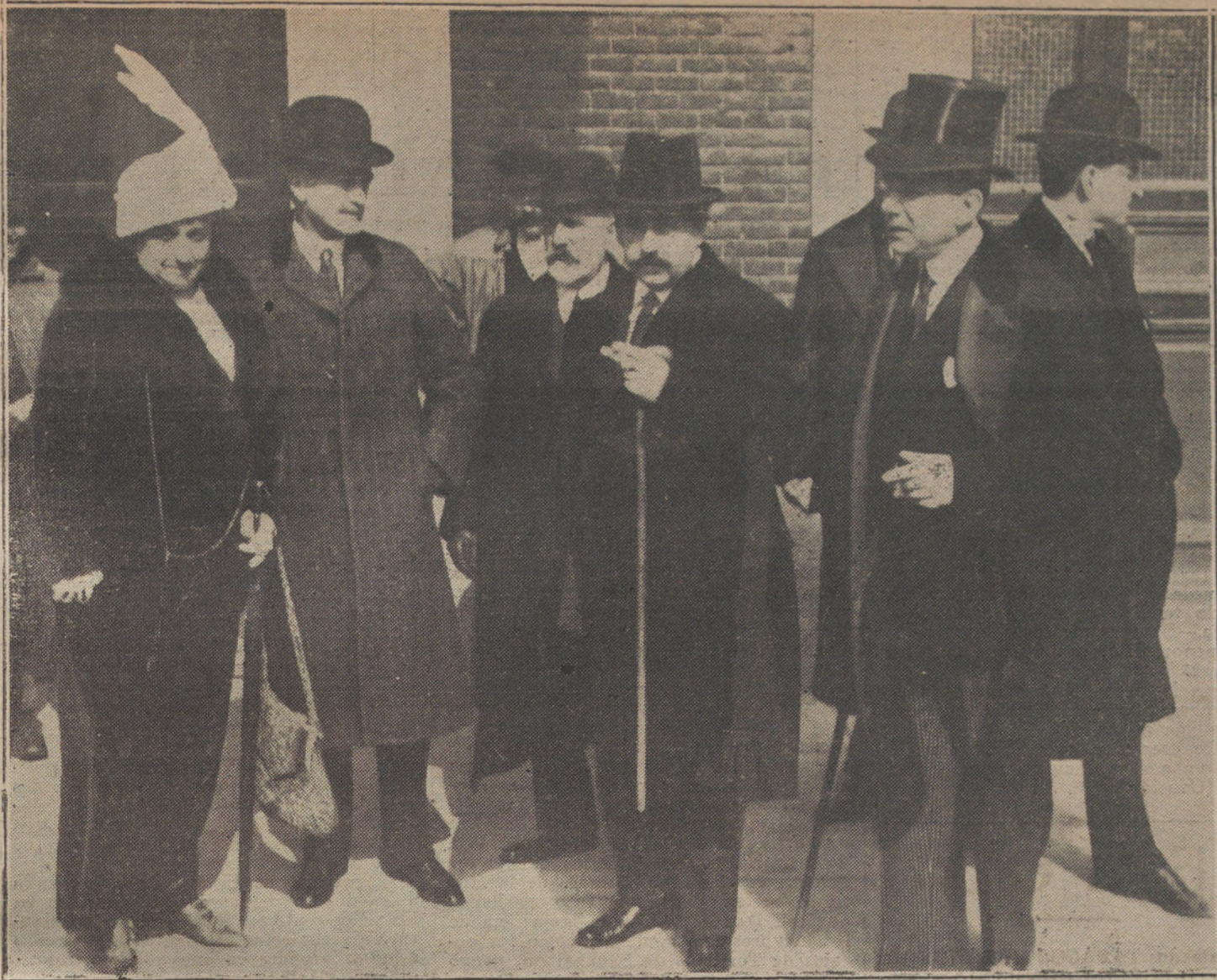
LLEGADA DE PAUL HERVIEU A MADRID.—El ilustre autor en la estación del Norte, acompañado de María Guerrero, Ramos Carrión, Eduardo Marquina, Fernando Díaz de Mendoza y Joaquín Belda.