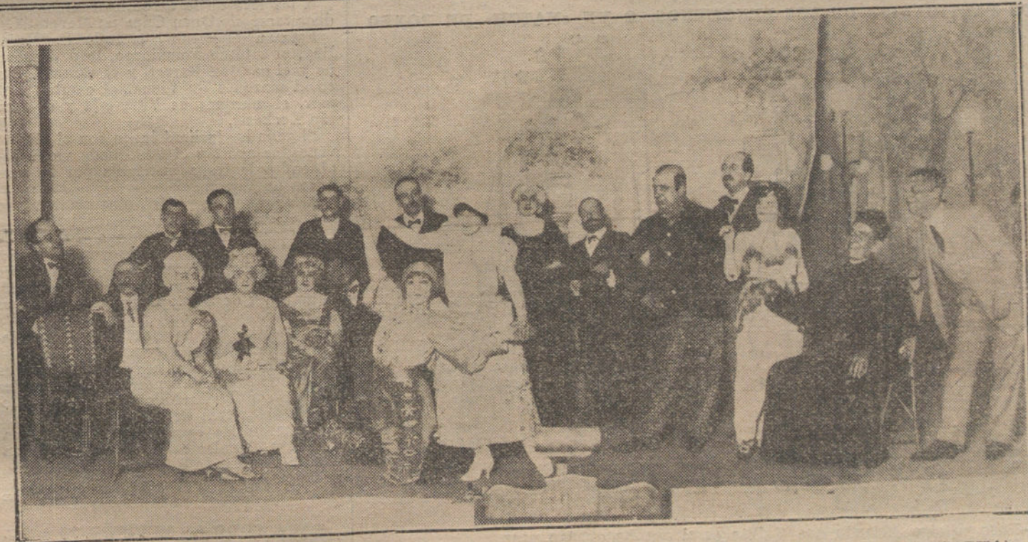
Una escena de la obra «El tango argentino», estrenada con feliz éxito en el teatro Cómico.

Era una cuestión que se debía abordar en estos momentos en que se encuentran aquí el alto comisario y el delegado de Fomento, Sr. Soler, que tan importantes servicios presta en nuestra zona de influencia.