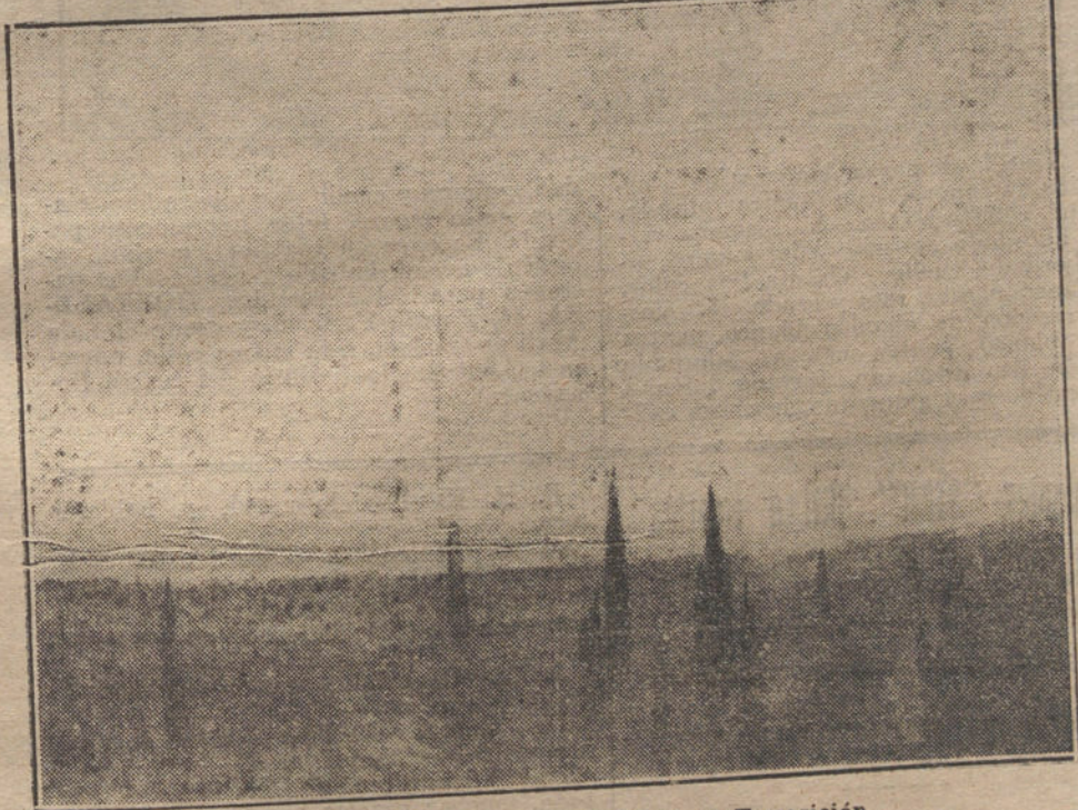
Cuadro de Navarro, que figura en su Exposición.

Si en la interpretación de jardines, flores y troncos es Navarro un pintor formidable, interpretando nubes y celajes es un maestro inimitable; a los cielos que él pinta sabe imprimirles un aire de grandiosidad, una justeza de expresión y una dulzura en los contrastes que sólo es comparable a la grandeza de sus horizontes.