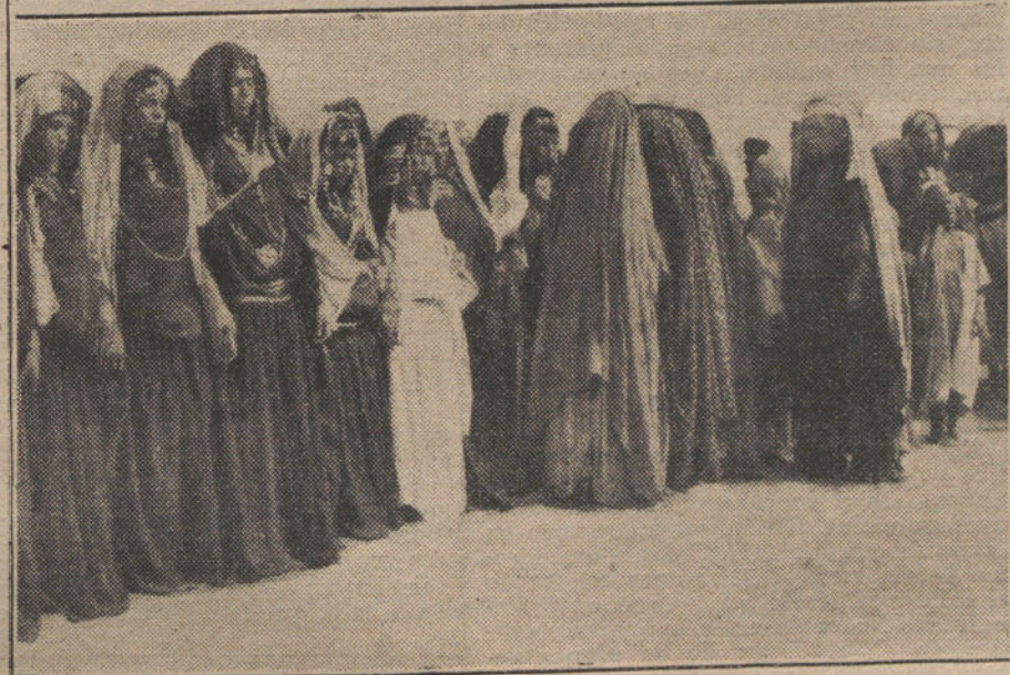
COSTUMBRES DE EL CAIRO.—Un mercado de mujeres. Los vendedores de esclavas no perdonan procedimiento para hacer la propaganda de su «mercancía». Al efecto, muchos de estos vendedores instalan en el mercado grandes columpios, donde se mecen las esclavas, para llamar así la atención de los compradores.