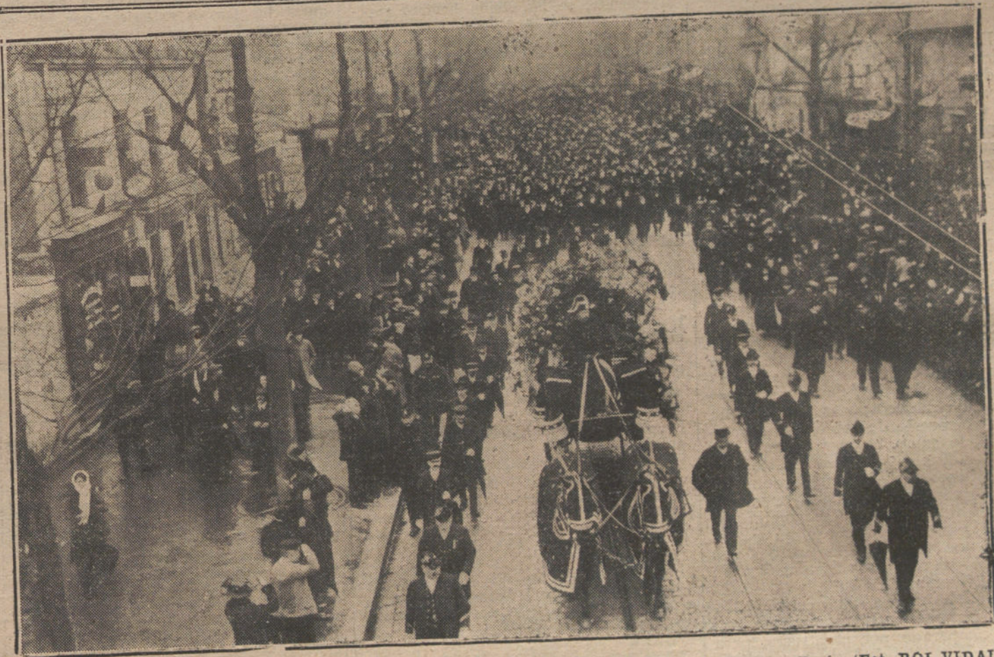
EL ENTIERRO DE GASTON CALMETTE.—El cortejo fúnebre desfilando por las calles de París.

EN VISTA DE LAS PETICIONES QUE DEL DISCURSO DE GABRIEL MAURA HEMOS RECIBIDO, Y HABIENDOSE AGOTADO EL NUMERO EN QUE SE PUBLICO, SE HA PROCEDIDO A UNA NUEVA TIRADA. LOS QUE DESEEN ADQUIRIRLO PUEDEN DIRIGIRSE A LA ADMINISTRACION DE «LA TRIBUNA», DONDE SE LES FACILITARAN CUANTOS EJEMPLARES DESEEN.