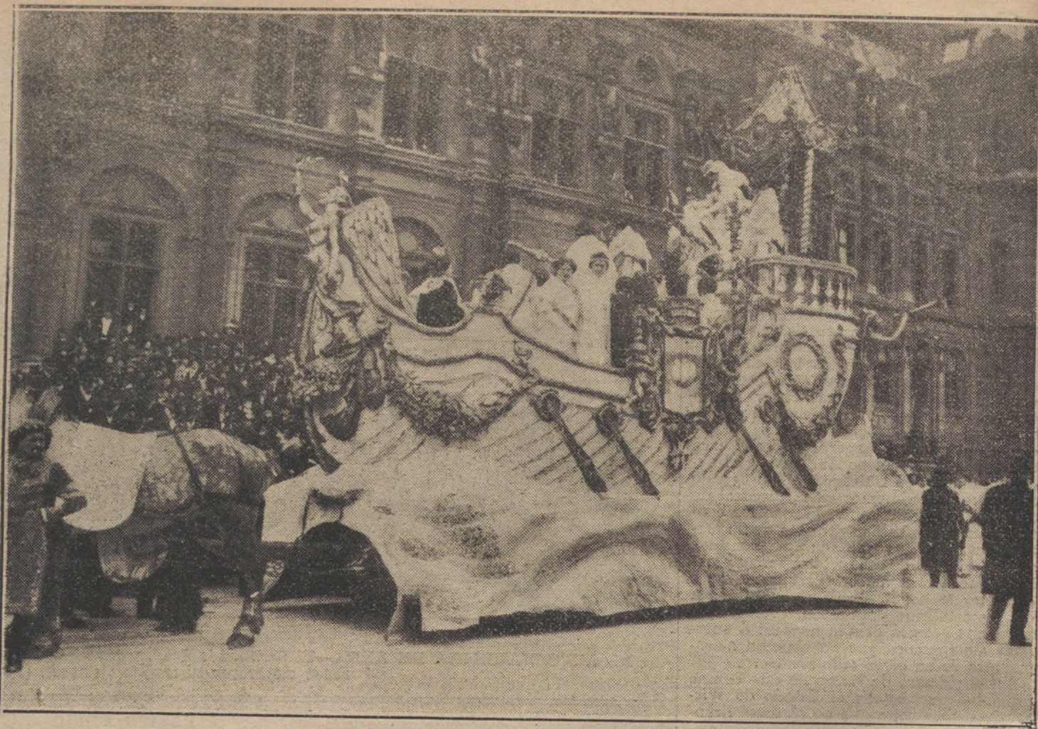
LAS FIESTAS DE LA MI-CAREME EN PARIS.—Carroza que conducía a la reina de la fiesta y su corte de amor.

preciso socorrer a los viajeros. El bien que hagáis, será conocido por Dios.»