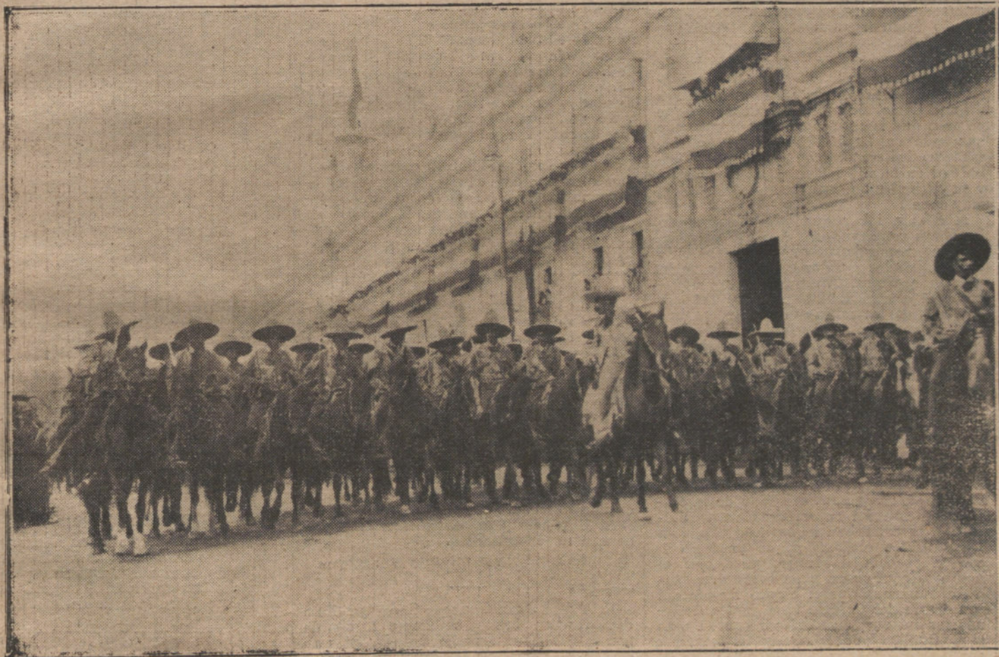
LA SITUACION DE MEJICO.—Las fuerzas rurales, institución semejante á nuestra Guardia civil, que por disposición del general Huerta ha marchado á engrosar las filas del Ejército que está en campaña.

Es que fuera de España no se producían preceptos, movimientos, ideas que justificasen la existencia de un movimiento anticlerical? Yo me limitaría á preguntar: ¿Recordáis vosotros de que en España exista algún precepto por virtud del cual, para tomar posesión de una función pública, sea necesario atestiguar bajo juramento que se cree en la existencia de Dios y en la inmortalidad del alma? Pues ese es un precepto que está escrito, no es una, sino en varias de las Constituciones de los Estados Unidos, la de Mississippi entre otras. ¿Recordáis vosotros de que en España algún precepto haya establecido que constituyera un delito castigado por las leyes la traducción al lenguaje vulgar de los Evangelios? Pues eso estaba establecido en Grecia, y prohibido por una Constitución que lleva la fecha de 1910. ¿Recordáis de alguna República en que se exija al Presidente que, al tomar posesión de su cargo, jure mantener la unidad católica? Pues eso existe también en la República de Chile. ¿No recordáis de la algarada producida en los Estados Unidos cuando, al presentar su candidatura