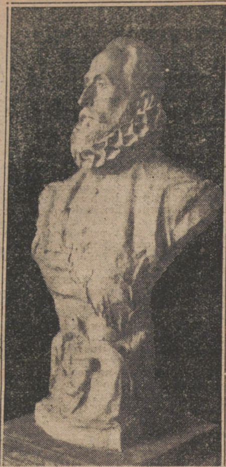
Busto del Greco, obra del escultor Miguel Angel Trilles, hecho para la velada conmemorativa que se ha celebrado hoy en el Circulo de Bellas Artes.

LA TAREA DE DEVOLVER TODOS LOS TRABAJOS QUE NO PUBLICA- MOS SERIA ABRUMADORA, Y PARA EVITARLA, COMO PARA PREVENIR RECLAMACIONES, QUE RESULTA- RIA IMPOSIBLE ATENDER, RECOR- DAMOS QUE NO SE DEVUELVEN LOS ORIGINALES.