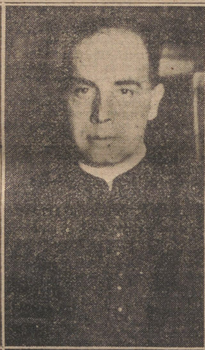
D. Miguel Asín Palacios.

Para dar posesión de plaza de número de académico electo en la Real Academia de Ciencias Morales y Políticas a D. Miguel Asín Palacios, se ha celebrado esta tarde, con gran solemnidad, a las tres y media, su recepción, leyendo su discurso de entrada, con el tema de «Abenmasarra y su escuela. Orígenes de la filosofía his- pano-musulmana».