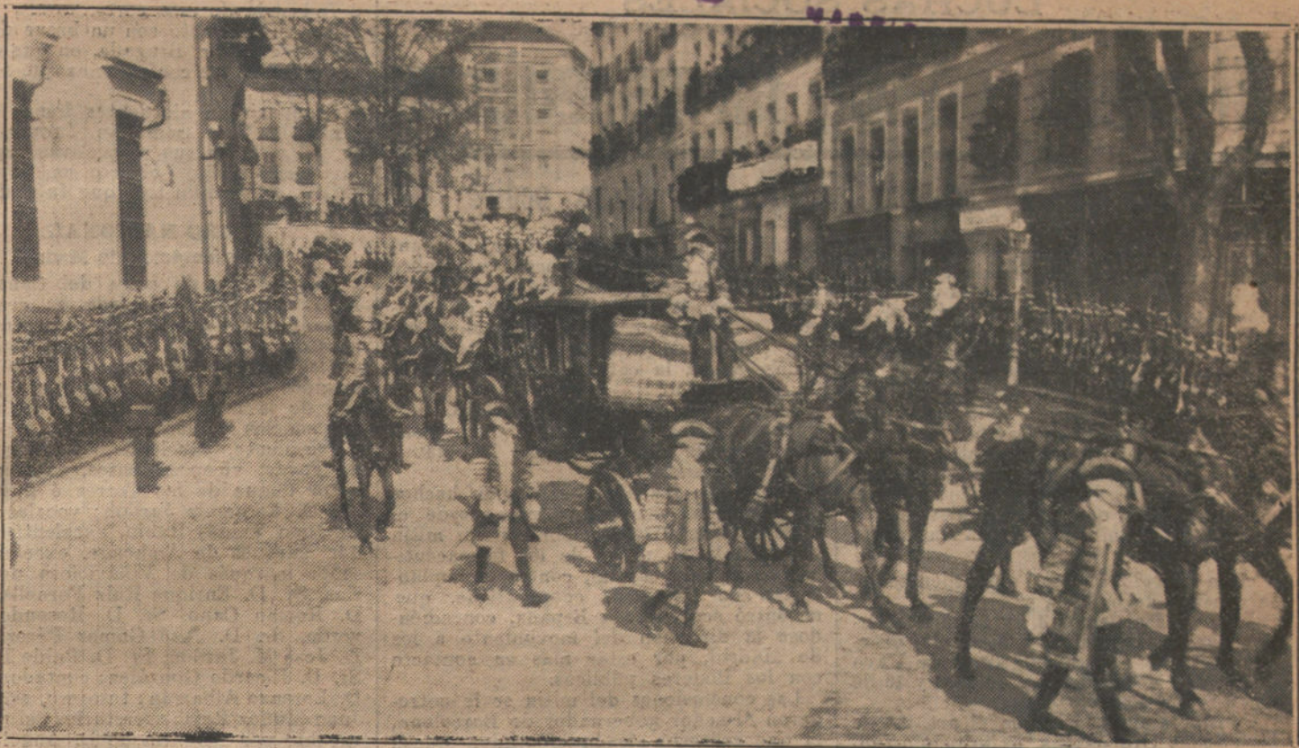
LA APERTURA DE LAS CORTES.—La carroza que conducía á S. M. la Reina Cristina y la Infanta Isabel, dirigiéndose á Palacio, después de la solemne apertura de las Cortes. (Fot. VIDAL)