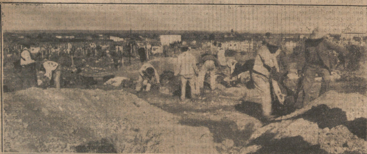
LA SITUACION DE MEJICO.—Las tropas revolucionarias de la guerrilla de Pancho Villa enterrando los cadáveres después de una acción en las cercanías de Juárez.

Las palabras de Barthou fueron acogidas con calurosos y prolongados aplausos.—Fallot.