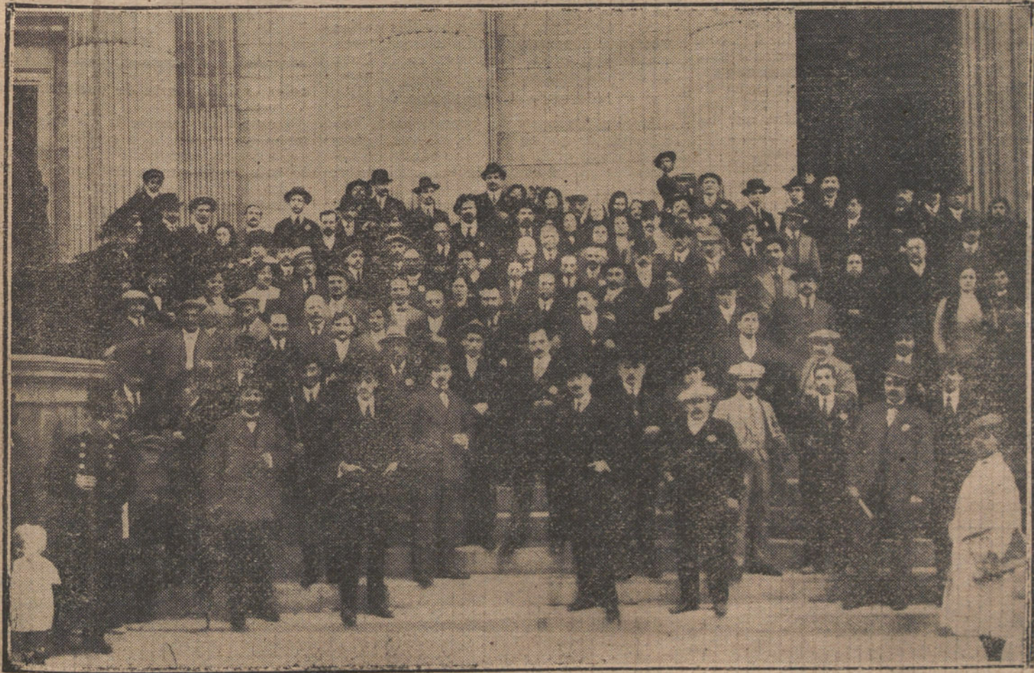
1 «Excursionistas» Ateneo Enciclopédico Popular de Barcelona, que se encuentran en Madrid, saliendo de visitar el Congreso de los Diputados.