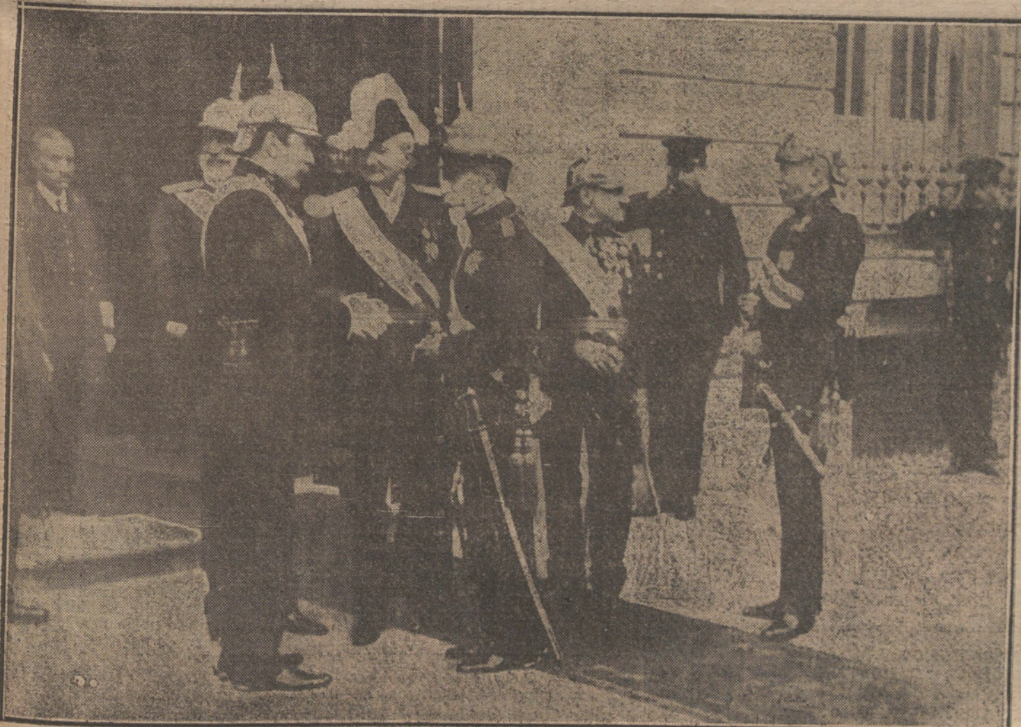
Los generales que han concurrido al Capítulo de la Orden de San Hermenegildo, a la puerta del Consejo Supremo, esperando la llegada de S. M.

llos, como si fueran pocos los que son esenciales al régimen, a pesar de la reforma introducida en el sistema electoral con los dictámenes del Supremo.