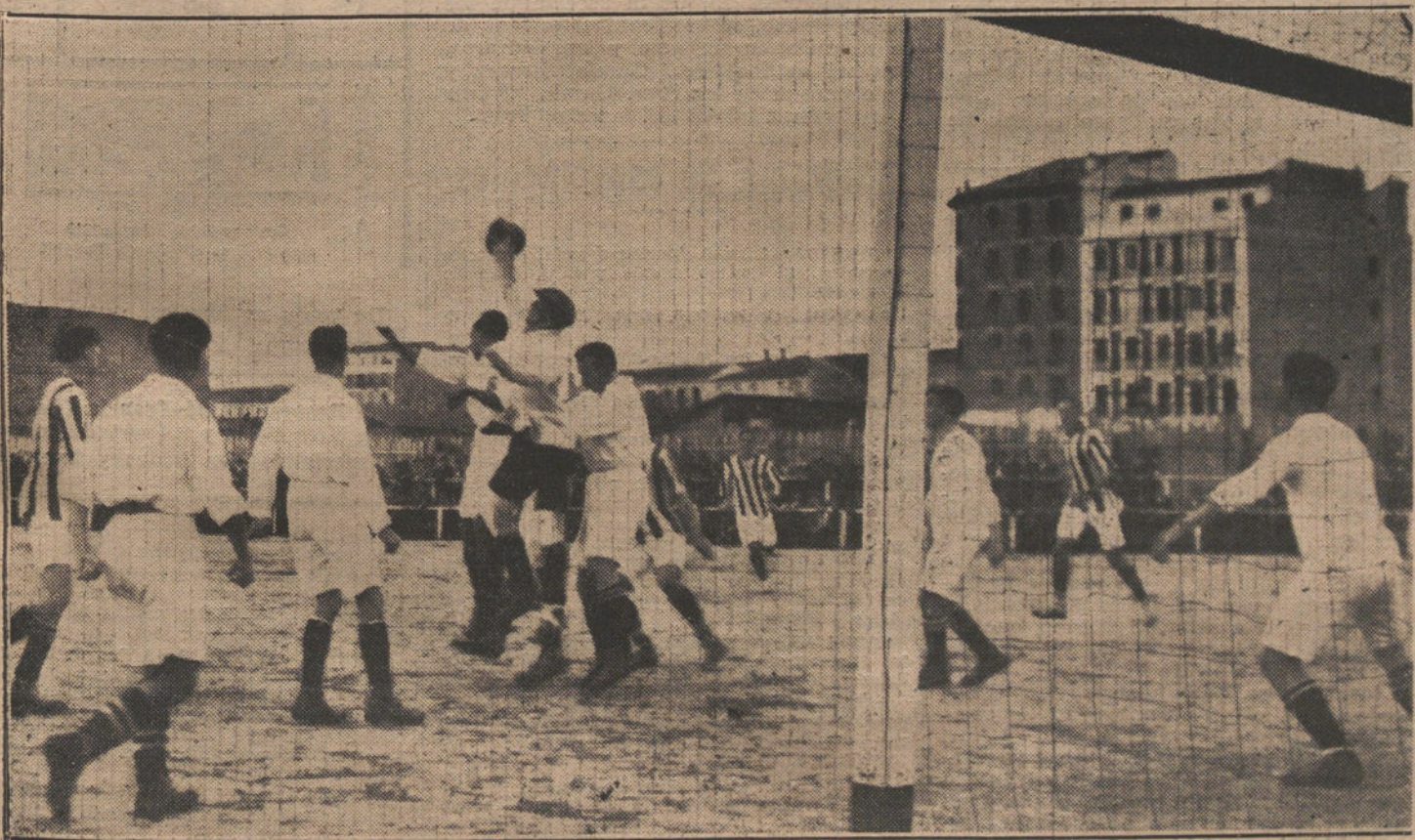
Un momento interesante del partido de «foot-ball», jugado ayer entre los equipos Madrid F. C. y Gimnástica Española, en el campo de deportes del segundo.

El secretario de Estado, Mr. Bryan, telegrafía también a dicho embajador que los Estados Unidos procuran por todos los medios inducir al citado general Carranza a que revoque la orden de expulsión decretada contra los españoles.