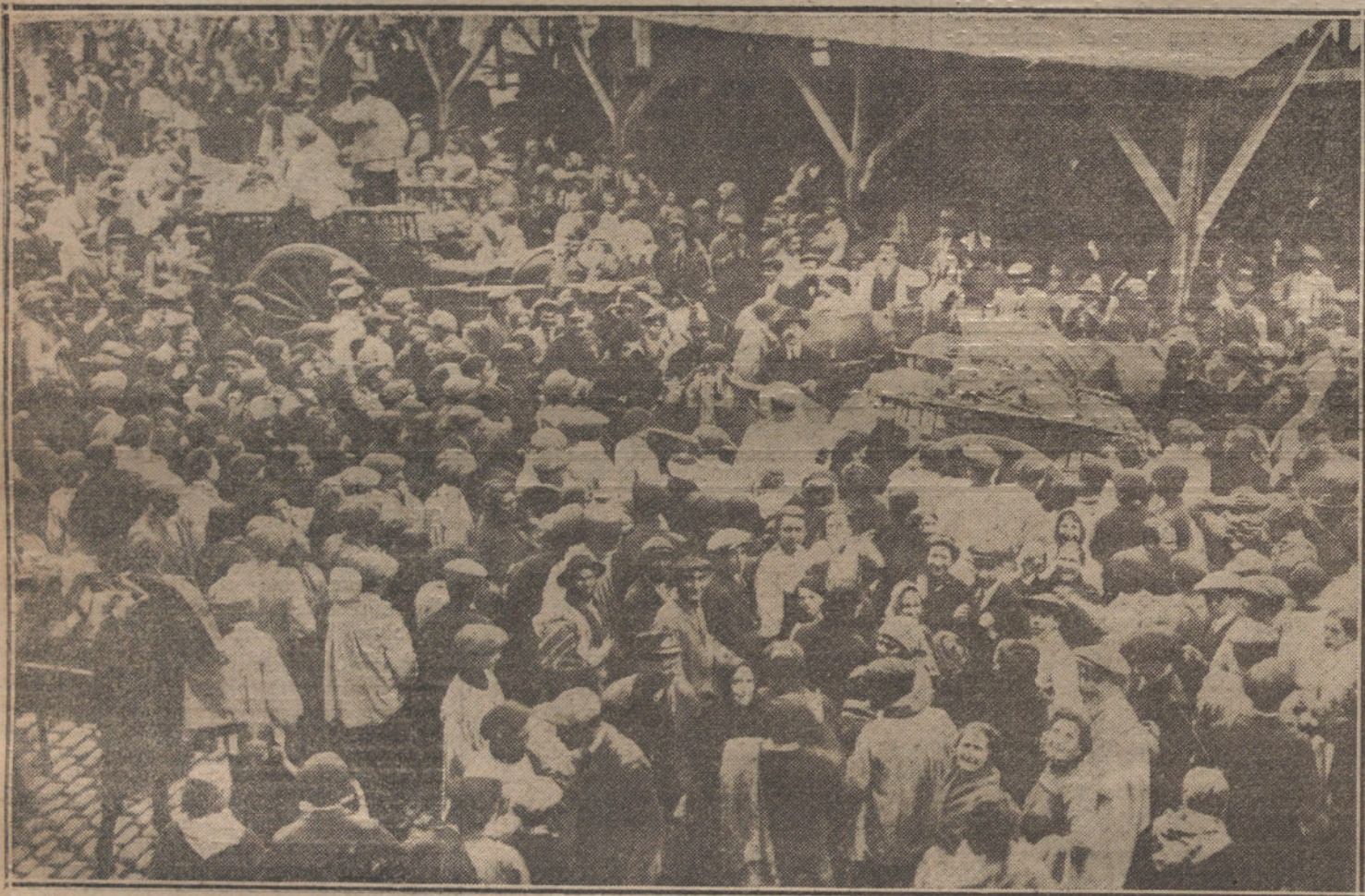
EL MOTIN DE ESTA TARDE EN LA PLAZA DE LA CEBADA.—Grupo de vendedores impidiendo la salida de los carros. (Fot. BERRIATUA).

LA TRIBUNA hace suyos tan oportunos comentarios.