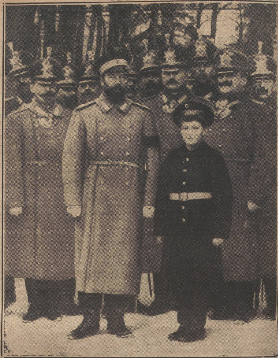
LA EDUCACION MILITAR DEL ZAREVIT.—El Emperador de Rusia y el Gran Duque heredero entre los oficiales del regimiento de la guardia Ismailowsky, cuyo cuartel visitaron días pasados.

versó afablemente con muchos de los allí presentes.