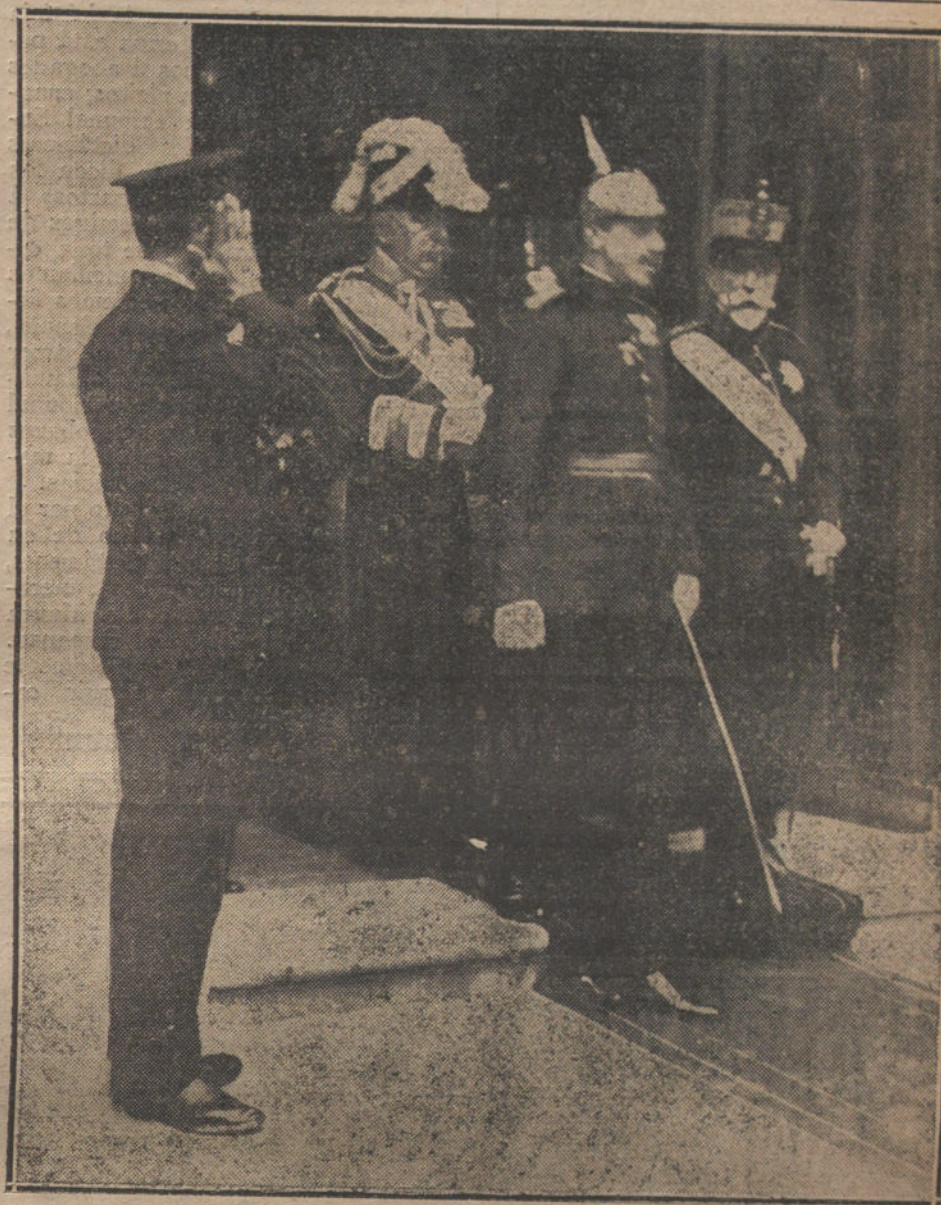
S. M. el Rey saliendo de presidir el Capítulo de la Orden de San Hermenegildo.

No hay tales carneros de soberanía ni tal ortodoxia democrática. Lo que ocurre es que el Supremo pega, y a fuerza de palizas, nos acordamos de aquella purísima y celestial Comisión de Actas que era el mismísimo Congreso en todo su esplendor soberano. No había otra para arreglar cuestiones ni para igualarla en chapucerías, enredos y trampas; y a eso se tira, a seguir fabricando embustes y chanchu-