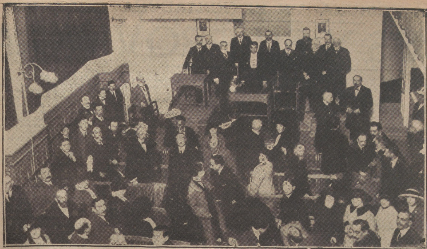
Inauguración del curso de conferencias en el Instituto Francés, acto celebrado ayer tarde con gran solemnidad.

tísima, y de la que puede decirse ha salvado el edificio. Las antiguas alcantarillas estaban cegadas o destruidas; los cimientos del palacio árabe eran depósito pluvial y de las aguas sucias de la próxima harrada. De seguir algunos años esta situación, la ruina del Alcázar habría sido inevitable.