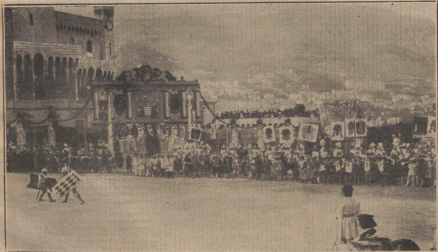
Un momento de las justas celebradas en Mónaco con motivo de las fiestas con que se ha solemnizado el XXV aniversario de la proclamación del Príncipe Alberto I.

Pero, sucesivamente, los propósitos se malograron. La aparición de los acaparadores puso un sobreprecio en todas las mercancías. Después, los revendedores