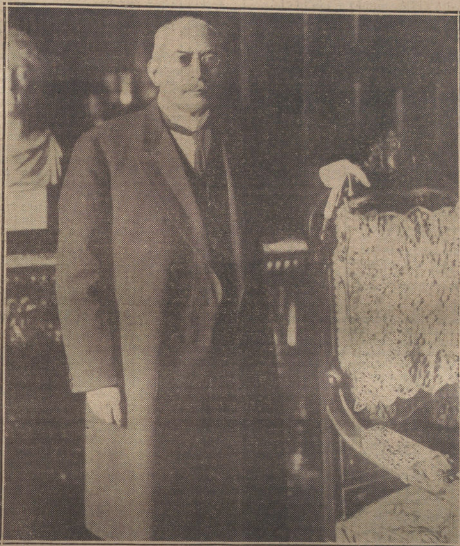
LA SITUACION DE MEJICO.—Ultimo retrato del general Victoriano Huerta, cuya actitud frente á los Estados Unidos es estos días el tema preferente de la política internacional.

En lugar próximo al barco se situaron las autoridades, las Comisiones, las señoras y la familia del heroico marino cuyo nombre lleva el barco.