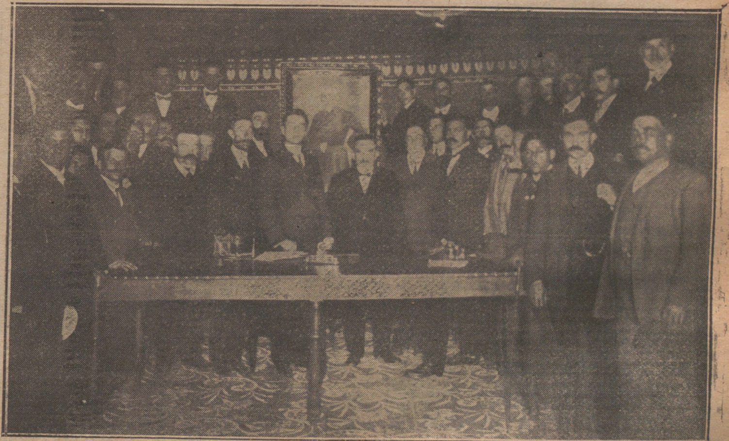
La presidencia de la Asamblea de la Juventud Maurista de Castilla, celebrada recientemente en Valladolid.