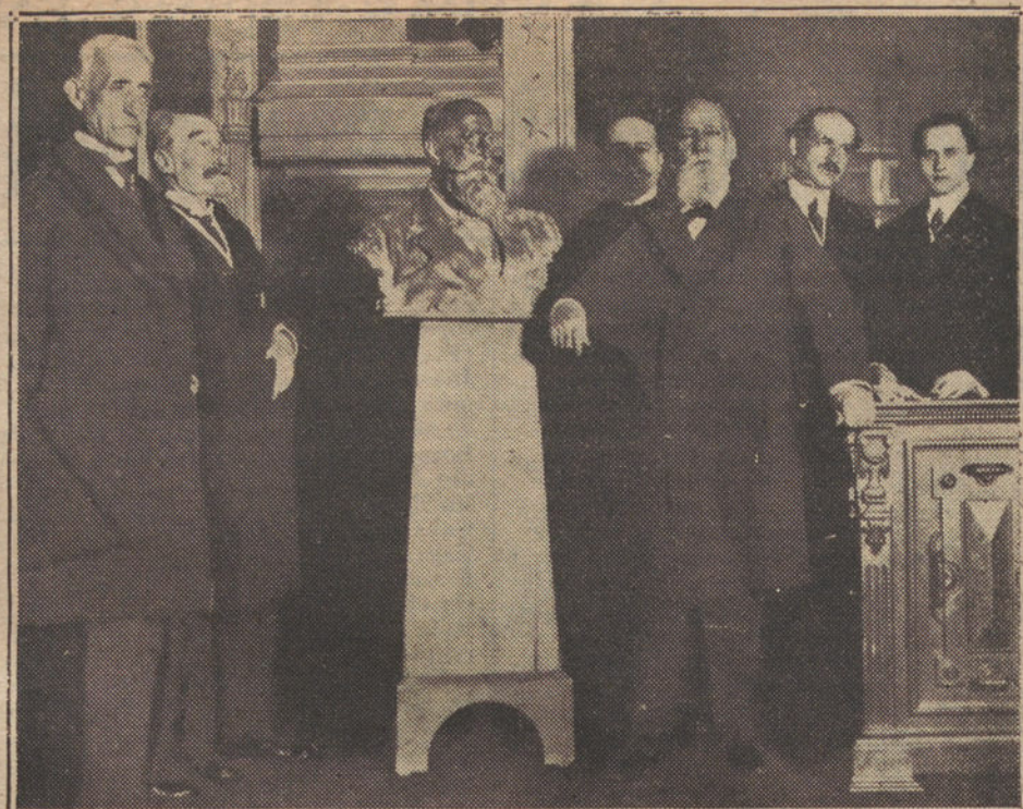
Velada en memoria de Moret, celebrada anoche en el Ateneo de Madrid.