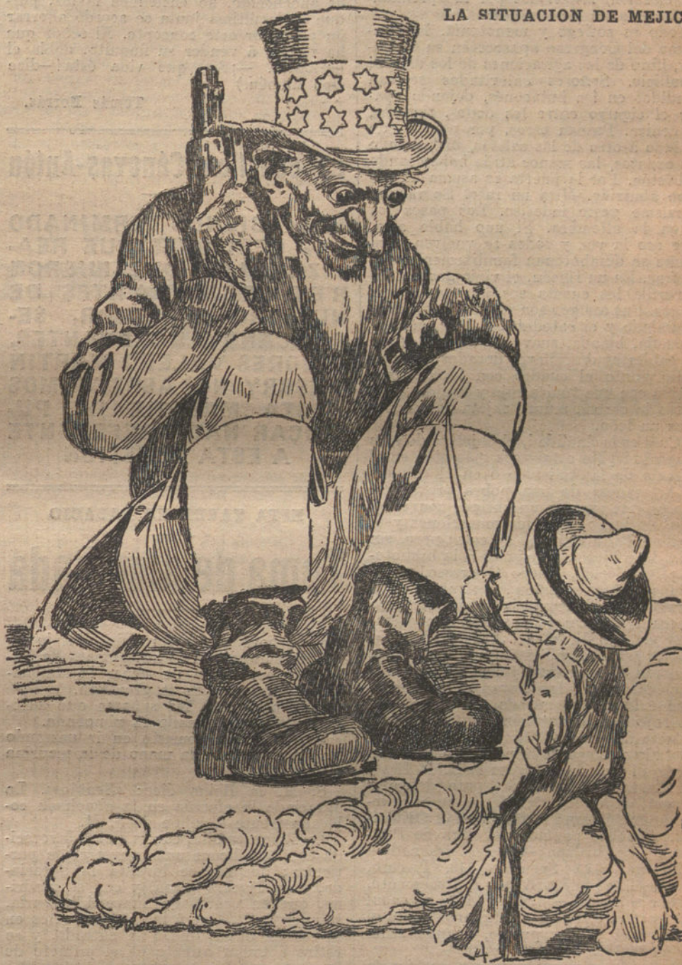
El Tío Sam. — ¡A la una... a las dos...!

Mensaje de la Corona? ¿Habrá hecho unas elecciones llenas de lodo y de sangre, sin obtener mayoría, y deshonrando los procedimientos nobles y altruistas de equidad y limpieza? ¿Por qué se dice entonces que el Gobierno se inspira en la orientación conservadora? ¿Como no se diga para probar la resistencia para la frescura de ciertos temperamentos políticos!