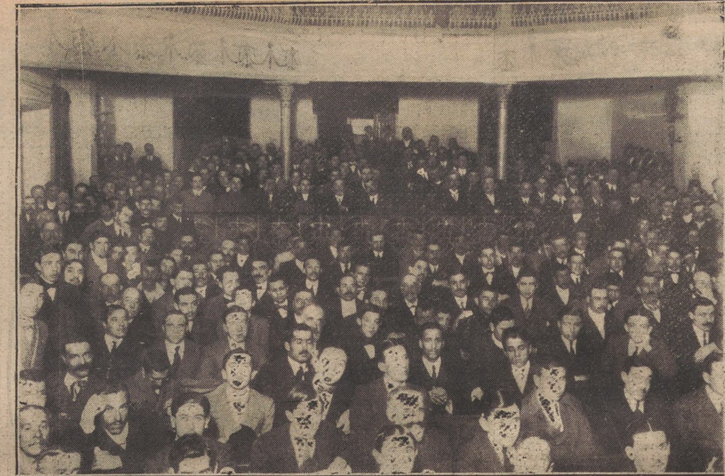
Aspecto de la sala del Coliseo Imperial durante el mitin jaimista celebrado esta mañana.

«Cuál de vosotros diariamente, al levantarse, no ve en el teatro de su vida una butaca vacía? Para los muy dichosos, todas las butacas estarán ocupa-