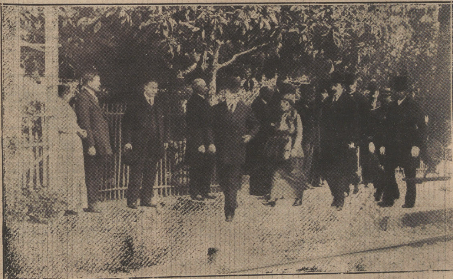
EL VIAJE DE POINCARÉ.—Llegada del Presidente de la República francesa y su señora á la estación de Ere les Pins, donde Poincaré tiene grandes posesiones.