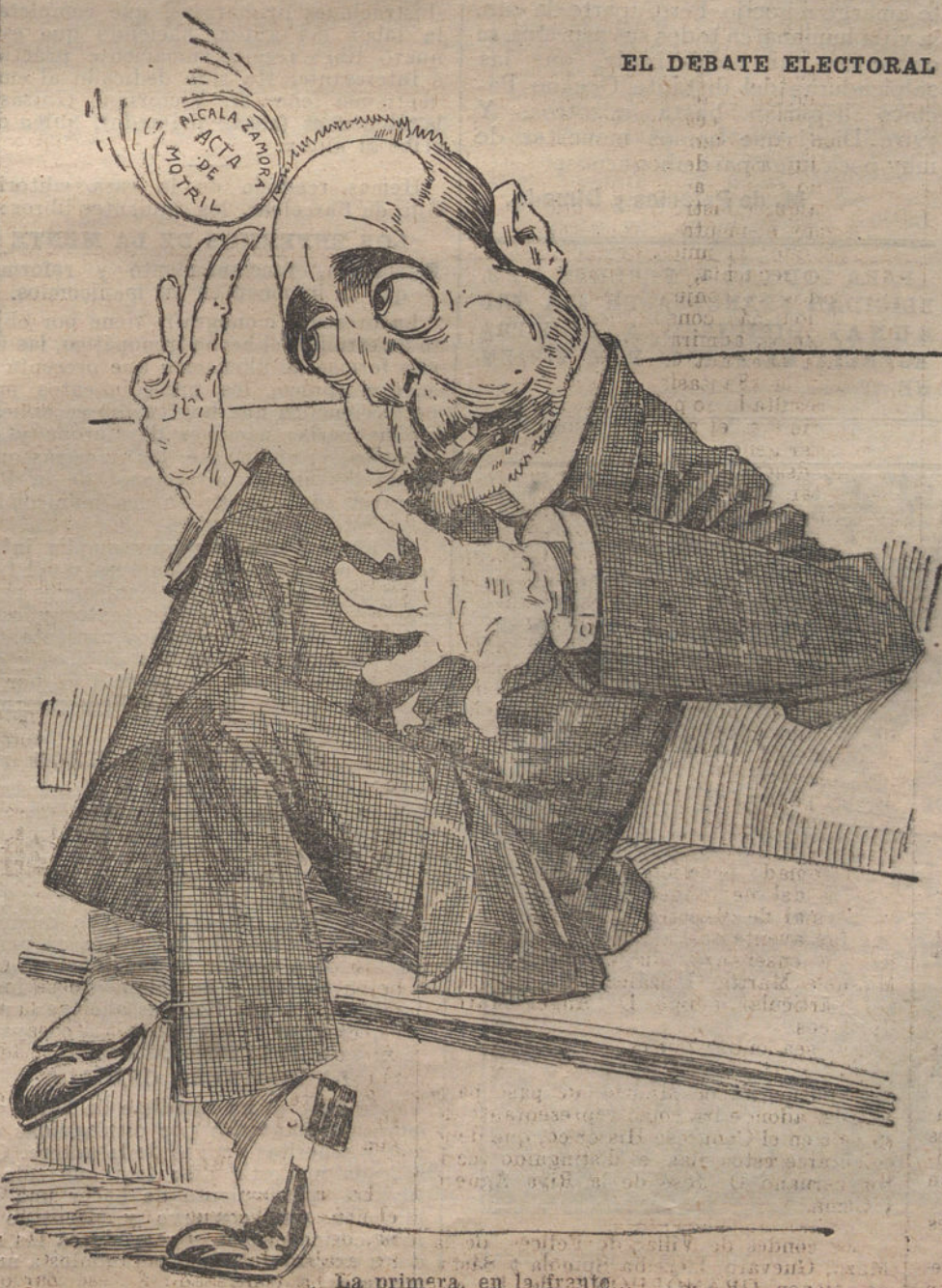
La primera, en la frente.